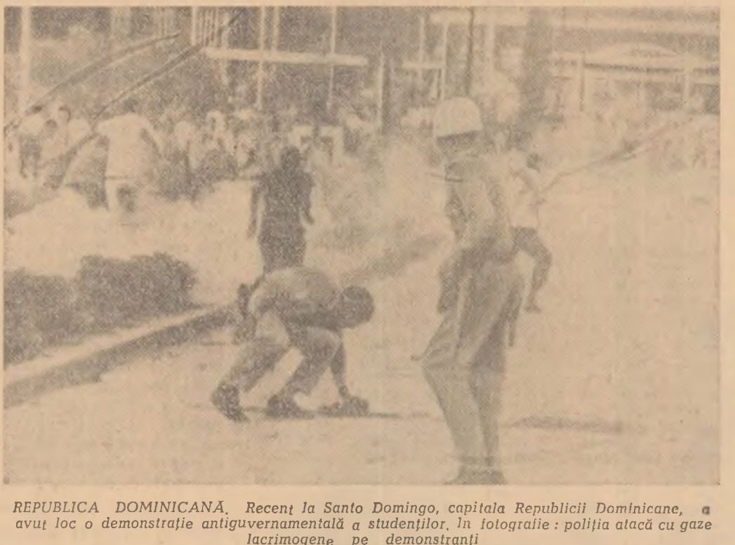
REPUBLICA DOMINICANĂ. Recenț la Santo Domingo, capitala Republicii Dominicane, a avut loc o demonstrație antigovernamentală a studenților. În fotografie: poliția atacă cu gaze lacrimogene pe demonstrați

Frontul de eliberare din Vietnamul de sud a cerut noului guvern al acestei țări să satisfacă un număr de revendicări dintre cele mai importante ale poporului sud-vietnamez. Frontul de eliberare subliniază că în actuala situație cerurile conducătoare din Vietnamul de sud trebuie, înainte de toate, să distrugă toate satelii și cartierele strategice, să elibereze pe toți deținuții politici, indiferent de tendința lor, să respecte fără înfrîngere libertățile democratice.