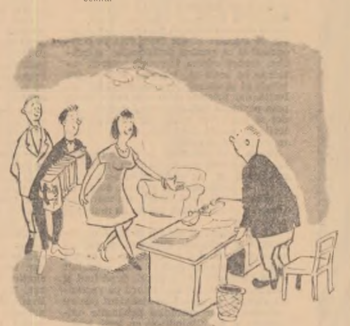
IN BIROUL DIRECTORULUI CASEI DE CULTURĂ — Dumneavoastră... dansați?