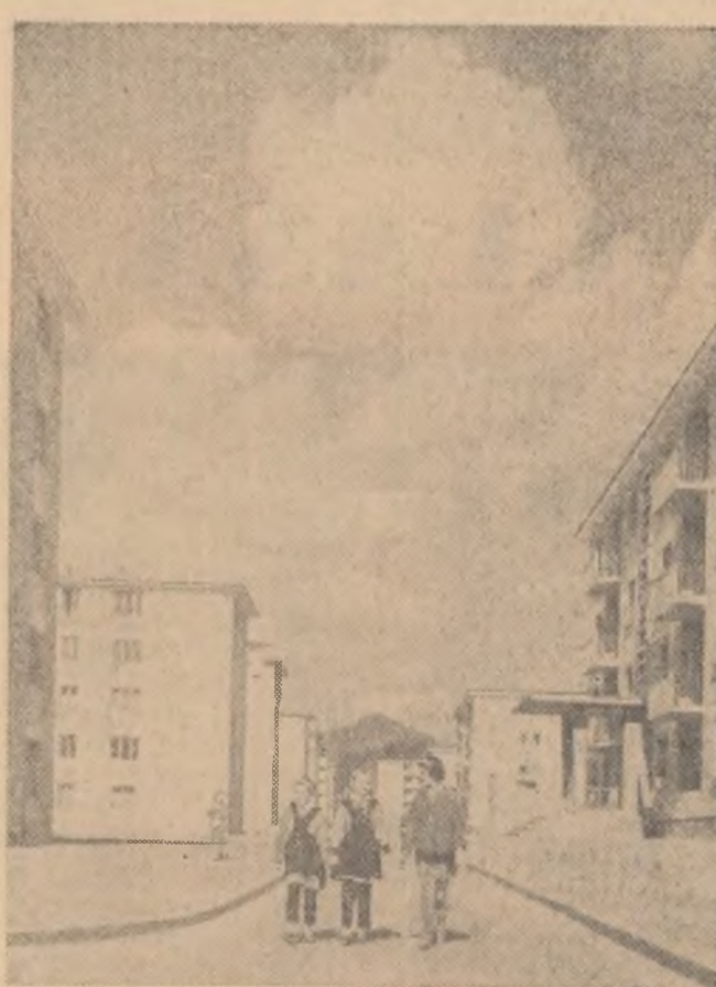
În cartierul „Aeropor” din Petroșani se află în construcție un mare ansamblu de locuințe. În fotografie: vederea parțială a cartierului „Aeropor”.