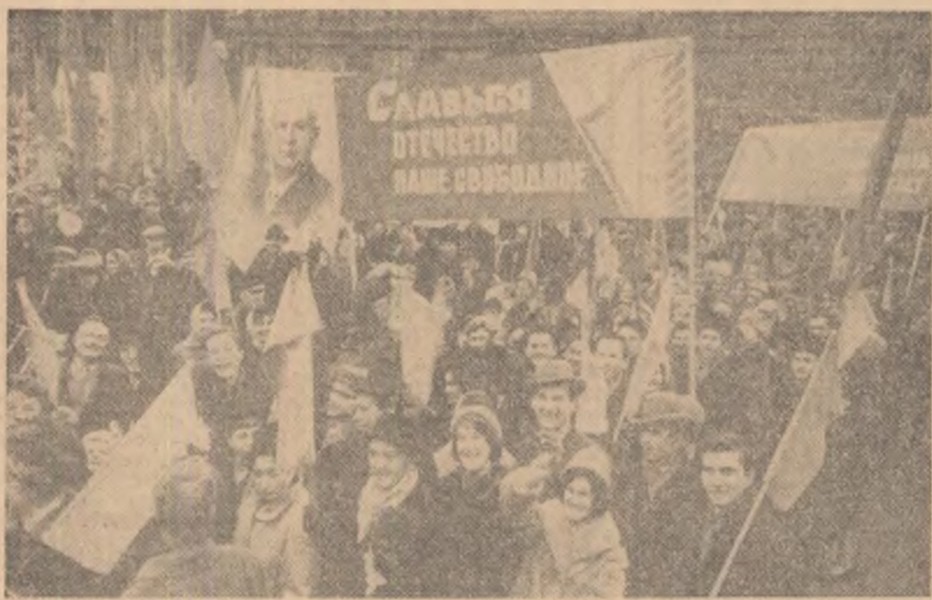
Aspect de la demonstrația oamenilor muncii din Moscova.

MOSCOVA 7 (Agerpres). — După cum transmite TASS, la 7 noiembrie în întreaga Uniune Sovietică a fost sărbătorită cea de-a 46-a aniversare a Marii Revoluții Socialiste din Octombrie.