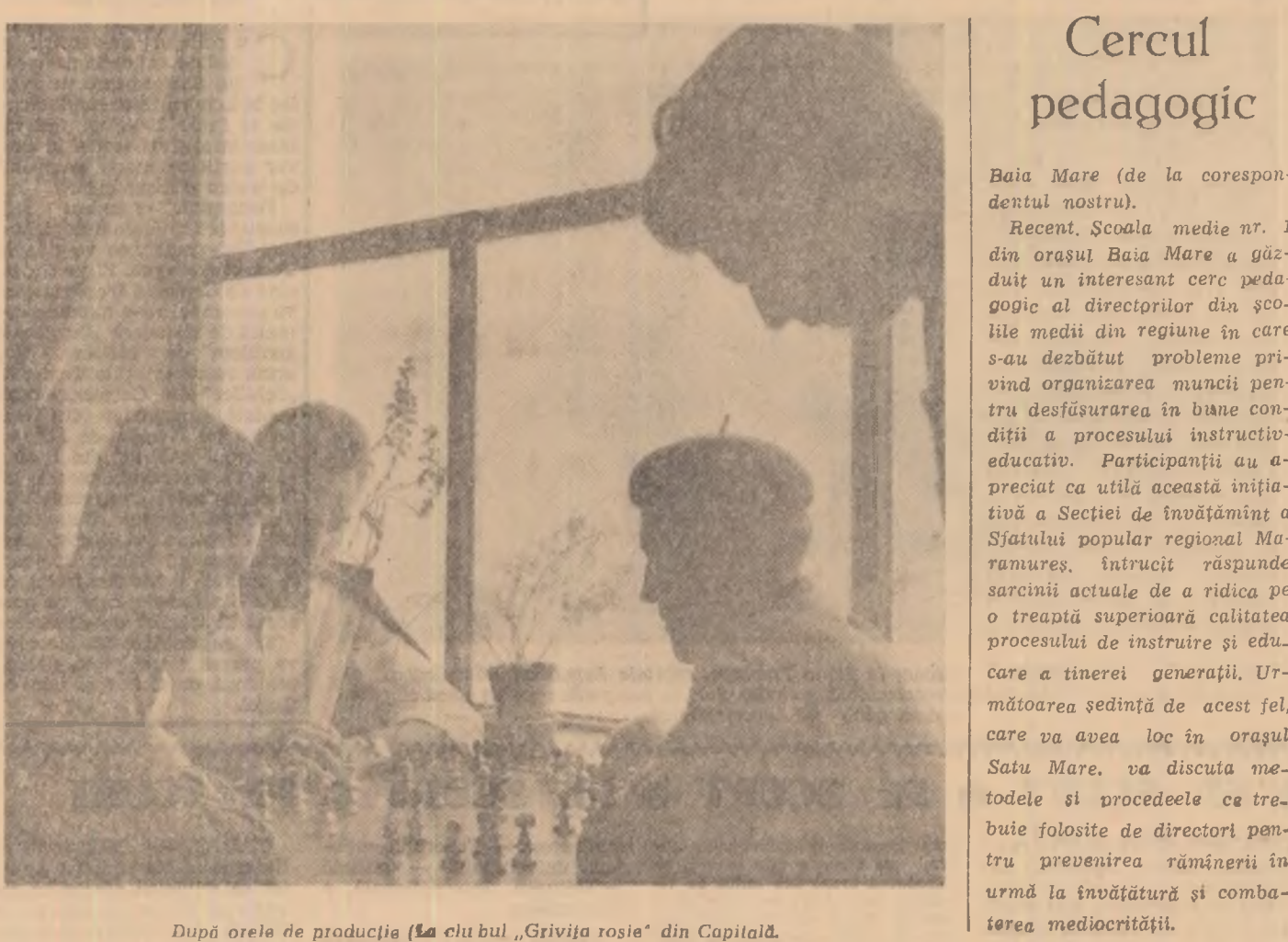
După orele de producție (La culburi „Grișia roșie” din Capitală).

În scopul îmbunătățirii calității pieselor, comitetul va lua măsuri pentru a-și sprijini pe tineri în folosirea dispozitivelor (de copiat, de strîngere-prindere) și a centrilor cu plăcuțe dure. În acest scop împreună cu