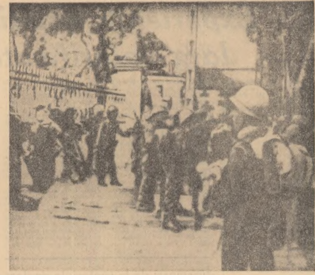
SAIGON. În fața palatului guvernamental după recenta lovitură de stat din Vietnamul de Sud.

PARIS 8 (Agerpres). — Separatistul katanghez Chombe, care se află în prezent în Spania, a declarat că intenționează