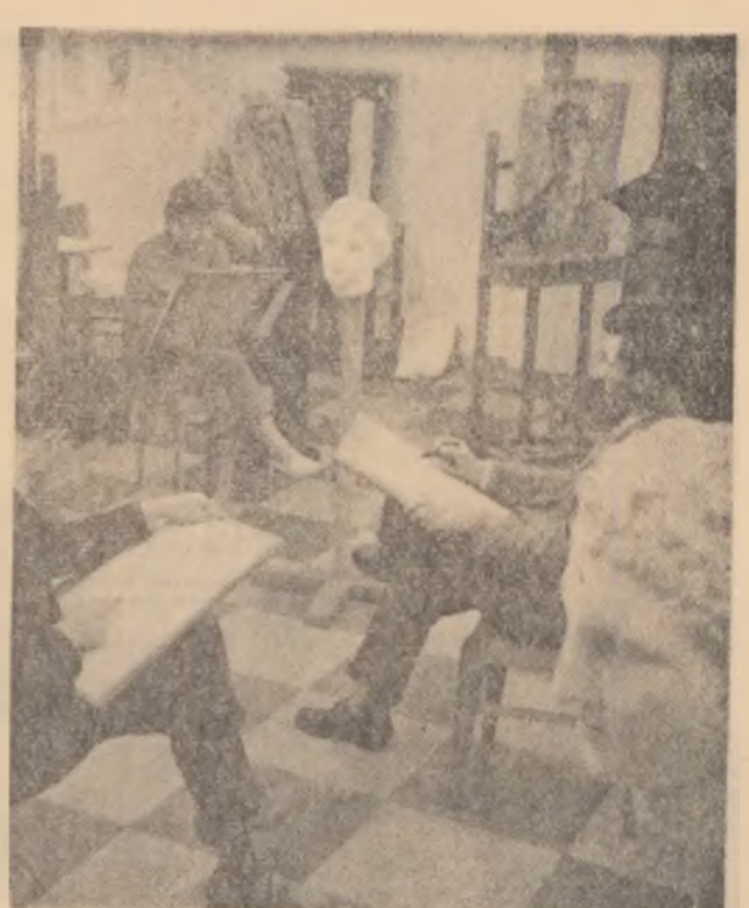
Sedinta de lucru a pictorilor amatori de la Casa de cultura a tineretului din Iasi.