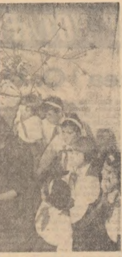
În camera de povești de la Casa pionierilor din Bacău.

În jurul orei 14.30 transmisiune de la Stadionul Republicii a meciului de fotbal dintre echipele Dinamo București — Petrolul; 17.00 Aspecte de la Campionatele internaționale de gimnastică ale R. P. Române; 19.00 Jurnalul televiziunii; 19.10 Emisiune pentru copii; 19.20 În fața hărții; 19.30 Dramatizare după „Oameni sărmani”; 20.40 Filmul „Tu ești minunat”; 22.15 Muzică ușoară instrumentală. În încheiere: Buletin de știri, sport, buletin meteorologic.