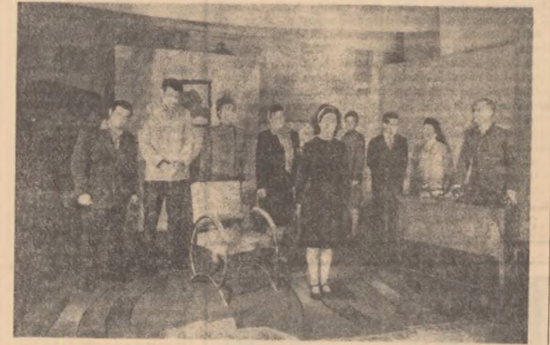
Scenă din piesa „Oameni și umbre” în interpretarea formației de teatru a clubului muncitoresc „Siderurgistul” din Hunedoara.