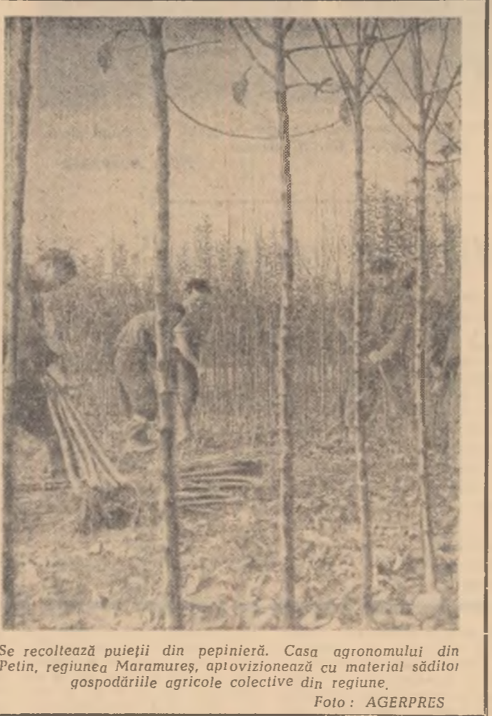
Se recoltează puieții din pepinieră. Casa agronomului din Petin, regiunea Maramureș, aprovizionează cu material săditor gospodăriile agricole colective din regiune.