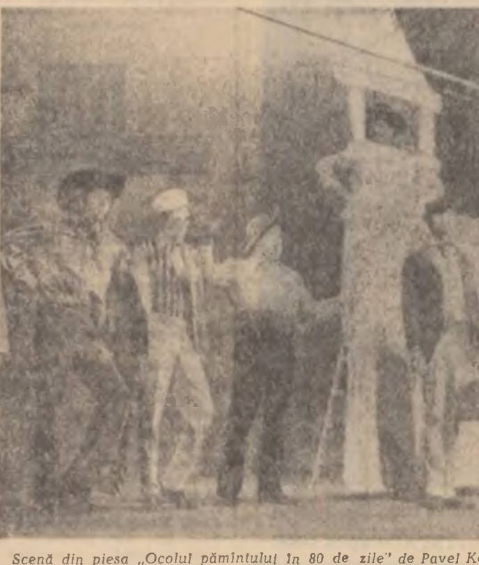
Scenă din piesa „Ocolul pămîntului în 80 de zile” de Pavel Kohout, după romanul cu același nume de Jules Verne — recentă premieră a Teatrului pentru tineret din București.

În schimbul unor înregistrări ale caselor de discuri „Deutsche Schallplatten” din R. D. Germană și „Polskie Nagrania” din Varsovia au fost trimise, de asemenea, numeroase înregistrări de muzică simfonică și populară romînească.