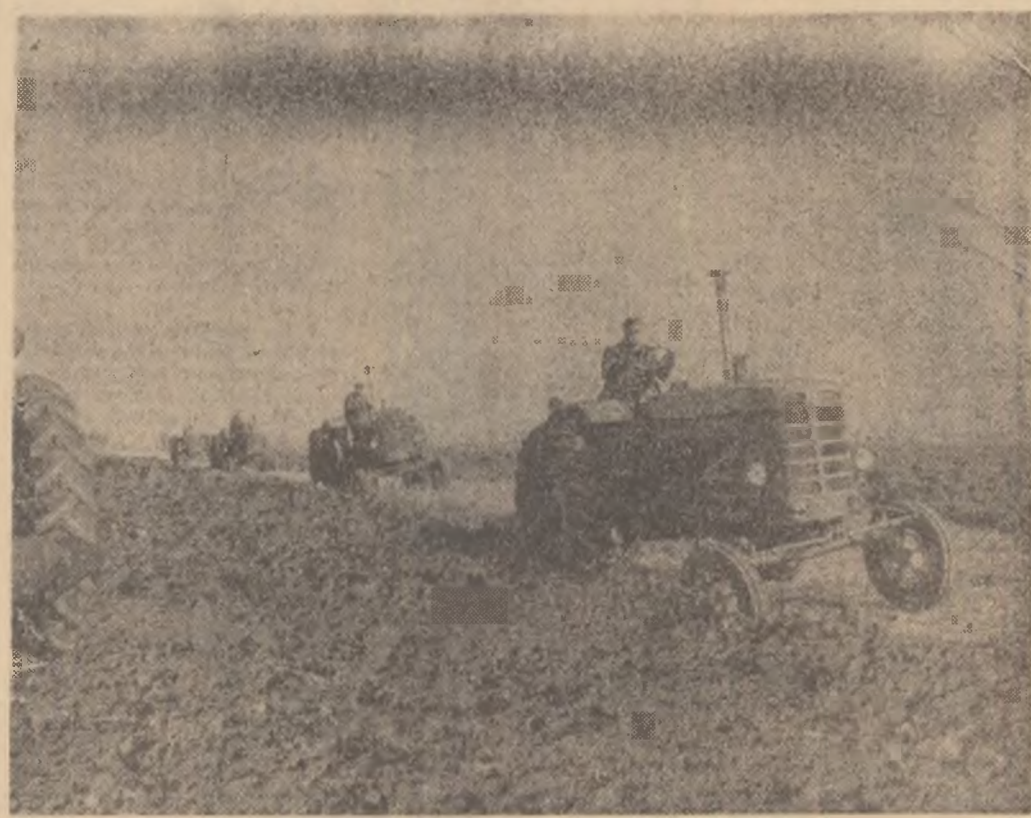
La G.A.S. Popești-Leordeni, regiunea București, se desfășoară intens arăturile adînci de toamnă. Pînă în prezent, aici au fost arate peste 300 hectare. În fotografie: o parte din tractoarele gospodăriei la lucru.

ing. IOAN ARTHUR (Continuare în pag. 3-a)