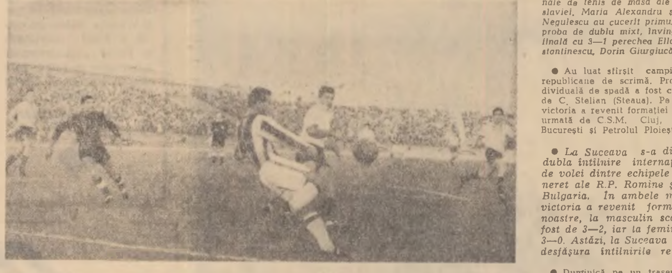
O lăcă din întîlnirea Farul-Steaua, disputată duminică pe Stadionul Republicii

Ceea ce așteptăm cu toții de la Dinamo-București este ca