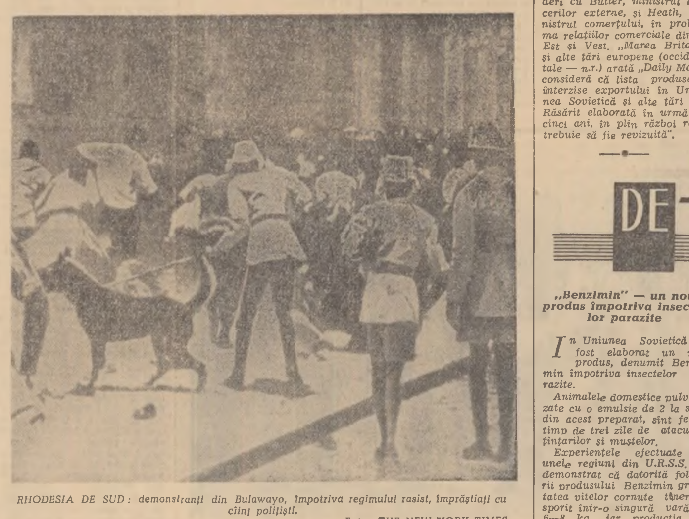
RHODESIA DE SUD: demonstrații din Bulawayo, împotriva regimului rasist, împărțit în cinci poliștii.

Potrivit ziarului londonez „Daily Mail” în capitala britanică Bonn au avut loc într-o zi, miercuri, 10 noiembrie, negocierile politice cu Rolf Lahr, secretar de stat pentru afacerile externe. După cum relatează agenția D.P.A., un purtător de cuvânt al guvernului de la Bonn a precizat că discuțiile s-au referit la chestiuni privind negocierile pregătitoare ale conferinței din cadrul G.A.T.T. privitoare la problemele vamale dintre S.U.A. și Piața comună, ca și relațiile economice dintre țările Pieței comune și Statele Unite.