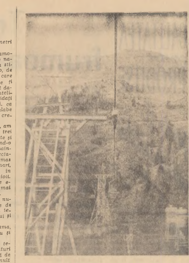
Cu telefericul, spre Vîrful cu Dor

Dinamo București are deci o sarcină destul de dificilă. Important este însă ca însprezecele dinamovist să arunce în luptă toate forțele, băieții să nu intre pe teren crispați (atenție în special la primul sfert de oră, care nu mai departe de jumătate de oră, când „neva” din București, sau face tot ce e posibil să învingă, să se scutită de emoții pe teren propriu. Dacă la Real se gîndește că există, în joc deschis, combativ, cu atacuri insistente și variate la poartă, însprezecele dinamovist (reintroducerea lui Varga în formație este bine venită) trebuie, prin urmare, să atace din primul minut, să excludă din joc pe jucătorii care se pot răzui, să sune din toate pozițiile și, mai ales, de la distanță, pentru că, avînd în față apărătorii de talia unui Santamaria, va fi destul de greu ca în-