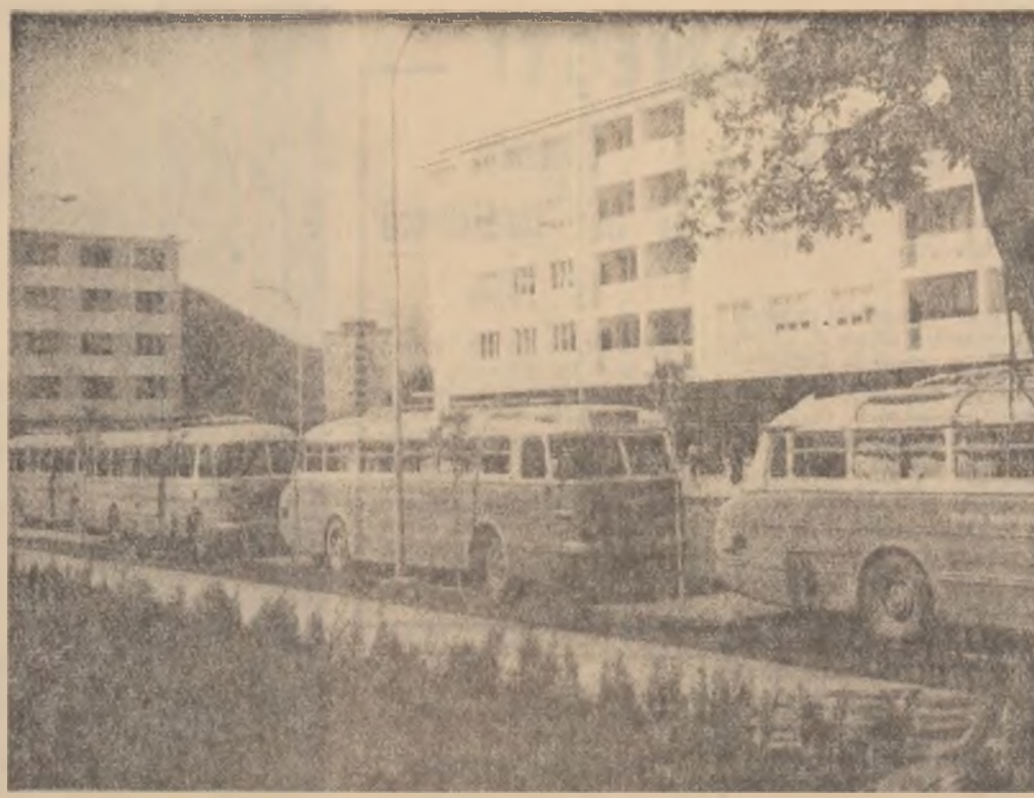
Onești — un centru turistic mult căutat în orice sezon.