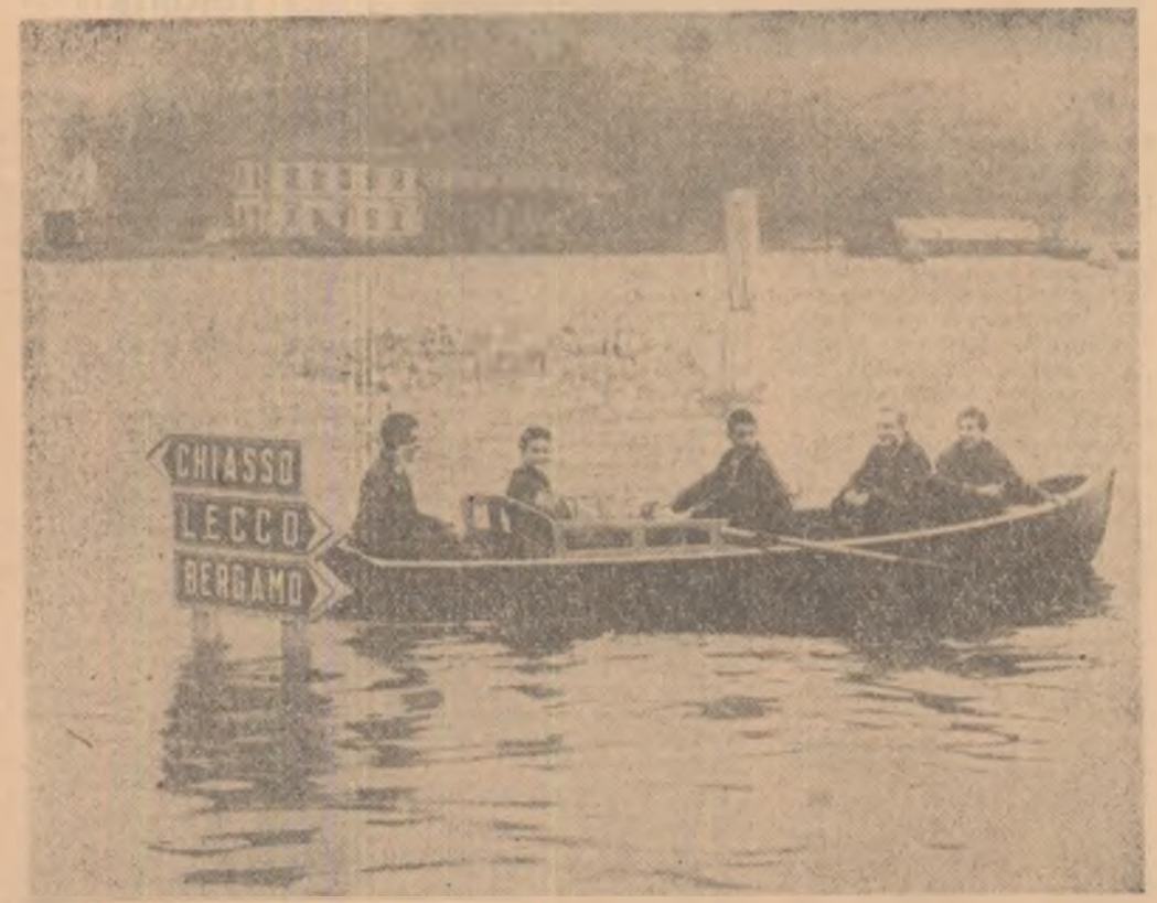
ITALIA. Din canalul pllor abundente care au cîzuit în ultimul timp, apele lacului Como, din nordul Italiei, s-au revărsat, inundînd străzile orașului cu același nume. In fotografia: pe această stradă a orașului Como, tinerii din barcă se plimbaseră cu o zi înainte cu biciclete.

O cometă care dă din... coadă străinește în prezent senzație în rîndurile astronomilor. Cometa, numită „Burnham 1960 II”, fusese văzută pentru prima oară în 1959 dar era considerată ca un „caz normal”. Anul acesta însă astronomul belgian Daniel Malaise a constatat că coada cometei Burnham, care are o lungime de 2 800 000 km., oscilează ritmic la intervale de patru zile și în cadrul unui unghi de 75 grade. Expunîndu-și observațiile în „Astronomical Journal”, Malaise, care lucrează la observatorul astrofizic Smithsonian și la observatorul universității Harvard, arată că în aceste intervale coada cometei se desface în mai multe „codici”, care apoi se întregesc înainte de începerea unui nou ciclu de patru zile.