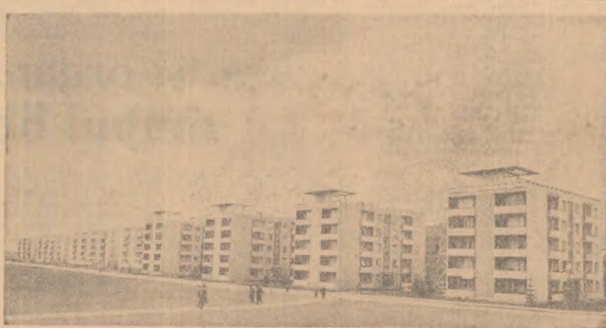
Noi blocuri de locuințe în cartierul „Tractorul” din orașul Brașov.

Azi am încrestat în grindă... de Marcel Breslașu