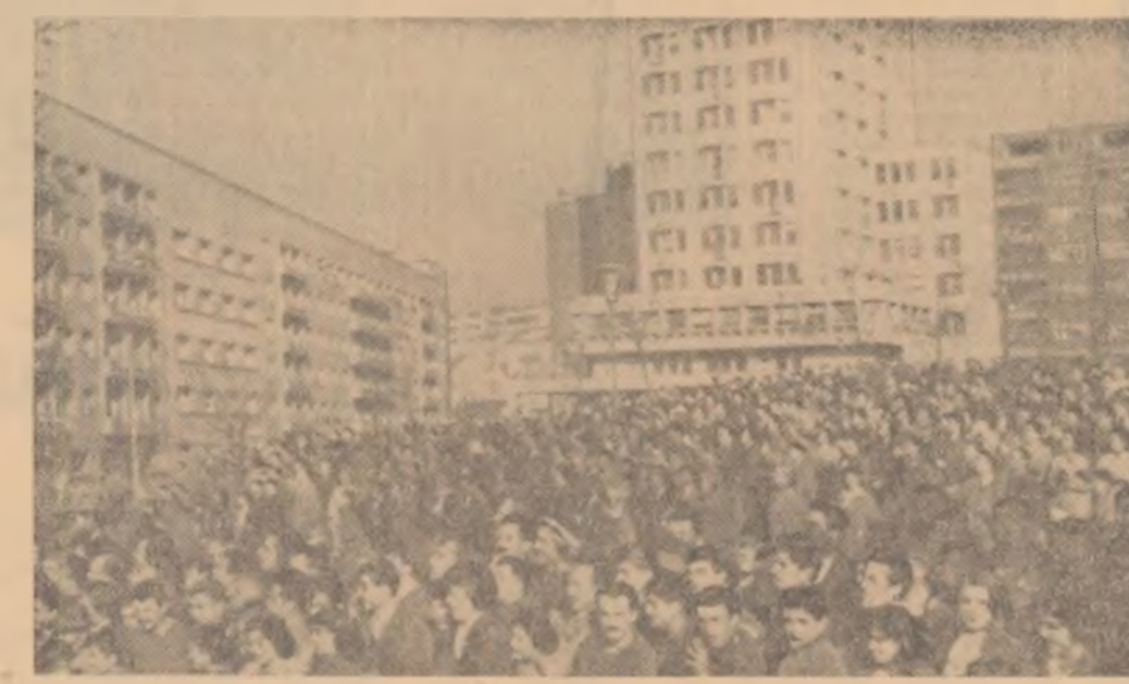
La sosire, în gara Belgrad (fotografia din stînga) Localitii Belgradului salută pe înalții oaspeți romîni (fotografia de sus)