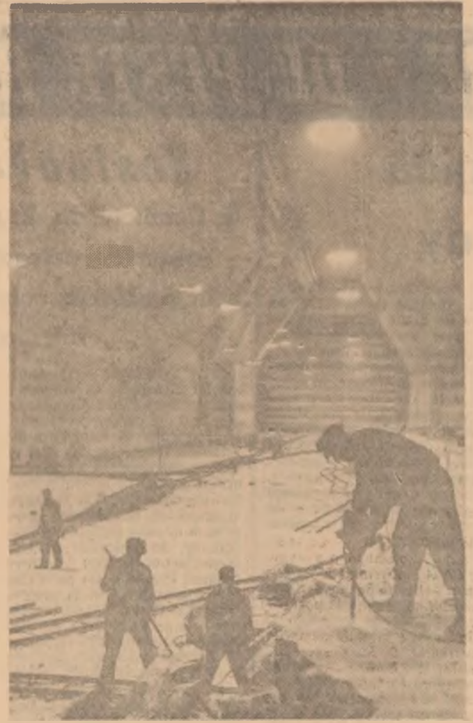
Salina „Slonic Prahova” datează din anul 1685 și este una din cele mai mari exploatare de sare solidă din țară. Zilnic de aici — datorită procesului ridicat de mecanizare și automatizare — se extrag circa 60 vagoane de sare. În fotografie o vedere de ansamblu a zonei lor de exploatare.

Marti, de la ora 18.30, în sala sporturilor de la Ploiești, se va desfășura întâlnirea internațională feminină de handbal dintre echipele Rapid București și Subotiza