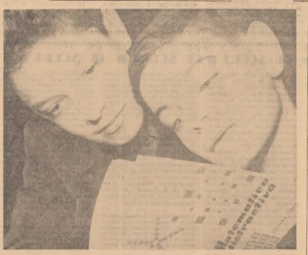
În lumea atât de fascinantă a matematicii. În fotografie, doi pasionați matematicieni.

cărbune pe post, iar prețul de cost pe tonă de cărbune se va reduce cu 1,73 lei. În cea mai mare parte, nolle cifre de plan se vor realiza pe seama introducerii în continuare a tehnicii noi în abataje și a folosirii pe scară și mai largă a metodelor avansate de muncă. Astfel minierii vor primi în dotare o combina nouă de tăiat și încărcat cărbune de tip I K 52 M și încă două pluguri de cărbune de înaltă productivitate. Susținerea metalice se vor extinde atât la înaltările în galerii cit și în abataje. Folosind și în noul an experiența acumulată pînă în prezent, la E. M. din Lupeni va începe în curind o nouă serie de cursuri de specializare și ridicare a calificării. În sectoarele unde vor intra utilaje și mecanisme noi, minierii vor fi specializați prin cursuri teoretice