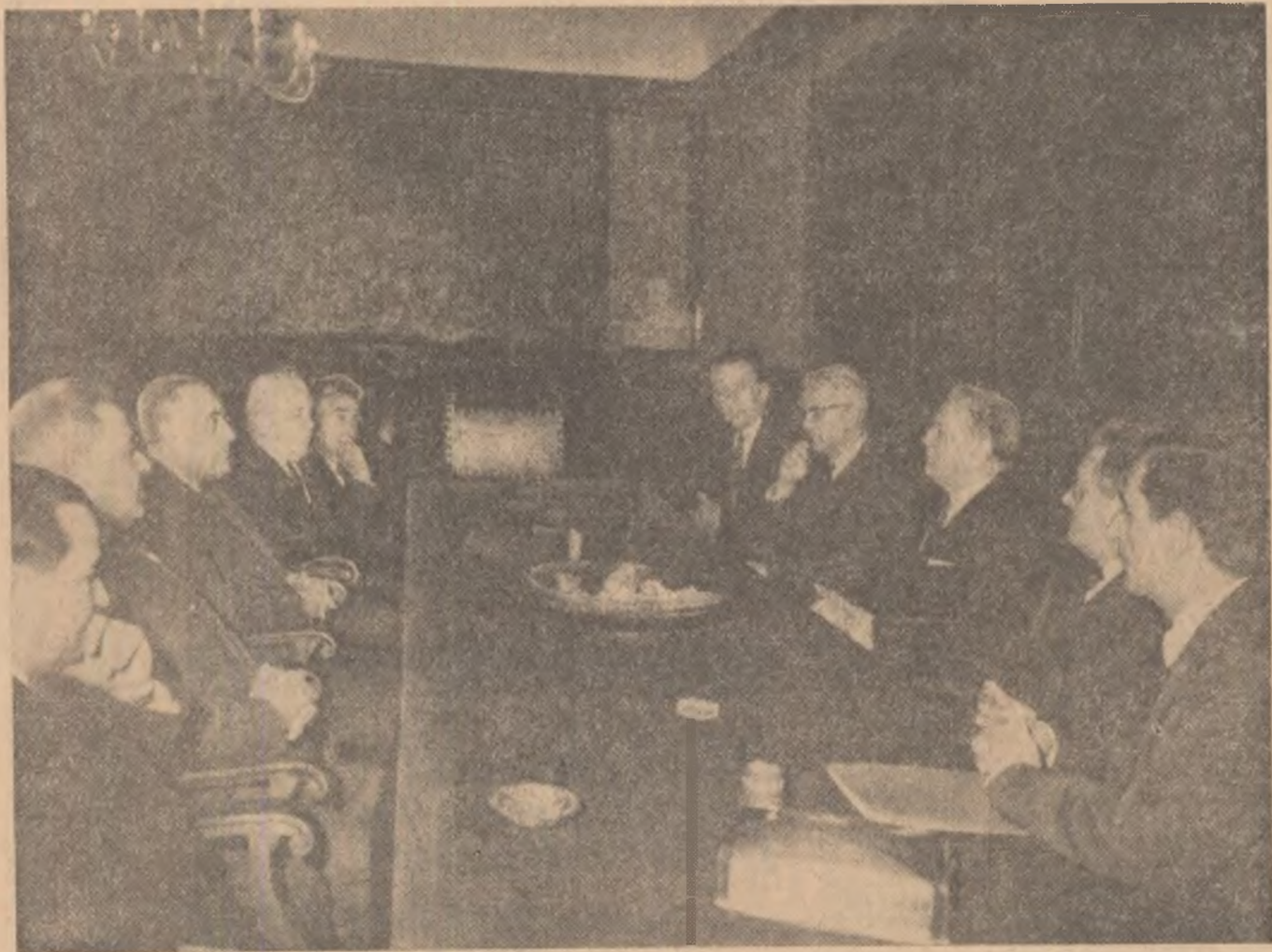
In timpul convorbirilor dintre delegația R. P. Romine și delegația R. S. F. Iugoslavia

Continuarea convorbirilor dintre delegația R. P. Romine și delegația R. S. F. Iugoslavia