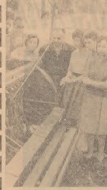
Lección despre mașinile agricole în sala de studii din grupă 2204 anul II horticultură al Institutului agronomic „N. Bălcescu” din București.

„Profesor în înțelesul cel mai înalt al cuvintului, profesorul Cantacuzino a știut să însușească elevilor săi, căroră le-a dat cea mai desăvârșită pregătire tehnică, nobila pasiune a cercetării științifice unite cu prețuirea operelor de artă.”