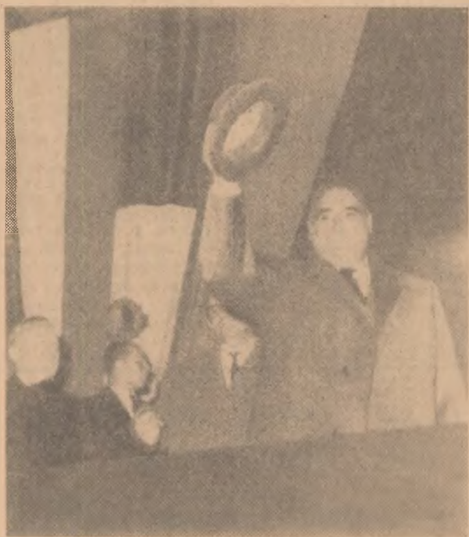
Aspect de la tribună în timpul mitingului.

Toate acestea sînt o mărturie a hărniciei și priceperii colectivului dv. care aduce un a-