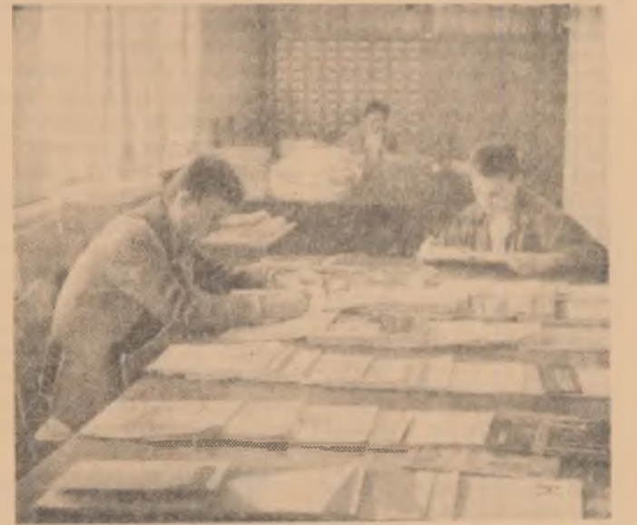
Biblioteca tehnică a Uzinelor „23 August” din Capitală este frecventată de peste 7 000 de cititori. Ea posedă 45 000 de cărți și peste 100 de titluri de reviste de specialitate.

18,30 Universitatea tehnică la televiziune; 19,00 Jurnalul televiziunii; 19,10 Știință și senzații copii? — „Albă ca zăpada” — povestire de Oclav Program: Desenează Iurie Darie; 19,35 Emisiune de știință — Prezențe invizibile; 19,55 Mîngea năzdrăvană — o satiră la adresa nespectării regulilor de fotbal tratată cu mijloacele desenului animat; 20,05 Pretutindeni muncesc oameni — un documentar din viața oamenilor care muncesc în singurătate; 20,25 Teatru, artă realistă (IX) — Moliere. În program „Don Juan”, „Mizantropul” și „Improviția la Versailles”. În încheiere: Buletin de știri, buletin meteorologic.