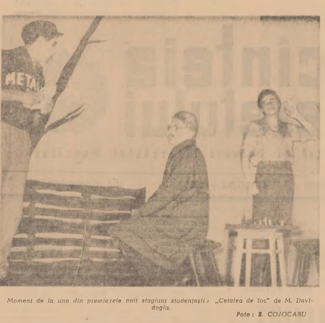
Moment de la una din premierele noii stagioni studentești: „Cetelea de loc” de M. Davidoglu.

V. AXENCIUC: Un manual util de economie politică a capitalismului.