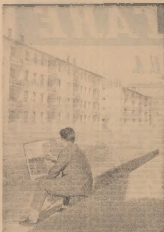
Motiv de inspirație, în noul cartier al orașului Birlad.

LIUBLIANA 27 (Agerpres). — Miercuri dimineața a avut loc la Liubliana o nouă întâlnire între Alexandru Bîrlădeanu, vicepreședintele al Consiliului de Miniștri al Republicii Populare Romine, și Milos Minic, vicepreședintele al Vecei Executive Federative a R.S.F. Iugoslavia. Cu acest prilej, Alexandru Bîrlădeanu și Milos Minic au discutat probleme economice interesind cele două țări.