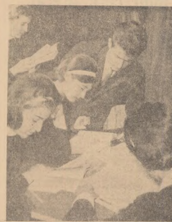
Fiecare din elevii Școlii medii nr. 2 din Ploiești găsește în Bibliotecă școlii ceva interesant de citit.

În cursul convorbirilor, care s-au desfășurat într-o atmosferă prietenească, a continuat schimbul de păreri privind dezvoltarea relațiilor dintre cele două țări și problemele actuale ale situației internaționale.