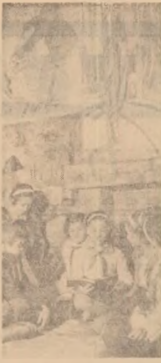
Casa pionierilor din Roman. Alci funcționează cercul „Prietenii ai cărții” numărând aproape 200 de membri. În fotografie, un instantaneu din activitatea cercului.

În acest an vor fi expuse patru teme: „Fotografierea interioarelor”, „Fotografia de arhitectură”, „Portretul” și „Peisajul”. Accentul, însă, îl vom pune pe aplicațiile practice: fotografierea și lucrul în laborator. Fiecare membru al cercului a învățat deja să developeze singur filmul, să copieze imaginile. La sfârșitul anului vom deschide o expoziție cu imagini din viața școlii. Până atunci, însă, vom realiza câteva fotomontaje cu aspecte din orele de clasă, din activitatea cultural-artistică și sportivă. De mare apreciere se bucură colaborarea noastră cu postul radiofonic al școlii noastre surprind în permanență din activitatea zilnică a elevilor — pozitive și negative — care apoi sînt publicate la gazeta postului.