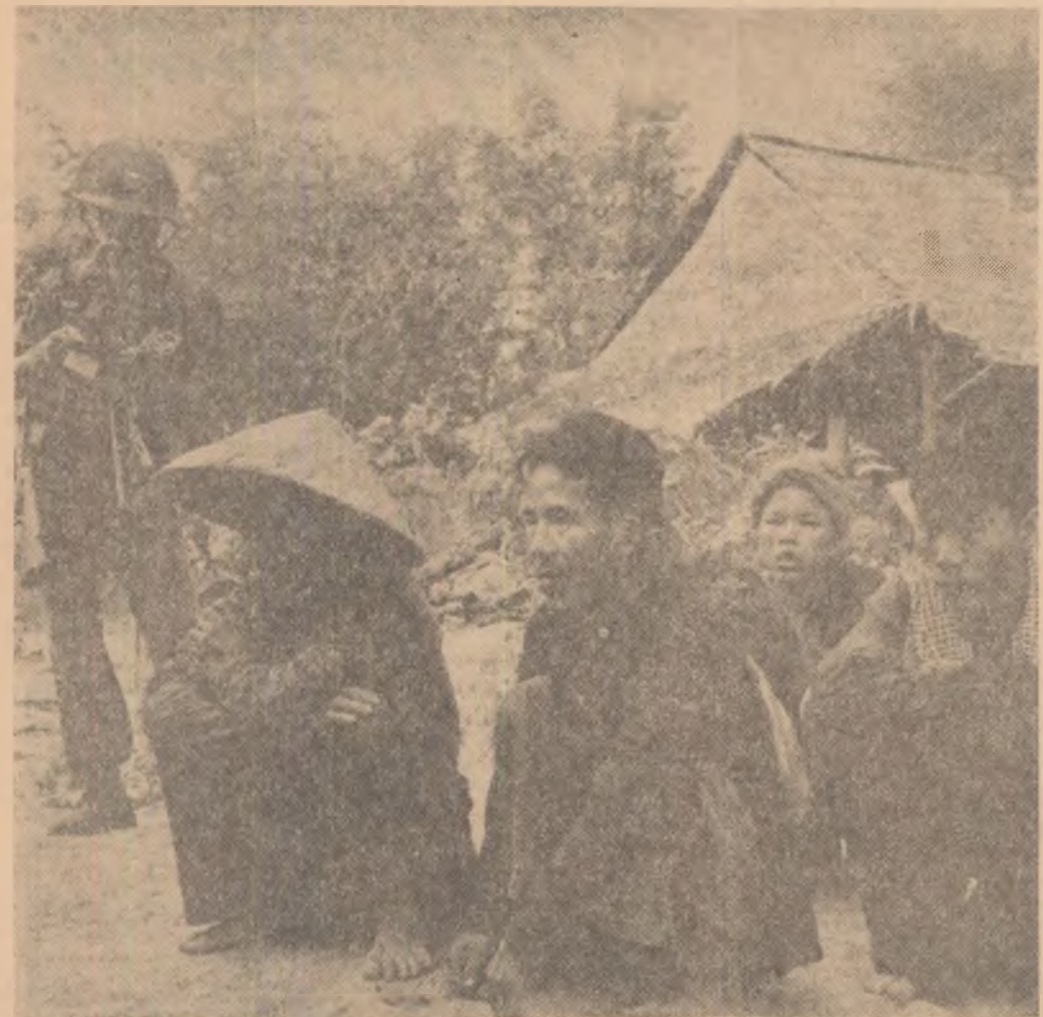
Trupele sud-vietnameze arestează și țin sub pază cetățeni pașnici, bătrâni și copii.