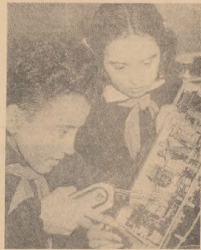
Din activitatea micilor radiotehnicieni albanezi.

În cadrul lucrărilor ce se efectuează în R. P. Albania pentru redarea de noi terenuri agricole, anul acesta a fost dat în exploatare o stație de pompare electrică, destinată înlăturării apelor de suprafață din apropierea orașului Durres, care face parte din obiectivele principale pentru asanarea cîmpiei Durres. Această stație de pompare va asigura ameliorarea a 4 200 hectare teren arabil.