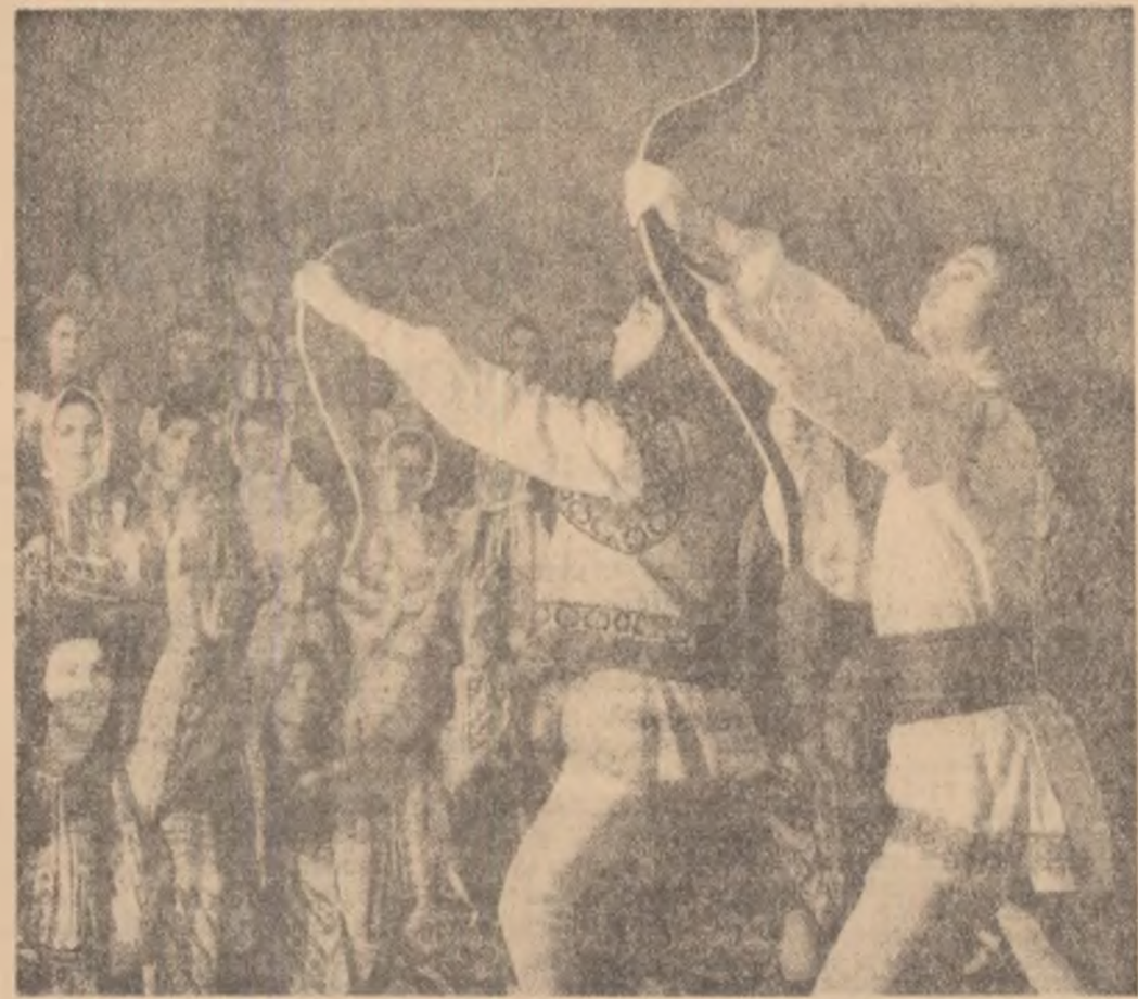
Ansamblul de cintece și dansuri „Ciprian Porumbescu” din Suceava a sârbătorit cu un spectacol deosebit de activitate. Scenă din spectacolul festiv prezentat cu acest prilej.