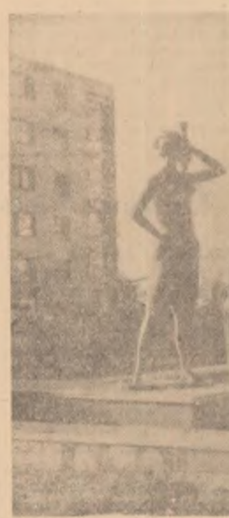
În cartierul Noul Belgrad din capitala R.S.F. Iugoslavia.