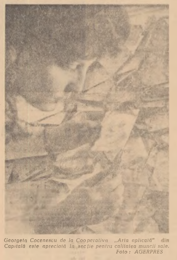
Georgeta Cocenescu de la Cooperativa „Arta aplicată” din Capitală este apreciată în secție pentru calitatea muncii sale.

Tudor (cinescop — ambele seri): Fata orel: 10; 13.30; 17; 20.30; București orel: 9.30; 13; 16.30; 20; Excelsior, orel: 9; 12.30; 16; 19.30. Minna von Barnhelm: Republica, orel: 9.45; 12; 14.15; 16.30; 18.45; 21; Festival, orel: 9.45; 12; 14.15; 16.30; 18.45; 21; Grivița, orel: 10; 12; 14.15; 16.30; 18.45; 21; Ab, acest tineret: Feroviar, orel: 10; 12; 14.15; 16.30; 18.45; 21; Aurora, orel: 10; 12; 14; 16; 18.15; 20.30; Modern, orel: 10; 12; 14; 16.15; 18.30; 20.45; Jurământul soldatului Pooley: Capitol, orel: 10; 12; 14; 16; 18.15; 20.30; Tomis, orel: 10; 12; 15; 17; 19; 21; Melodia, orel: 10; 12; 15; 17; 19; 21; A dispărut o navă: Tineretul, orel: 10; 12; 14; 16; 18.15; 20.30; București orel: 10; 12; 14; 16; 18.15; 20.30; Fiecare orel: 11; 15; 17.15; 19.30; 21.30; Miorita, orel: 9.45; 12; 14; 16; Flămura, orel: 10; 12; 14; 16.15; 18.30; 20.45; Trei plus două: Victoria, orel: 10; 12.15; 14.30; 16.30; 18.30; 20.30; Trei zile după nemurire: Carpați, orel: 10; 12; 15; 17; 19; 21; Valsul nemuritor: Central, orel: 10; 12.30; 14.30; 16.30; 18.30; Cultural, orel: 15; 17; 19; 21; Lira, orel: 15; 17; 19; 21; Mi-am cumpărat un fată: Lumina, orel: 10 la 14 în continuare, 16; 18.15; 20.30; Arta, orel: 16; 18.15; 20.30; Electra: Union, orel: 16; 18.15; 20.30.