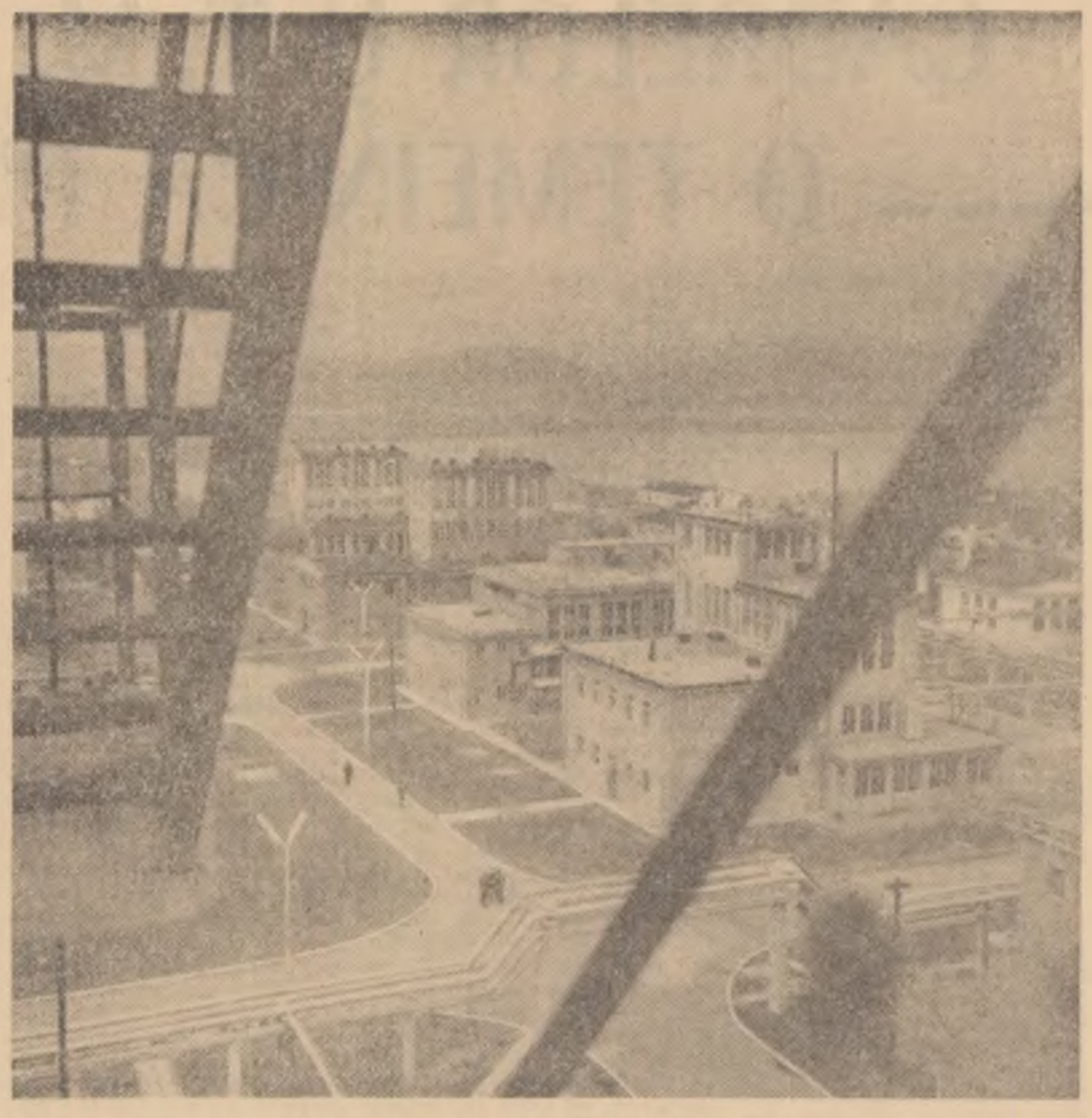
Vedere parțială a Uzinelor chimice Rîșnov.