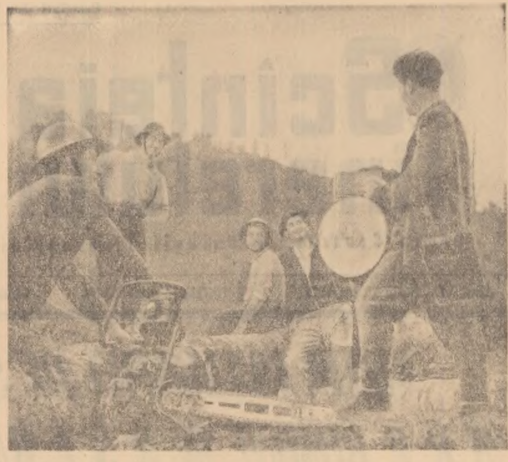
E placut să lucrezi în exploatarea forestieră. Mecanizarea care s-a introdus în procesul de exploatare a lemnului creează muncitorilor condiții bune de muncă și de viață. Fiecare echipă din cadrul parcului Magos, al întreprinderii forestiere Mîncuțiu, regiunea Ploiești, dispune de un aparat de radio portabil.