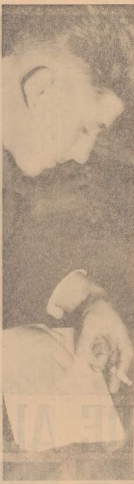
Se spun multe lucruri interesante în adunare, și toate trebuie notate...

Cel de-al doilea grup de probleme analizate în adunările generale U.T.M. la care am participat a fost alături de mobilizarea tinerilor la îndeplinirea sarcinilor de producție, activitatea politico-educă-tivă, cultural-artistică și sportivă a tineretului de la sate.