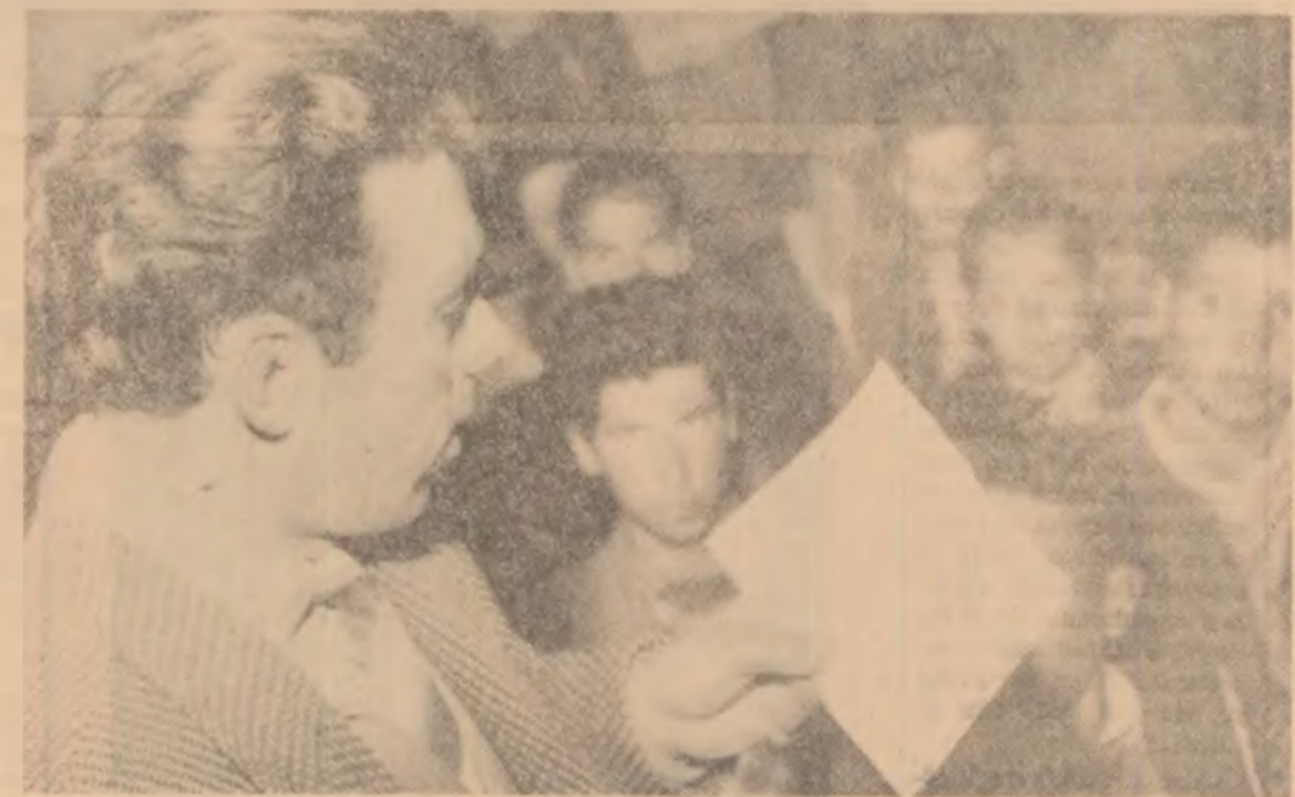
Vorbește inginerul agronom. Cuvîntul lui îi interesează în mod deosebit pe tineri.

4. Să mobilizeze un număr de circa 100 de tineri la etapa I a actualiei ediții a spartachiadei de iarnă.