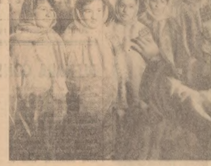
Corul cîminului cultural „I. L. Caragiale” din comuna Costești, raionul Buzău.