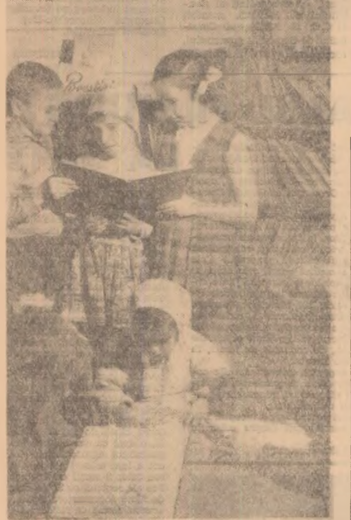
Micii actori, aproape 3000 care îndrăgesc lumea Felilor Frumoși și a izvoarelor fermeceale, se înfășoară la dimineața sau seara de basm și într-un nou local (st. Avram Iancu nr. 8 din raionul 23 August) unde și-a început activitatea Filiala pentru copii și tineret a Bibliotecii centrale de stat. Iată-i pe câțiva dintre acești pasionați cititori „în plină activitate”.