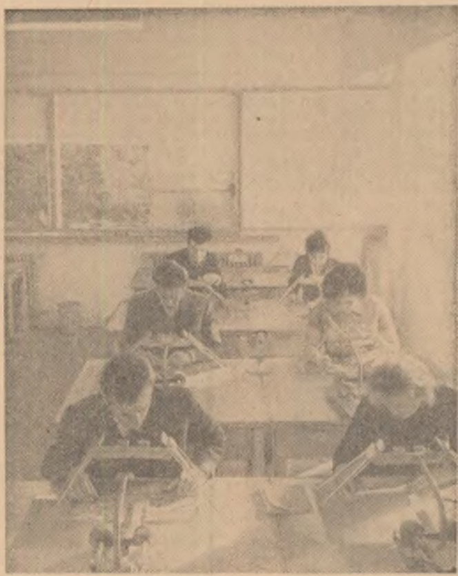
Oră de laborator la Institutul de Construcții din Capitală.