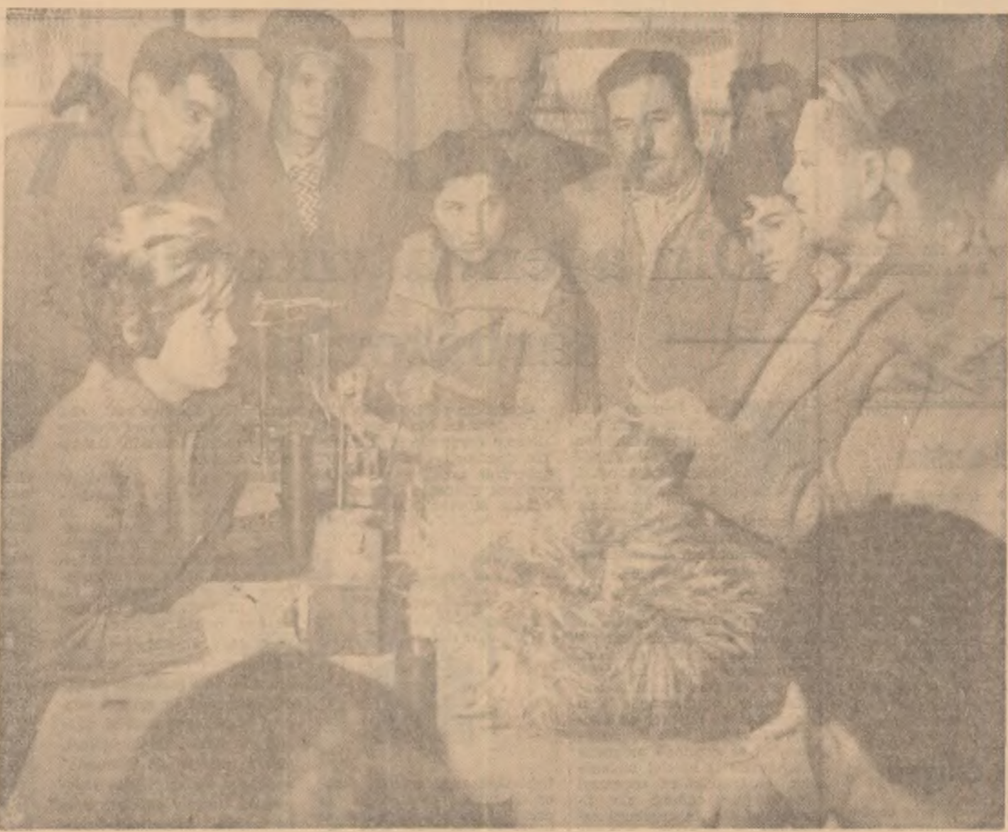
După predarea lecțiilor, cursanții de la G.A.C. Codlea continuă aprofundarea studiului la casa-laborator care este dotată cu un bogat material didactic.