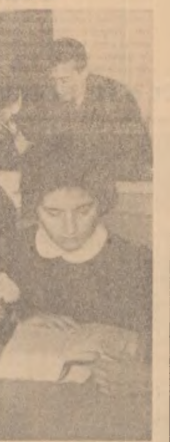
Preferințele elevilor pentru lectură sînt foarte variate. Biblioteca Școlii medii „Unirea” din Focșani le satisface pe deplin.