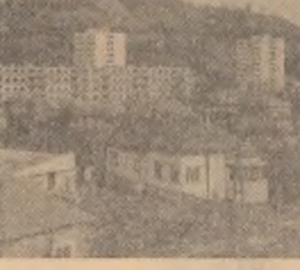
Construcții noi în cartierul „N. Grigorescu” din Cluj.

unele proiecte au fost corectate, la propunerea petroliștilor. Da, pentru primii muncitori socialiști la Brazi, de ridicare a calificării a fost șantierul însuși. În felul acesta poți realiza un fapt specific rafinării Brazi: nivelul de cunoștințe cu totul impresionant al muncitorilor.