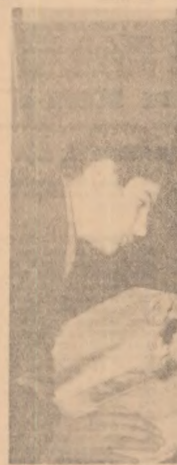
Preferințele elevilor pentru lectură sînt foarte variate. Biblioteca Școlii medii „Unirea” din Focșani le satisface pe deplin.