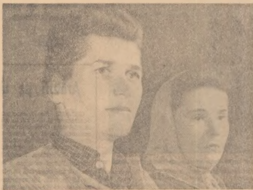
Expunerea interesantă făcută de lector la cercul agrozootehnic anul I, de la G.A.C. Stupini, concentrează atenția cursanților.

Comitetul U.T.M. din gospodăria colectivă Codlea a luat o inițiativă bună. După orele de curs la învățămîntul agrozootehnic, tinerii se adună, în grupuri, la cercurile de citit. Aici, timp de o oră, cei care au un nivel de cunoștințe mai ridicat îi ajută pe cei cu mai puțină experiență să conspiceze materialul bibliografic, să studieze capitolele cele mai importante din manuale. Membrii comitetului U.T.M. și ai birourilor organizațiilor U.T.M. pe brigăzi au fost repartizați să organizeze și să participe la buna desfășurare a studiului la cercurile de citit.