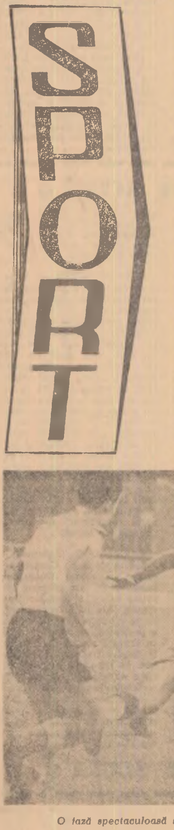
O fază spectaculoasă surprinsă în meciul Știința Cluj — Rapid București.

În aproape toate comunele sînt multe parate dar pînă acum pîrțile de șah nu au fost amenajate. Toate acestea există, sînt și