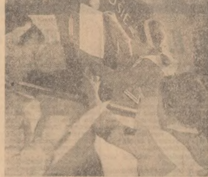
Un nou număr al gazetei de perete la Școala de 8 ani nr. 151 din Capitală.

Și în ce privește aprovizionarea cu lemne pentru iarnă sînt rămîneri în urmă neacceptabile (la Cornești, Petela, Perș etc.). Deși la toate căminele culturale există radiouri, la multe nu se pot face audii încă din vară din cauza lipsei de baterii (!) (Beica de Jos, Dădăd etc.).