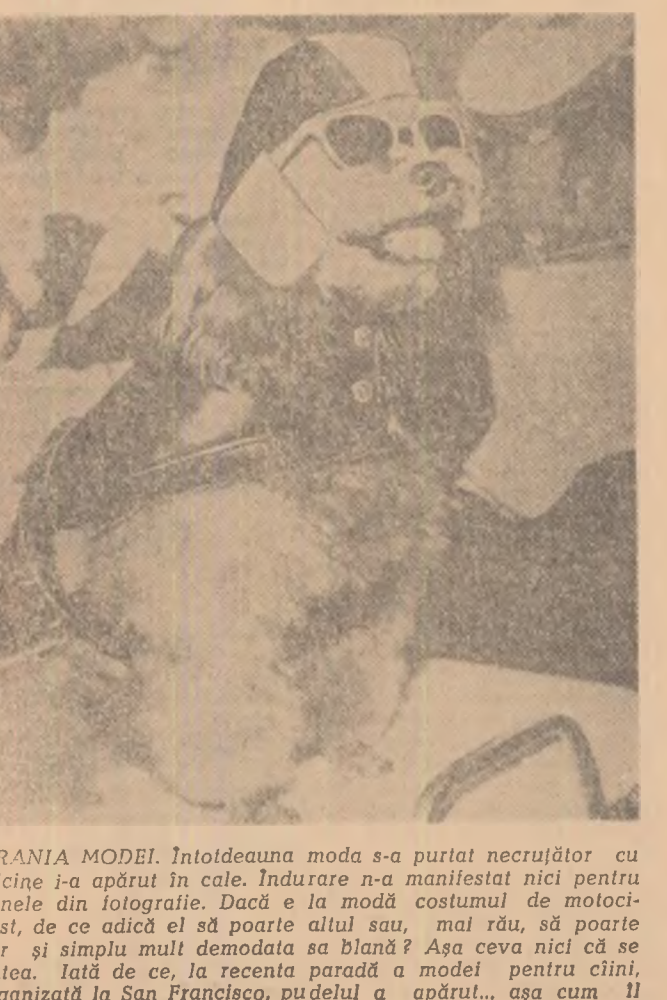
FRANZIA MODEL. Intotdeauna moda s-a purtat necrutător cu ordine în a apărut în cale. Indurare n-a manifestat nici pentru cîmlele din fotografie. Dacă e la modă costumul de motocicletă, de ce adică el să poarte altul sau, mai rău, să poarte pur și simplu mult demodată sa blană? Așa ceva nici că se putea. Iată de ce, la recenta paradă a modei pentru cîini, organizată la San Francisco, puțelul a apărut... așa cum îl vedeți.