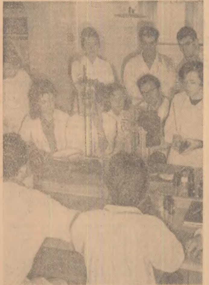
Pregătind examenele, studenții anului II în stomatologie de la I.M.F. Timișoara petrec mai multe ore în laborator sub îndrumarea cadrelor didactice.