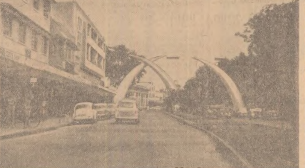
Vedere din portul kenyan Mombasa