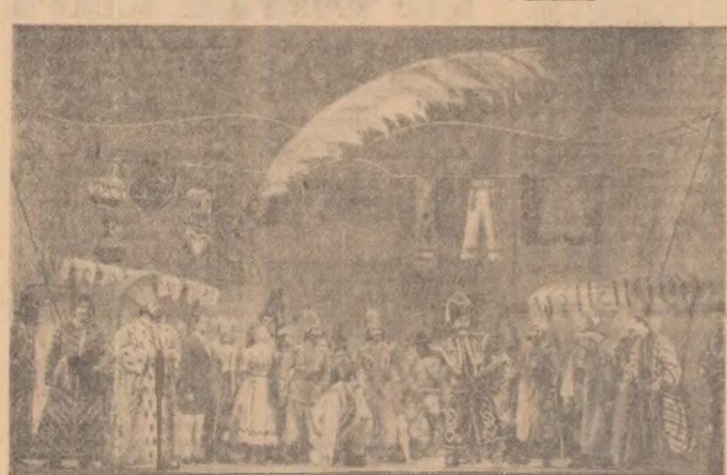
Scenă din opera „Anon Pann” sau „Povestea vorbeii” de Alfred Mendelssohn — noua premieră a Teatrului de stat de operă.

CLUJ (de la corespondentul nostru) — Recent s-au dat în exploatare instalațiile moderne de centralizare și telecomandă la stația C.F.R. Dej-călători. Prin această realizare procesul tehnologic al asigurării parcursului s-a simplificat considerabil și s-a îmbunătățit siguranța circulației. Timpul de manevrare a comenzilor de intrare și ieșire a unui tren în stație s-a redus de la 10 minute la aproximativ 7 secunde.