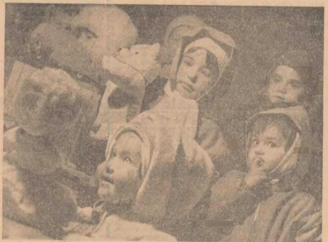
Cei mai tineri cumpărători sînt într-o grea dilemă atunci cînd se alină la magazinul cu jucării „Așchiuț”

trificat și satul Domănești din raionul Carei. La această lucrare o contribuție de seamă au adus-o tinerii și vîrstnicii din comună, care au săpat gropile și au transportat stîlpii, economisindu-se astfel peste 20 000 lei. Concomitent cu lucrările de electificare se lucrează intens și la extinderea liniilor existente. În multe sate din regiune, în Fărcașa, Valea Vîjnului și Roșiori, de exemplu, din raionul Șomcuta Mare, rețeaua electrică s-a extins cu încă 8 kilometri. Lucrări asemănătoare au mai fost executate și în satele Sălsig și Ulmeni, raionul Cehu Silvaniei.