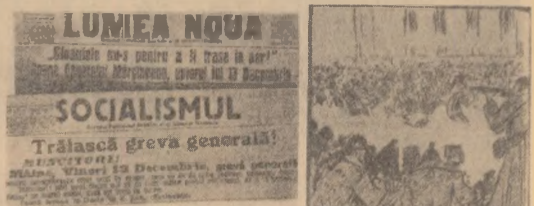
Extrase din presa vremii, în care au apărut articole demascoalare, chemări la greva generală în sprînjinal revendicărilor economice și politice ale muncitorimii.

Și împlinește astăzi 45 de ani din ziua în care a avut loc puternica manifestație a muncitorilor din București care cereau pace, pîine și libertate.