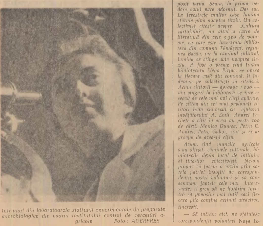
Intr-unul din laboratoarele stațiunii experimentale de preparate microbiologice din cadrul Institutului central de cercetări agricole.

La vârsta de 18 ani, tineretea are un chip entuziast și romantic, i se deschid înainte vaste orizonturi, o așteptare răspunderii majore.