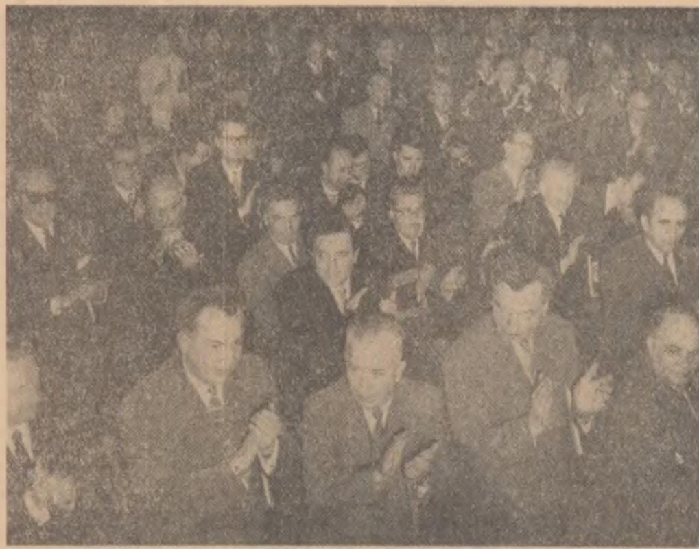
Aspect din timpul lucrărilor Conferinței pe țară a Uniunii Compozitorilor și Muzicologilor.

Comitetul Central al Partidului Muncitoresc Român, Consiliul de Stat, Consiliul de Miniștri al R. P. Romînie