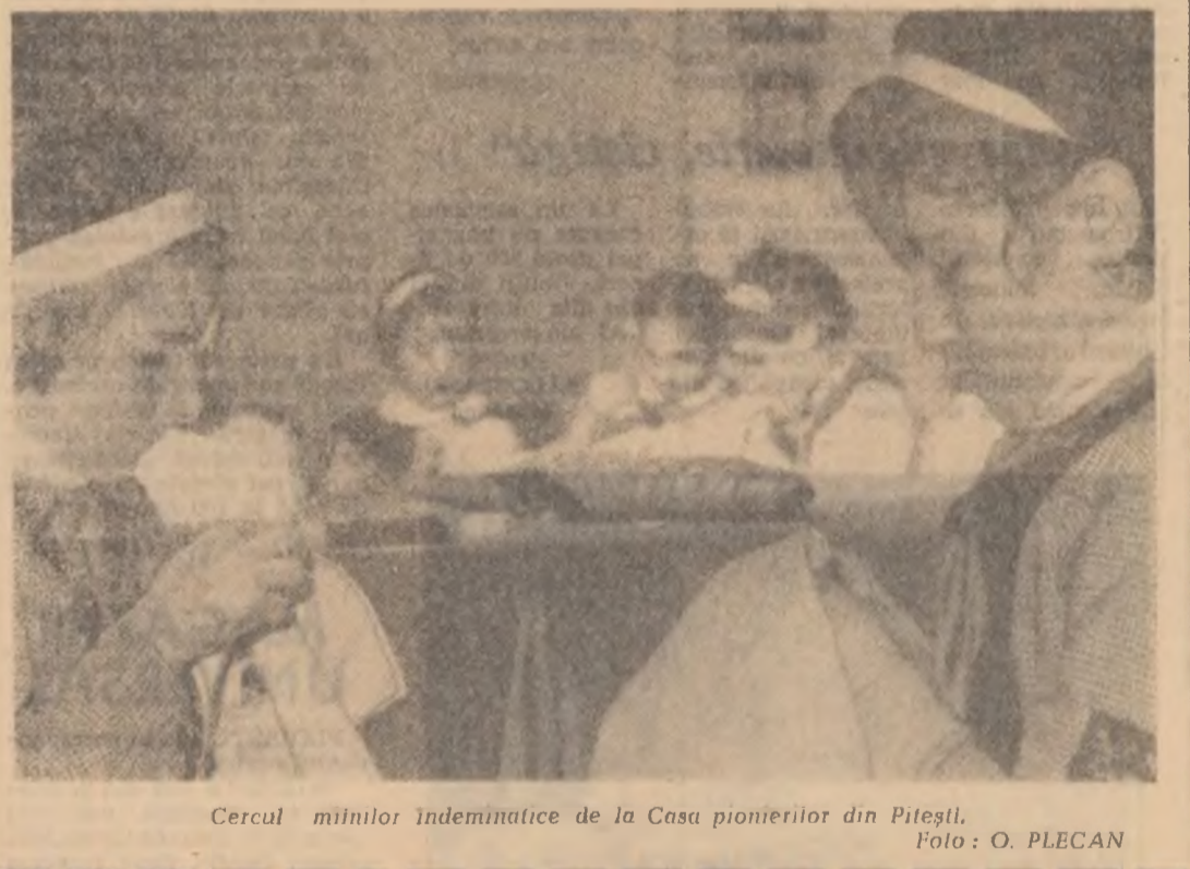
Cercul miilor îndemnatice de la Casa pionierilor din Pitești.

La startul întrecerilor pentru obținerea insignei de polisportiv s-au aliniat și elevii a Școlii de 8 ani din comuna Deleni, raionul Vaslui.