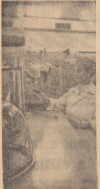
Institutul de fizică atomică. Aspect al instalațiilor de vidare și de degazare pentru contori de radiații și tuburi electronice de putere.

...Cronicalarul ziarului „L'Aurore” subliniază la rîndul său: „Hotărît lucru, români posedă secretul de a pune în dificultate „15-le” franceze. Acesta durează din 1957, anul ultimei victorii a tricolorilor noștri. Nici la Toulouse, pe un timp glacial, rugbiștii francezi n-au putut să descopere acest secret. Români, alinați în centrul terenului, la sfârșitul jocului, au cules aplauzele multimi.