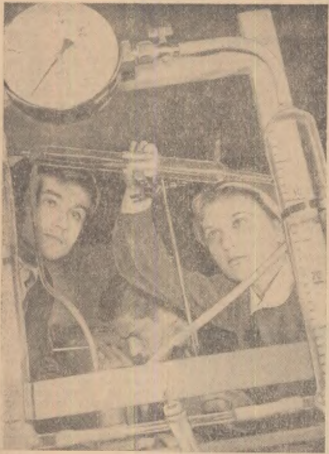
In laboratorul de fizică al Școlii medii nr. 1 din Oradea elevii efectuează o interesantă experiență.