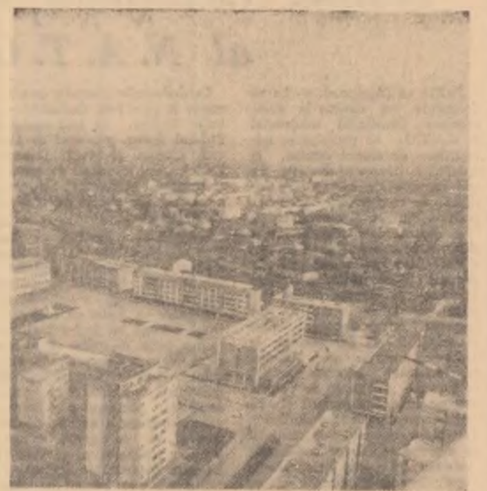
vedere din Baia Mare