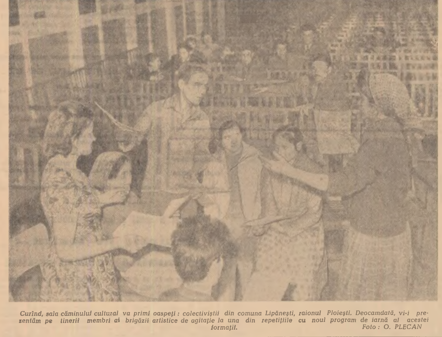
Curînd, sala cîminului cultural va primi oaspeți: colectivii din comuna Lipănești, raionul Ploiești. Deocamdată, vii prezentăm pe tinerii membri ai brigăzii artistice de agitație la una din repetițiile cu noul program de iarnă al acestei formații.