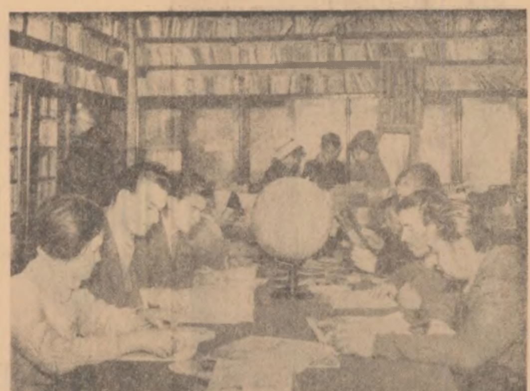
Deocamdată se consultă revistele de specialitate. Dru-mul cititorilor va urca apoi sigur către cărțile tehnice. Continua ridicare a calității profesionale cere un asemenea împlinire. În fotografia aspect din bibliotecă a clubului muncitoresc al Uzinei „Industria Sîrmei” din Cîmpia Turzii

Am intrat în tradiția școlii noastre ca în fiecare an să sărbătorim împreună un revelion plin de veselie și voie bună. Anul acesta pregătirile pentru revelion le-am început încă cu mai mult timp în urmă. Comisia de organizare, formată din profesori, membri ai comitetului U.T.M., elevi, se îngrijește de tot ceea ce este necesar pentru a petrece un revelion plăcut.