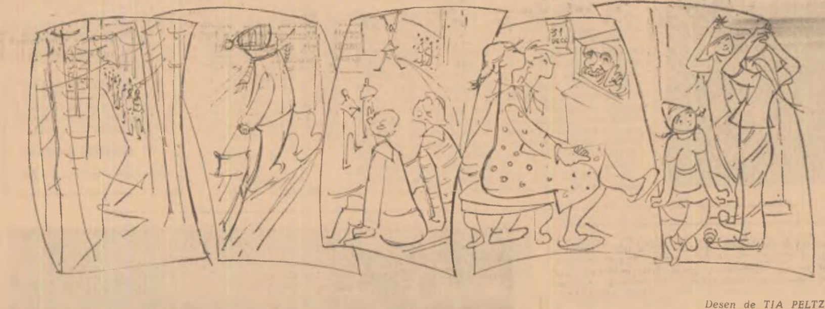
Desen de TIA PELTZ