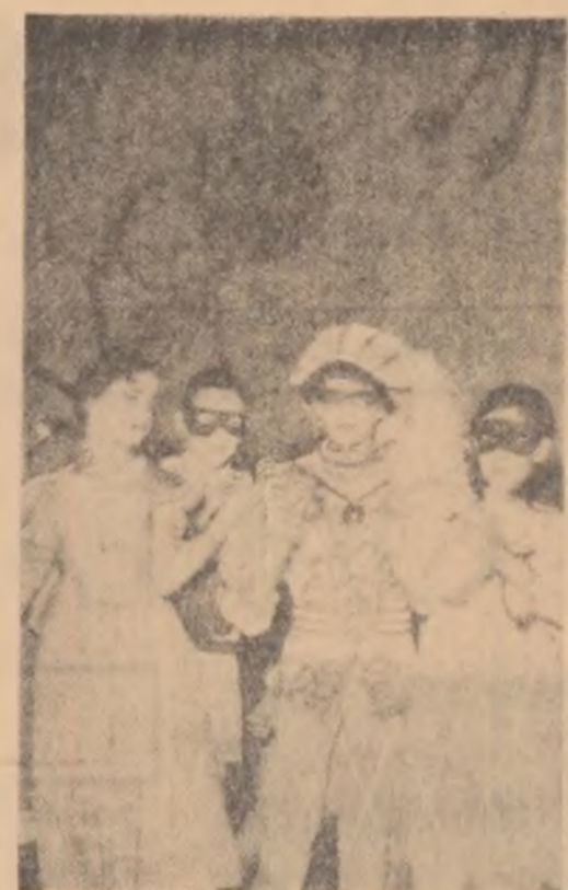
Feji Frumosi și Ienele Cosinzeana au sosit de pe acum la Carnavalul pionierilor. Nu, e încă devreme. Copiii n-au intrat încă în vacanță. Imaginea pe care o vedeți este de anul trecut. Dar, vă asigurăm că veți întâlni și în anul acesta, la carnavalurile care se pregătesc, pe eroii dragi din povestirile care vă încântă copilăria.