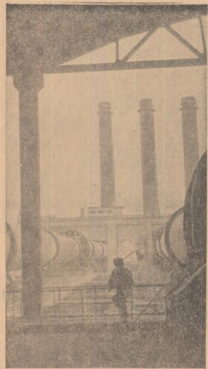
Aspectul noilor linii tehnologice de mare capacitate de la fabrica de ciment „Victoria socialismului” din Turda.