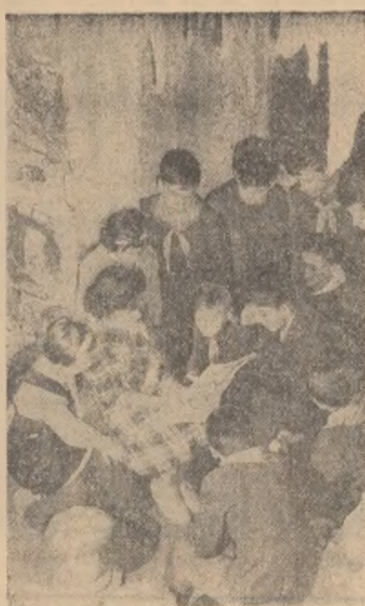
Indiferent dacă este vorba de Albă ca Zăpada, ori de peripețiile istețului Păcălă, copiii se adună cu plăcere în camera de povești a Casei pionierilor din Oradea.

CLUJ (de la corespondentul nostru) Pînă în prezent 50 de întreprinderi din regiunea Cluj au raportat îndeplinirea planului anual înainte de termen. Recent a raportat acest succes și colectivul de muncă al Uzinei „Industria Sîrmei” din Cimpia Turzii. Cele 85 de măsuri tehnico-organizatorice aplicate aici au dus la creșterea productivității muncii, la realizarea unor însemnate economii. Pe 11 luni productivitatea muncii a fost realizată în proporție de 104,7 la sută, iar economisile realizate la prețul de cost se ridică la 3.242.000 lei. Printre măsurile tehnico-organizatorice cele mai eficiente care au dus la creșterea productivității muncii, la reducerea cheltuielilor de producție și la îmbunătățirea calității produselor se numără: conecționarea unor dispozitive de împins la bancurile de frezare a barelor de metal, mărirea capacității de producție a cuploarelor de patentare și a sectorului de reconecționare a oțelului pentru rulmenți.