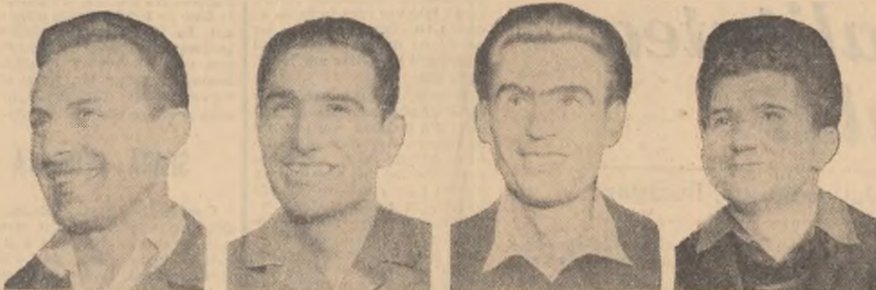
Tinerii din secția electrozi a Întreprinderii „Carbochim” din Cluj au adus un aport însemnat la realizarea sarcinilor de plan pe anul 1963 și la obținerea drapelului de