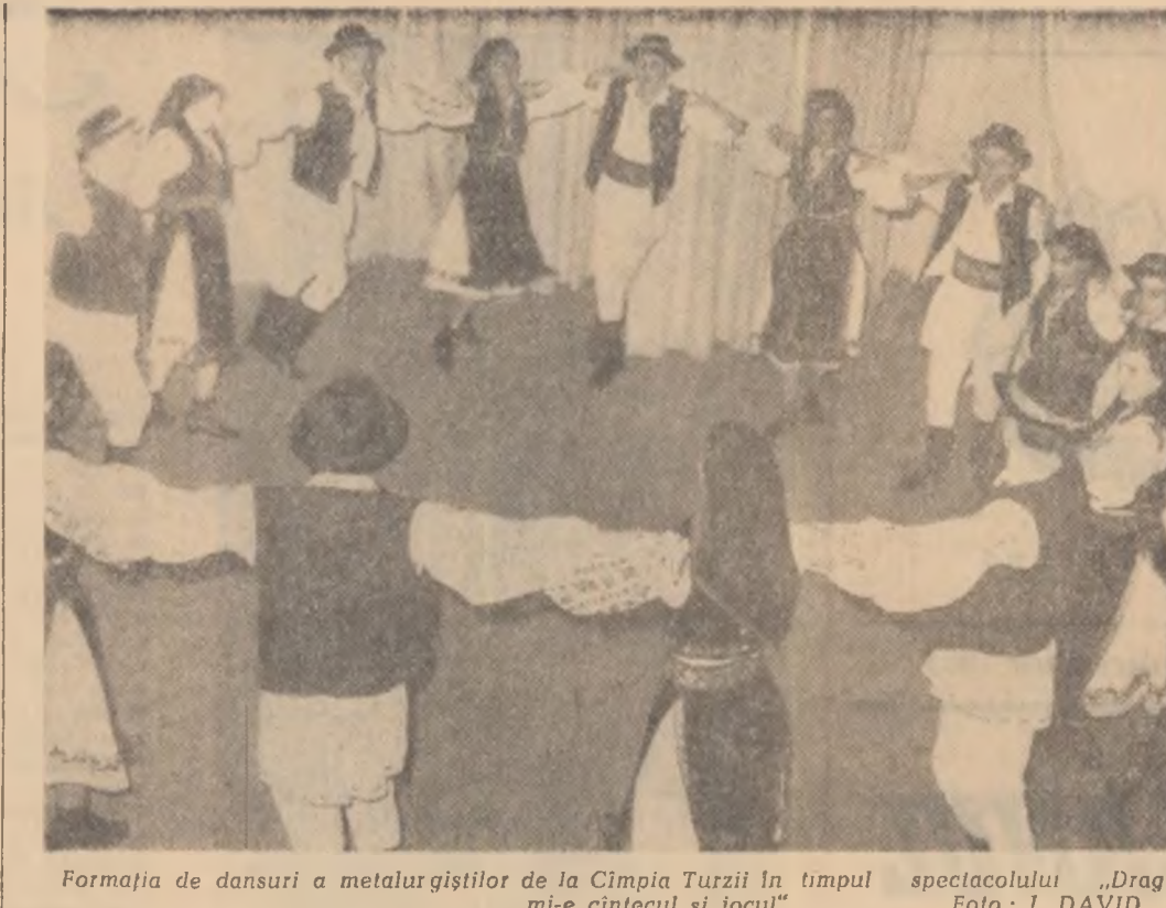
Formația de dansuri a metalurgiștilor de la Cimpia Turzii în timpul spectacolului „Drag mi-e cîntecul și jocul”.