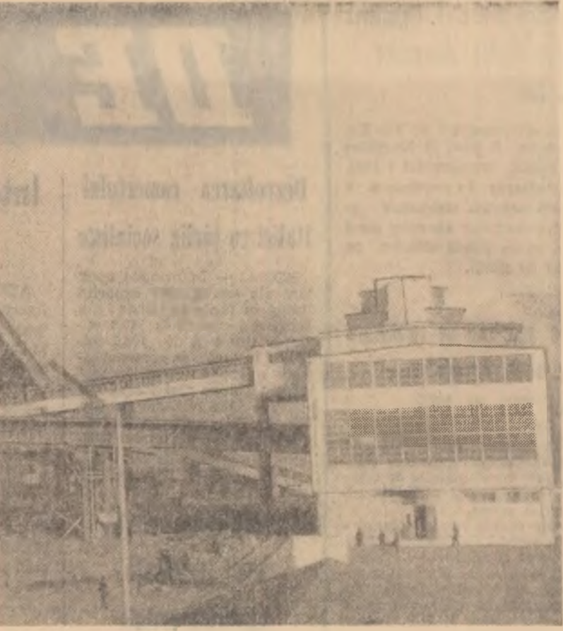
La Corcești, în bazinul carbonifer al Văii Jiului, s-a construit o preparație modernă de cărbune. Noua uzină va spăla trei sorturi de cărbune de la exploatarea Vulcan și Aninoasa. Ea este prevăzută cu 3 linii de spălare cu o capacitate totală de 3 000 000 tone anual. Prima din cele 3 linii s-a terminat de montat cu 28 de zile înainte de termen și a intrat în probe tehnologice. La liniile 2 și 3 se lucrează la montarea utilajelor. În fotografie: vedere generală a noii preparații cu galeriile benzilor transportoare care totalizează peste 300 m.