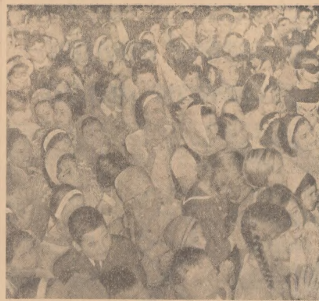
Imbarcați pe „Vaporul veseliei” (ale căru „croaziere” le-am anunțat în numărul din 12 decembrie al ziarului nostru) 7.000 de pionieri vor participa în zilele vacanței la un minunat carnaval. În fotografia noastră, la Palatul pionierilor, cîțiva dintre participanții de ieri.

La liniile de îngrășăminte — este la fel de simplu; călătorind prin morile de măcinat, apoi prin lungi estacade —