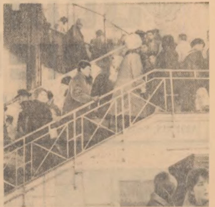
Aici nu prea discută nimeni; sînt grăbiţi. Liiturile magazinelor sînt pline, scările au devenit neîncăpătoare. „Oi, tocmai astăzi şi-au găsit să vindă toţi, cînd trebuie să fac eu cumpărături!”.