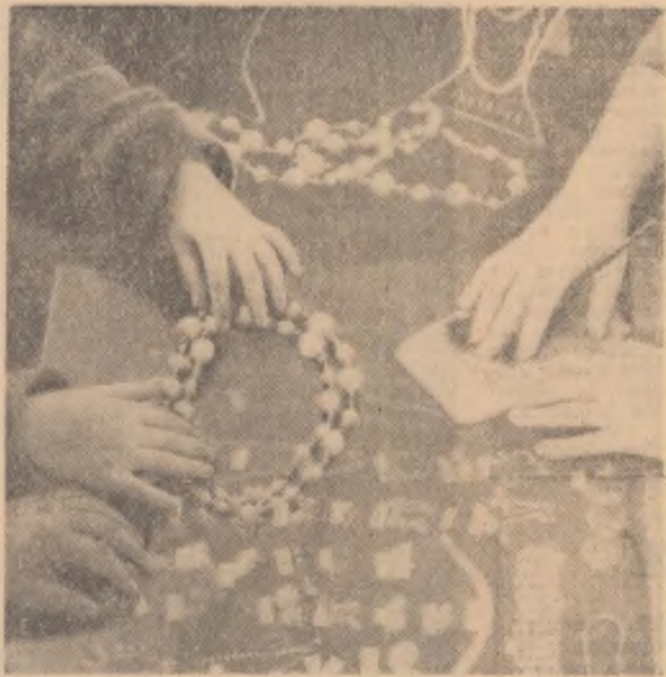
Ei, puţin grăbit, liindcă alegerea — cînd ai în lafă atitea podoabe — e anevoioasă: Să le cumpărăm, dragă, pe amindouă şi te hotărâşti acasă pe care să o porţi.