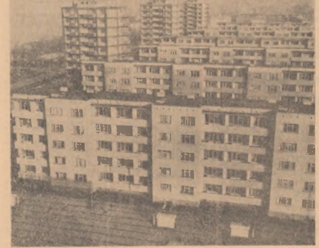
R. P. Polonă: Noi clădiri în orașul Wrocław. În fotografie: Pe strada Grabiszynska.