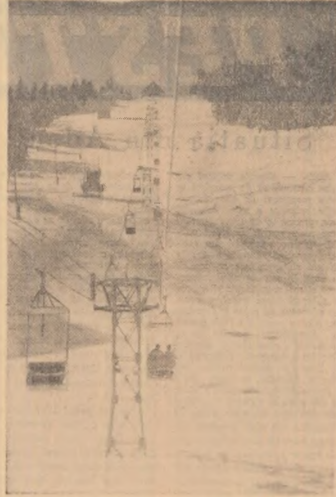
Cu telefericul spre cabana Cristianul Mare

În campionatul de șah al S.U.A., după 6 runde, conduce Bobby Fischer cu 5 puncte și o partidă întreruptă, urmat de Larry Evans