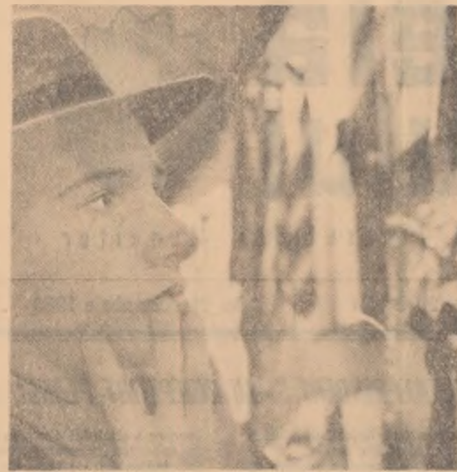
Reporterul: E prima cravată? Tînărul: Nu, dar nu ştiu ce să aleg să se asorteze cu culoarea părului, a ochilor, a cămăşii, a hainei, a tularului şi a pălăriei...