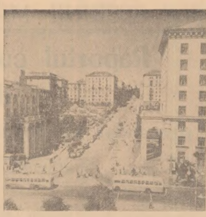
Pe strada Sverdlovsk din Kiev.

Totodată, el a declarat că Reprezentanții permanenți ai Ciprului la O.N.U. s-au adresat prezidentului Consiliului de Securitate o scrisoare în care cere convocarea Consiliului de Securitate.