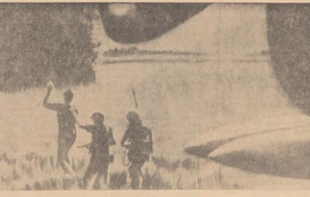
Nu departe de Saigon... Debarcați dintr-un elicopter, condus de militari americani, doi soldați guvernamentali amenință cu puștile pe un fărîm „suspect” aliat într-o orezătură.

Consilierii americani, încheie ziarul, le este din ce în ce mai greu să țină sub control cererile guvernamentale. Cunoșcătorii competenți ai situației nu se mai sfîșec să vorbească despre un „proces de alunecare”.