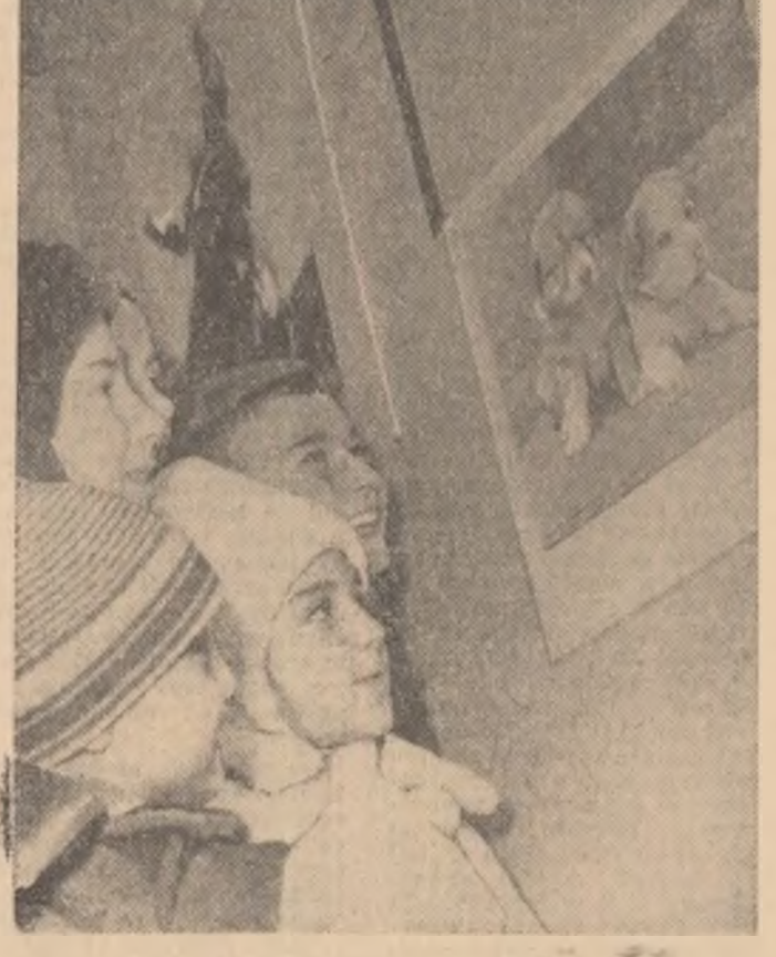
„Sintem în vacanță, dar „lecția” aceasta de... zoologie este foarte interesantă, așa că o urmărim cu toată atenția!”

puii de găină ori alți numeroși, modești și simpatici prieteni ai omului. Copilul deschide ochii mari, sesizînd deodată frumusețea naturii în cristalizările ei zoomorfe, de o nesfîrșită variație. Dar, alături de copil stă omul matur. Acesta apreciază la lucrările pe teme animalele ale lui Ion Miclea o intuiție artistică sigură, pe care calitatea tehnică a fotografiilor o servește excelent. Filar lăsinîd între paranteze perseverența și ascuțitul simț de observație ce i se cer artistului în căutare de altitudini degajate la niște „eroi” imposibil de avizat cu celebrul „zîmbiți, vă rog”, trebuie să i se recunoască lui Miclea delicatetea,