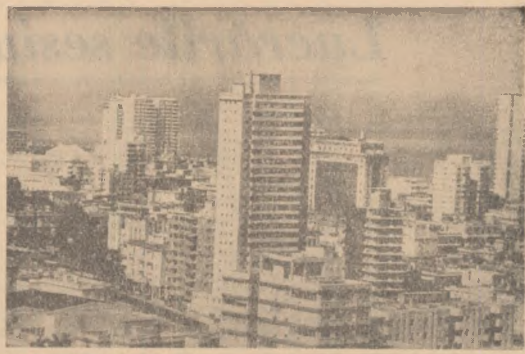
O imagine a Havanei, frumoasa capitală a Cubei