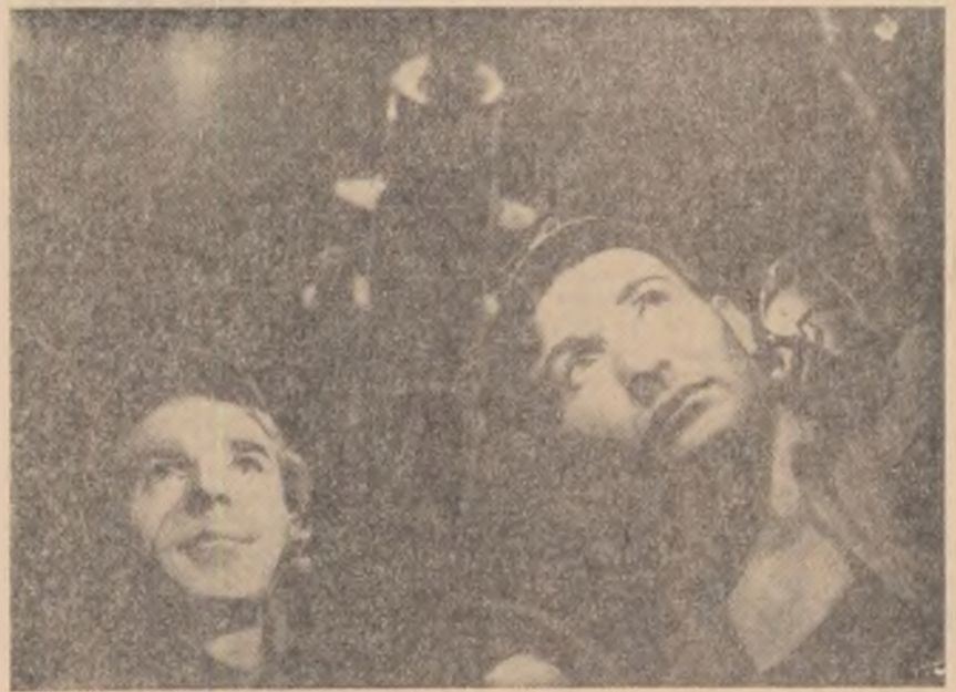
...la îndeplinirea în timp și în bune condiții a sarcinilor de plan