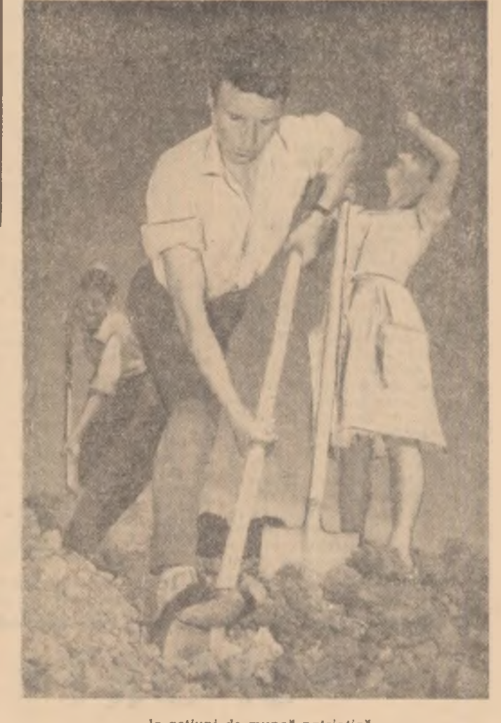
...la acțiuni de muncă patriotică.