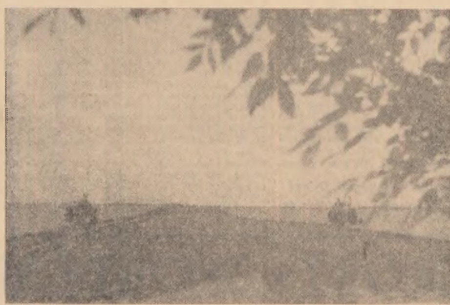
...la obținerea unor recolte cit mai bogate