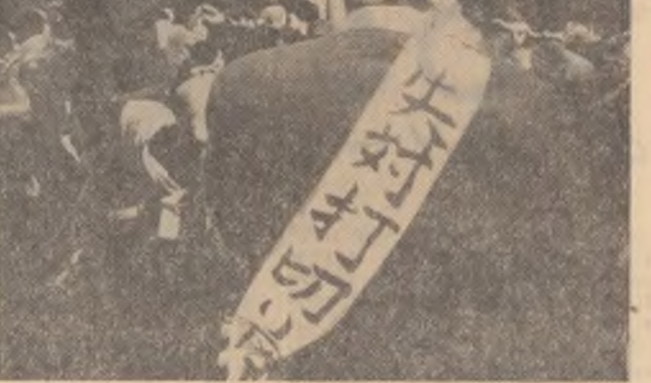
TOKIO: Aspect de la o recenzie demonstrativă a muncitorilor zilieri din Japonia. Ei au cerut asigurarea locurilor de muncă și salarii minime garantate.

În numele președintelui Liu Șao-ji și în numele său personal, premierul Ciu En-lai l-a invitat pe președintele Ben Bella să viziteze R.P. Chineză în a dată care va fi fixată ulterior. Președintele Ben Bella a acceptat invitația.