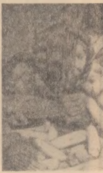
„Muncă făcîndu cu pricepere, roade bogate. Imaginea e simbolică pentru bucuria pe care și-o dau întotdeauna roadele muncii tale.”

Atrași de zăpadă abundentă de pe platoul Bucegilor, schiorii urcă spre cabana Vîrlui cu Dor.