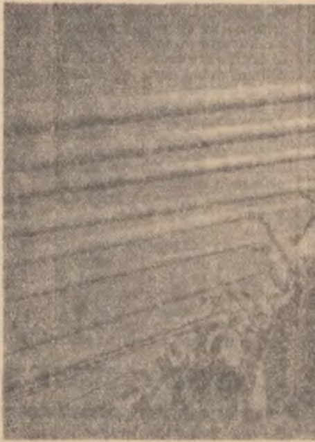
„Și cîntecul și dansul și dragostea de viață ne-au fost tovarăși zilnici de-a lungul întregului an.”

depute în rîstimpul dintre cele două date decit imaginea alăturată — în acele locuri, primăvara și toamna. Cîteva cifre spicuite din ziarele anului sînt concludente pentru marea bătaie desfășurată pe frontul pînii: în 1963 agricultura noastră a dispus de un parc de 66.000 de tractoare, 63.000 de semănători, 31.000 de combine, 18.000 de cadre cu pregătire superioară au lucrat în 1963 în agricultură. În perioada 1960—1963 volumul de investiții pentru agricultură a fost de aproape 2 ori mai mare decit în anii anteriori. Munca a brodat într-adevăr pămîntul cu aur: citim în ziare că se sute de mii de hectare de porumb s-a obținut o recoltă bună. Așa cum se arată în Darea de seamă asupra înfăptuirii planului de stat pe anul 1963 și cu privire la planul de stat pe anul 1964, prezentată de tovarășul Ion Gheorghe Maurer la