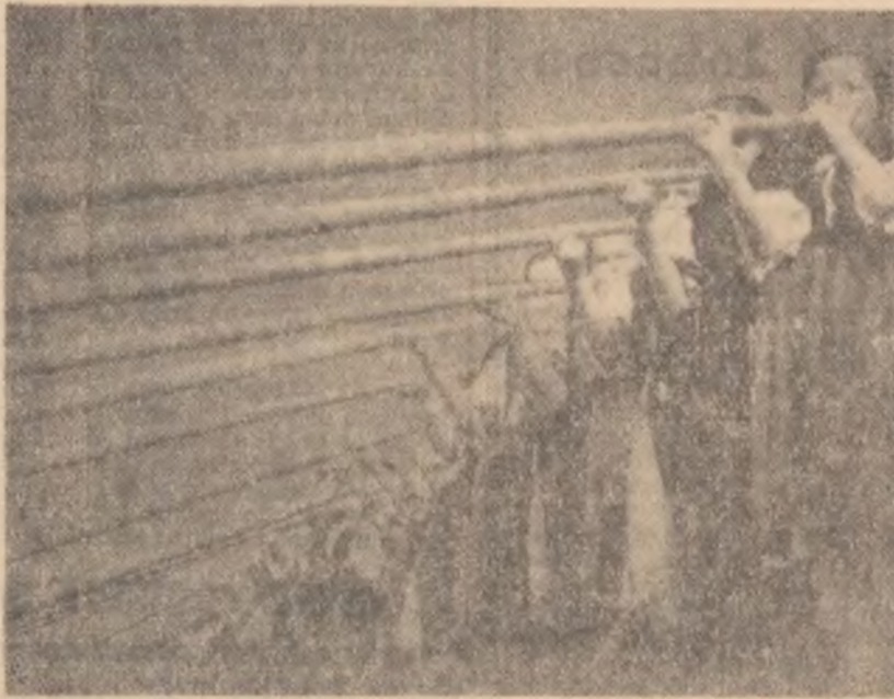
„Și cîntecul și dansul și dragostea de viață ne-au fost tovarăși zilnici de-a lungul întregului an.”

„Stau scrise în paginile ziarelor momentele a urcușului nostru cotidian și-s pline aceste pagini de mărturia izbînzii. 1963 a fost un an de roade.