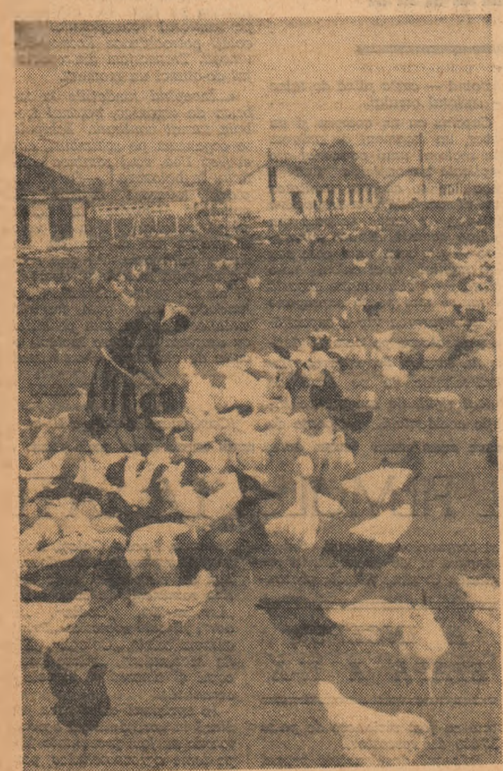
Ferma de păsări a gospodăriei agricole colective din comuna Olopeni, regiunea București.

Un afiș sugestiv intitulat „Cartea este prietenul și sfătuitorul tău”, iar alături panoul „Cîții aceste cărți”, cu copertele unor broșuri de știință popularizată, graficul creșterii numărului de cititori și cărți citite, ori graficul cercurilor de citit cu numele responsabililor și zilele ședin-țelor de lucru, reflectă o bog-ăță agițată vizuală, atractivă și mobilizatoare.