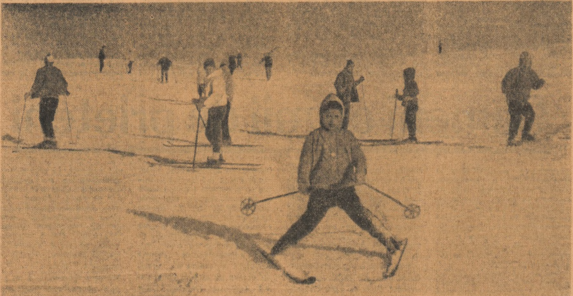
Ultimele zile de vacanță pe năunata pîrtie de schi de lângă cabana „Vîrful cu Dor” din Bucegi.

ALVARO CUNHAL Secretar general al Partidului Comunist Portughez