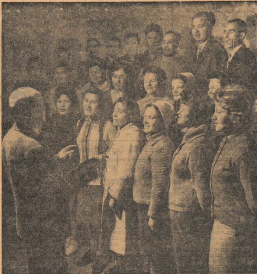
Și la cîmînul cultural din Vașcău, regiunea Crișana, ca și la alte cîmine culturale, oamenii vin cu plăcere să cînte sau să asculte muzică, să citească sau să asculte poezii, să vadă programele brigăzii artistice, sau să vizioneze filme. În imaginea de față: corul cîmînului cultural din Vașcău la repetiții.