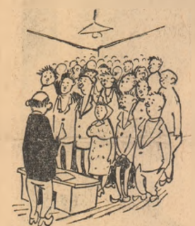
LECTORUL: Este foarte important să lii cit se poate de... deșajați.

Cealaltă nu vin la școală, ci se înghesuie într-o încăperere de la sedul gospodăriei colective cite 38—40 de inși pe 3—4