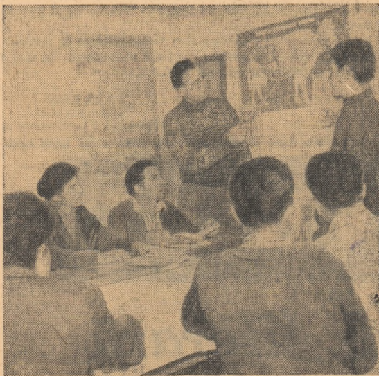
Explicațiile clare date de lector sînt ascultate cu mult interes de tinerii cursanți al cercului de creștere a animalelor de la G.A.S. Bordanesti regiunea București.

Publicăm mai jos, cîteva aspecte de modul în care se desfășoară învățămîntul agrozootehnic în unele unități agricole socialiste din țară.