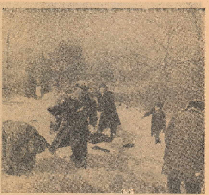
O bătălie aprigă, lăra „scheme tactice”, dar cu risipă de „munjiți” și voie bună.