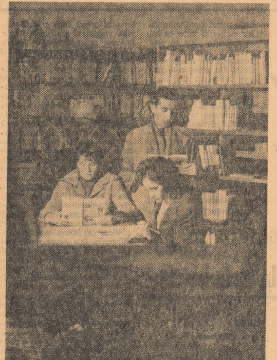
Circa 9.000 de volume de cele mai diferite genuri stau la dispoziția numeroșilor cititori ai bibliotecii căminului cultural din comuna Vașcău, regiunea Crișana.