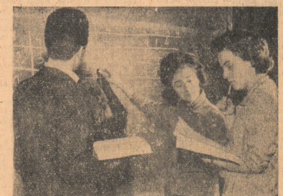
Pentru examenul de matematică se repetă cu creta în mîin. În fotograție: studenți ai Institutului de matematică din București

Iubitorii de teatru din Timișoara au participat duminică la clubul C.F.R. „16 Februarie 1933” din oraș la o interesantă acțiune educativ-artistică. Aici, cei 600 de spectatori prezenți au auzit prima expunere: „Incepăturile teatrului romînesc”, din cadrul ciclului de conferințe pe tema „Din tradițiile realiste ale teatrului romînesc”. Expunerea a fost ținută de academicianul Victor Eftimiuc. În continuare, vor avea loc noi întâlniri cu personalități artistice din Capitală și Timișoara, care vor vorbi despre „Dramaturgia romîni după 23 August”, „Spiritul de partid în arta teatrală”, „Regia, scenografia și arta actorilor contemporani”.