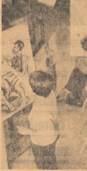
Perseverență și măiestrie — iată ce caracterizează pe studenții Facultății de arte plastice a Institutului pedagogic din Timișoara. În fotografie: studenții din anul III la ora de desen artistic.

este cunoscut, se ridică următoarea problemă: în cazul cînd „memoria” poate fi transmisă descendenților, care dintre cele două jumătăți ale sale are această proprietate? Primul gînd al cercetătorilor a fost să atribuie această însușire capului — care rămîne în exclusivitate posesorul schiței de sistem nervos. Numai cu dictionul „unde nu este cap, vad de picioare” — nu s-a adevărat cu acest prilej. Imediat, s-a experimentat presupunerea. După ce cîteva planarii au fost „dresate”, s-a trecut la înmulțirea lor pe fel de bine ca și cele reconstituite din capete! Experiența a fost verificată de nenunțate ori: concluzia se impunea însă — mereu — aceeași. Care era însă mecanismul prin care cozile — lipsite de un aparat nervos propriu — păstrau, întipărită, experiența trecută? De pe urma unei alte serii de experiențe părea să se desprindă o concluzie aparent ciudată: „memoria” nu ar fi localizată numai în sistemul nervos al planariei, ci și în unele celule ale sale, probabil,