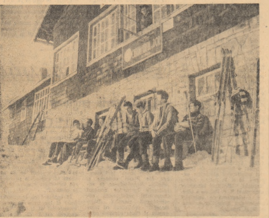
După antrenament, un popas la soare. În fața cabanelor, este binevenit.

Duminică 26 ianuarie 1964 8,50: Gimnastica de învățare; 9,00: Emsiune pentru copii și tineretului școlar; 10,30: Rețeta gospodinei; 11,00: Emsiunea pentru copii; 11,00: Jurnalul televiziunii; 19,10: Program muzical distractiv înregistrat pe peliculă; 19,50: Actualitatea cinematografică; 20,30: Cîntec și dansuri în interpretarea Ansamblului folcloric „Brîulețul” din Constanța; 21,20: Lacrimi nevăzute de nimeni; 21,40: Muzică ușoară cu... Roxana Matei, Trio Caban și o formație instrumentală condusă de Paul Chențer; în încheiere: Buletin de știri, sport, buletin meteorologic.