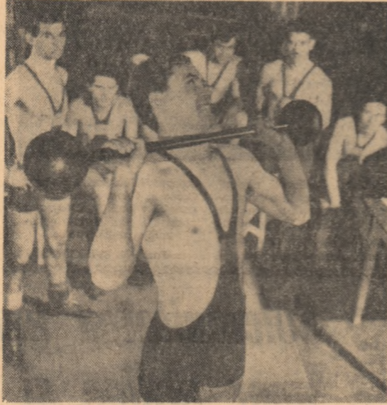
Încă un efort și arhivă vor consemna victoria în cadrul Maximală Dracinski (lăcătul sape-loraj de la Uzinele „1 Mai” Ploiești) la proba de haltere.