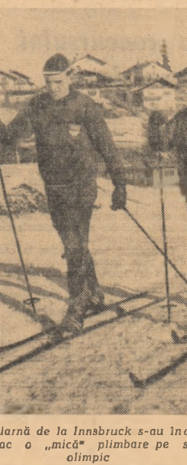
Pregătirile pentru Olimpiada de iarnă de la Innsbruck s-au încheiat. Acum, cei doi fondști din lotul sportivilor germani fac o „mică” plimbare pe schiuri în împrejurimile satului olimpic

Sportivii romîni prezenți la întrecerile de: ● BOB ● SCHI-FOND ● BIATLON ● HOCHEI