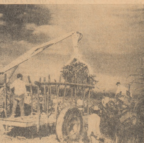
În Cuba se deslășoară recolta mecanizată a trestiei de zahăr. În fotografie: Aspect de pe una din plantațiile de trestie de zahăr.

NEW YORK 7 (Agerpres). Comitetul de pregătire a Conferinței O.N.U. pentru problemele comerțului și dezvoltării a continuat la 6 februarie discutarea țărilor acestei conferințe. Nu poate exista pace fără dezvoltare economică, tot așa cum nu poate exista dezvoltare economică fără o pace generală a spus A. Rodriguez, conducătorul delegației braziliene. Pentru rezolvarea problemelor comerciale internaționale, a spus el este necesar să se creeze un mecanism internațional. La sedința a fost adoptată recomandarea de a se crea încă un comitet pentru pregătirea documentului final al conferinței pentru problemele comerțului și dezvoltării. Acest comitet va fi împuternicit să organizeze sesiune închise neoficiale în ajunul conferinței.