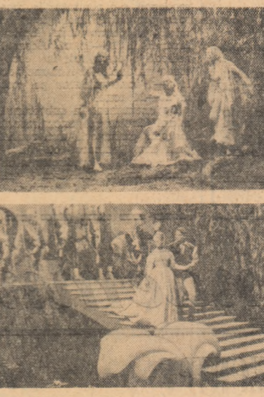
O producție a studiourilor din Barrandov