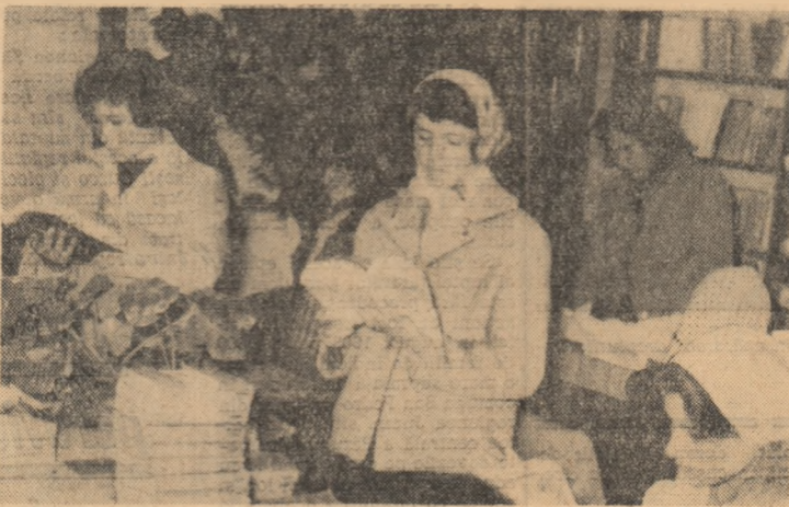
Începe călătoria cărților