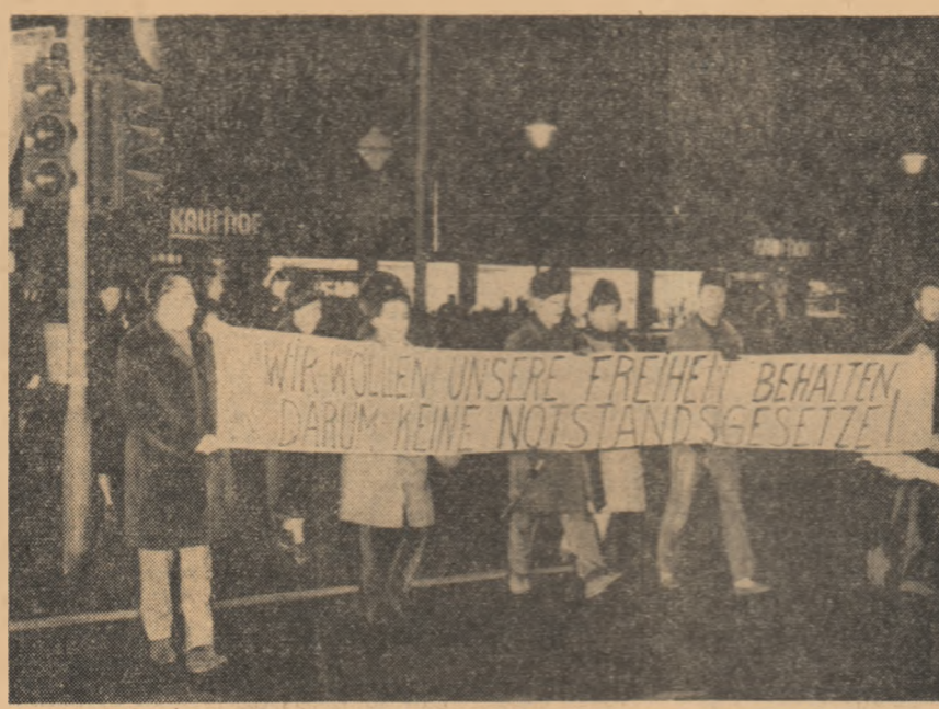
R.F.G.: Aspect de la demonstrația partizanilor păcii din Düsseldorf în apărarea drepturilor cetățenești.

sadei Elveției, care reprezintă interesele lor în Cuba, deși nu eram obligați să dăm informații de acest fel. Statele Unite au capturat în apele internaționale navele noastre pescărești și au arestat echipajele lor. În legătură cu aceasta, a spus în continuare Fidel Castro, guvernul cuban a fost nevoit să recurgă la contra-măsuri. Timp de cinci ani Cuba a aprovizionat cu apă baza maritimă militară Guantanamo, deși nu avea nici un fel de obligații internaționale pentru aceasta. Guvernul cuban a hotărît să înceteze aprovizionarea cu apă a acestei baze. S-a stabilit, că apa să nu fie furnizată întreprinderilor și obiectivelor militare. Acest lucru nu va prejudicia populația careia îi va fi furnizată apă. Capturarea navelor poate avea consecințe periculoase, a subliniat Fidel Castro, rînd revenînd întru totul Statelor Unite.