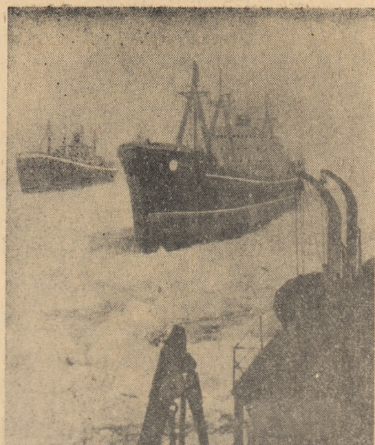
Navigația de iarnă în Extremul Orient. Printre ghețarii Mării Ohotsk.