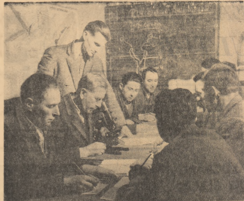
Cite țaine dezvăluie microscopul? Cu ajutorul lui înțelegi mult mai bine o serie întreagă de noțiuni care au-jeri erau suficient de clare. (O lecție la anul II al cercului „Creșterea animalelor” de la G.A.C. Clinic, Te-guinea Hunedoara).