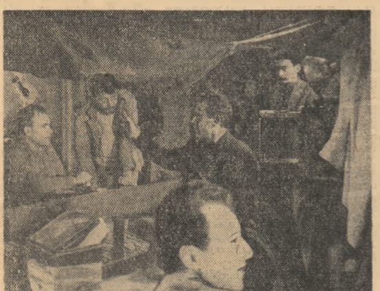
Se pregătește o secvență.