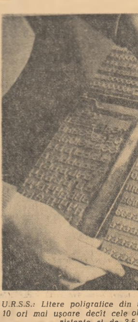
U.R.S.S.: Litere poligrafice din material plastic. Ele sînt de 10 ori mai ușoare decît cele obișnuite, de 3-4 ori mai rezistente și de 3,5 ori mai ieftine.

În ce privește problema Ciprului, mesul discutiilor dintre oamenii de stat americani