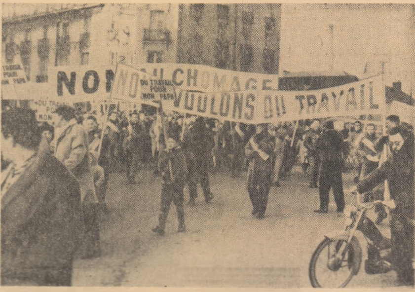
FRANȚA: Muncitorii melurugiști din orașele St. Nazaire și Nantes (două din cele mai mari orașe industriale din departamentul Loire) au intrerut lucrul zilele trecute pentru a participa la demonstrațiile de protest împotriva concedierilor