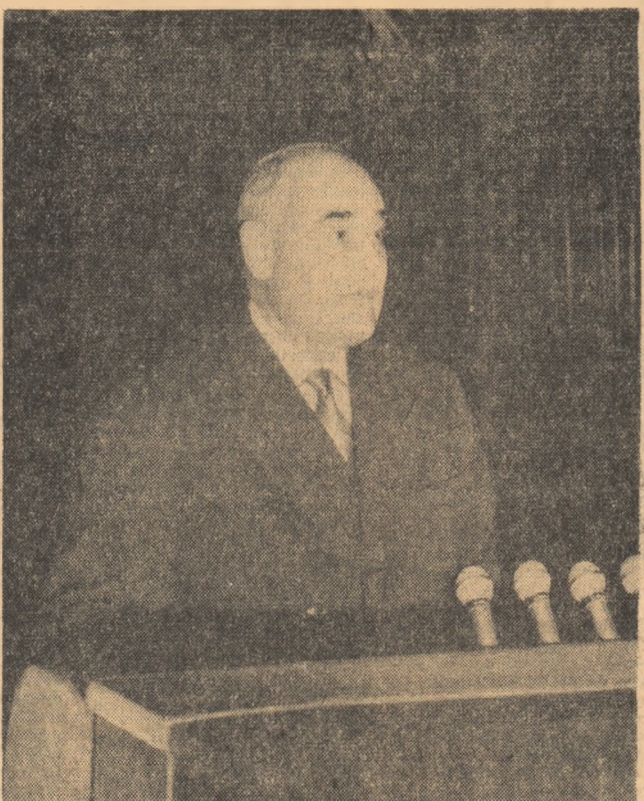
Tovarășul Gheorghe Gheorghiu-Dej la Conferința organizației de partid a orașului București.

Simbătă dimineață au continuat lucrările Conferinței organizației orașenești de partid București. La dezbaterile pe marginea dării de seamă a Comitetului orașenesesc București al P.M.R. pe perioada ianuarie 1962—februarie 1964 și a raportului Comisiei orașenești de revizie, au luat cuvîntul numeroși delegați și invitați.