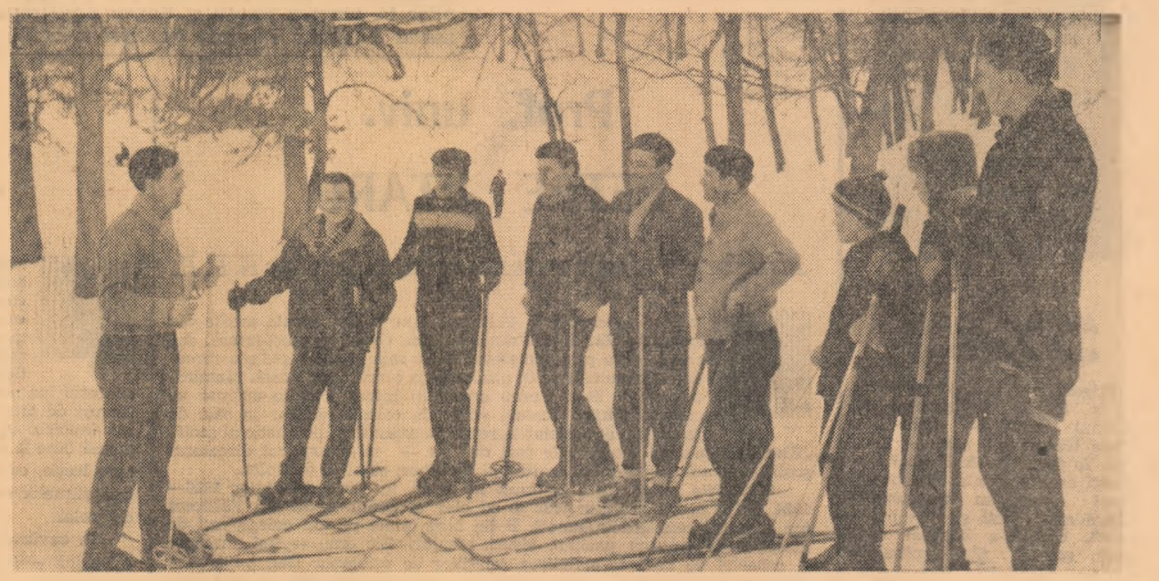
La antrenament cu tinerii schiori de la Uzinele „Independența“ Sibiu, în împrejurimile Parcului de sub Anini.

● Halterofilul Vladimir Golovanov din Habarovsk a stabilit un nou record mondial la categoria semigreă — stiuł