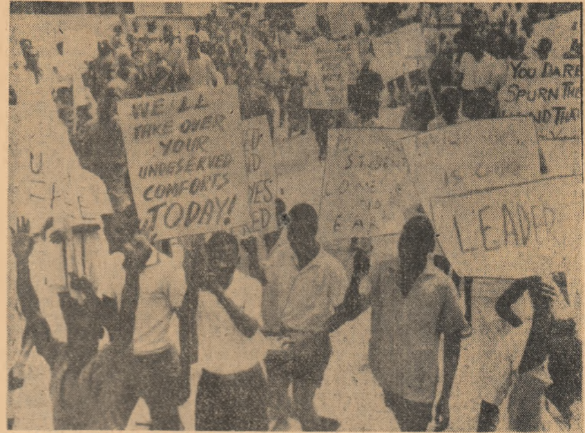
Demonstrație a studenților de la Universitatea din capitala Ganei, Accra, în sprijinul politicii președintelui Nkrumah.

Miercuri la prînz a avut loc prima întrevedere între generalul de Gaulle și președintele Segni în cabinetul particular al președintelui francez. În aceeași zi s-a desfășurat întîlnirea dintre ministrul de externe italian, Saragat, și co-