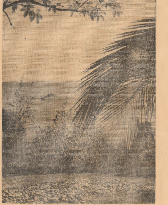
Vedere de pe litoralul cambodgian.

Spărgător de gheață cu jet de apă Chiar gheața cea mai groasă nu rezistă în fața jetului de apă ce țîșnește cu viteză ultrasunetelor de pe bordul unui spărgător de gheață. Experimentările pe model au arătat că cu ajutorul unui astfel de jet pot fi despicate ghețurile cele mai groase și poate fi creat un canal pentru trecerea navelor. Navele prevăzute cu asemenea instalații vor fi de cinci ori mai economice în comparație cu spărgătoarele de