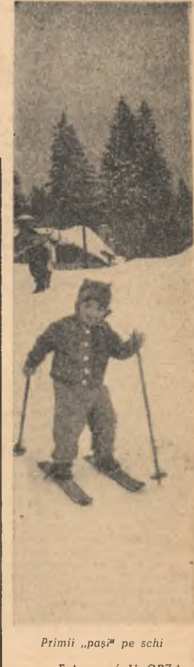
Primii „paș” pe schi