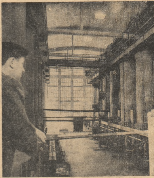
Vedere a instalației de extracție a tanantului de la Fabrica de tananți din orașul Pitești