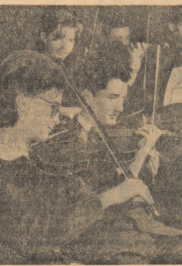
Orchestra simfonică a școlii la o repetiție

De cîteva ani, în pauza mare a fiecărei joi, în toate clasele se ascultă cu deosebit interes emisiunea locală. Concepția ca o emisiune literară — ale cărei teme sînt elaborate în cadrul cenaclului — fiecare emisiune este realizată, prin rotație de colectivul unei clase. Eminescu.