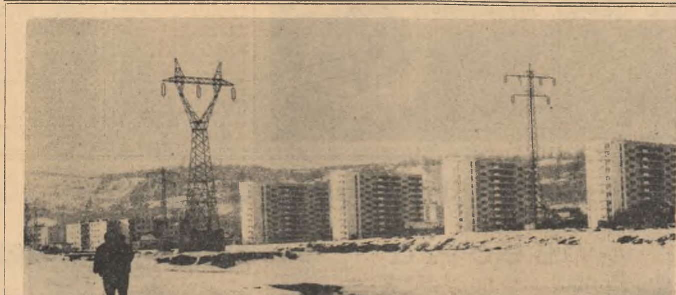
Noi construcții pentru oamenii muncii din Cluj