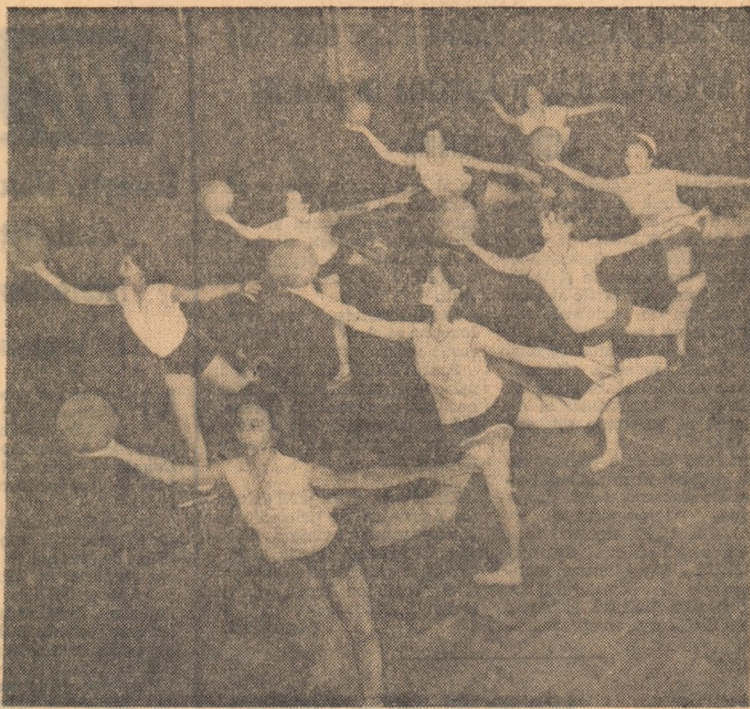
Elegantă, grație, în ritmul pianului (o repetiție a cercului de gimnastică artistică).