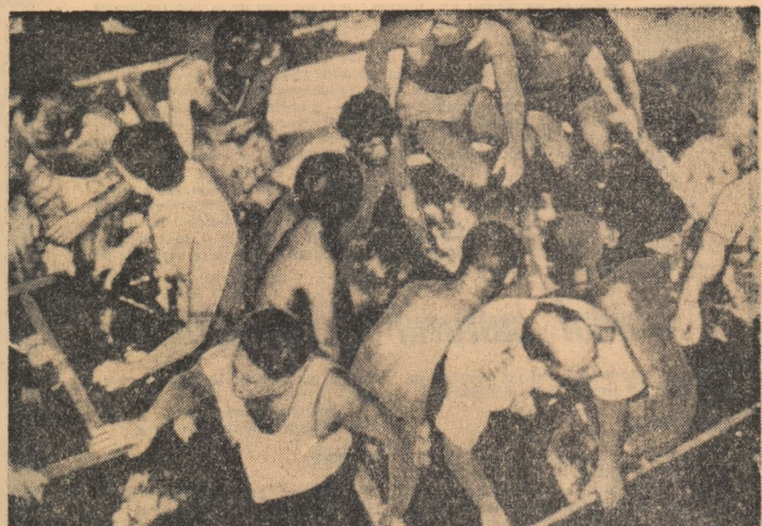
După cum s-a anunțat, nu de mult s-a produs o ciocnire între două vase australiene. Foto grafică înfățișează un aspect din timpul operațiunilor de salvare a celor alțiți pe bord.