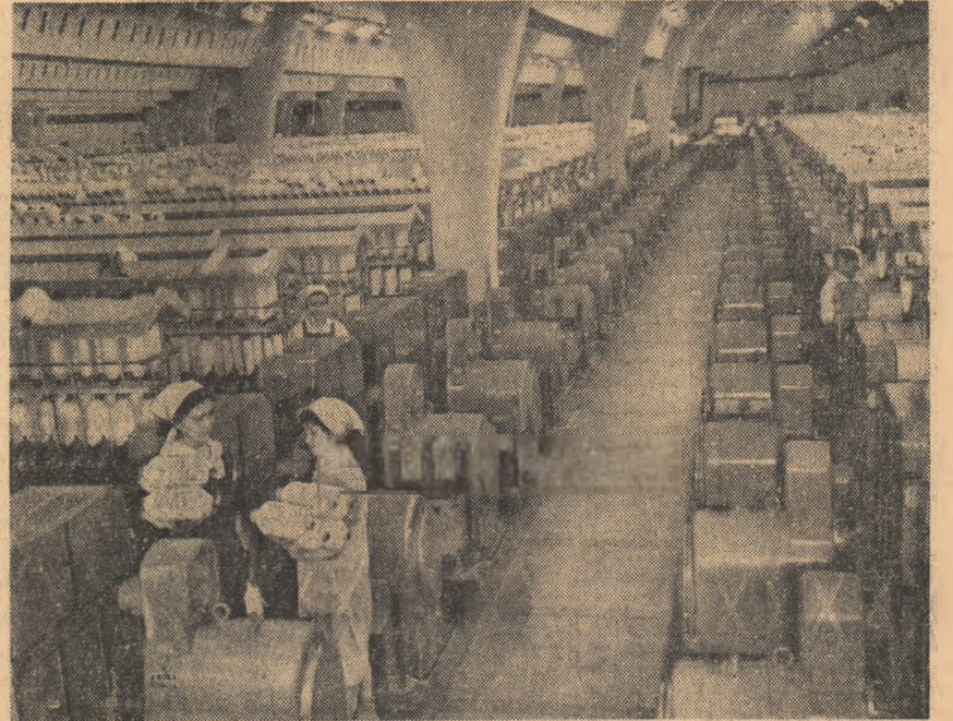
Aspect din secția ringuri de la unitatea A a Întreprinderii textile din Pitești.

partizați în gospodăriile colective din raioanele Tirnăveni, Reghin, Tg. Mureș, Luduș, Odorhei, iar 23 de studenți în gospodăriile agricole de stat din regiune.