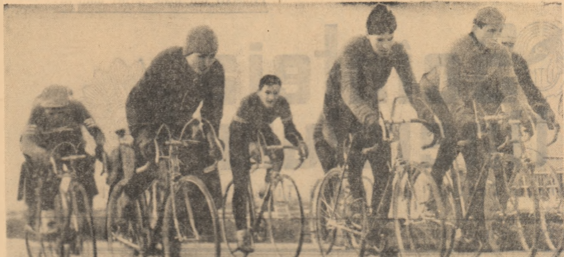
Cicliștii ploiesteni în prima întrecere a Spartachiadei Republicane.