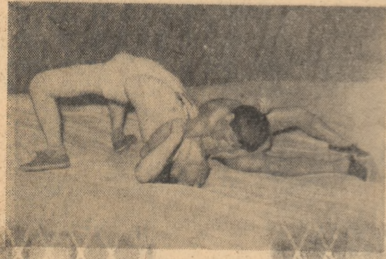
Printre tinerii Uzinei bucureștine „23 August” sportul luptelor se bucură de o mare popularitate. Vă prezentăm o imagine de la întrecerile desăvurate duminică.