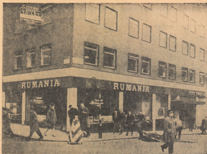
Exteriorul sedlului O.N.T.-Carpați, deschis recent la Londra.