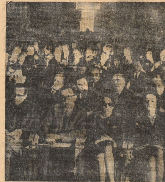
Aspect din timpul lucrărilor Conferinței internaționale a tineretului și studenților de la Florența.

Documentele adoptate de către fiecare comisie, precum și documentul final al conferinței, recomandă numeroase activități practice în sprijinul dezarmării, coexistenței și luptei de eliberare națională a popoarelor asuprite de colonialism. Un loc important în dezbaterile din cadrul comisiilor de lucru l-au ocupat problemele privitoare la educarea tineretului în spiritul păcii, respectului reciproc și rezoluției între popoare. În rezoluțiile adoptate