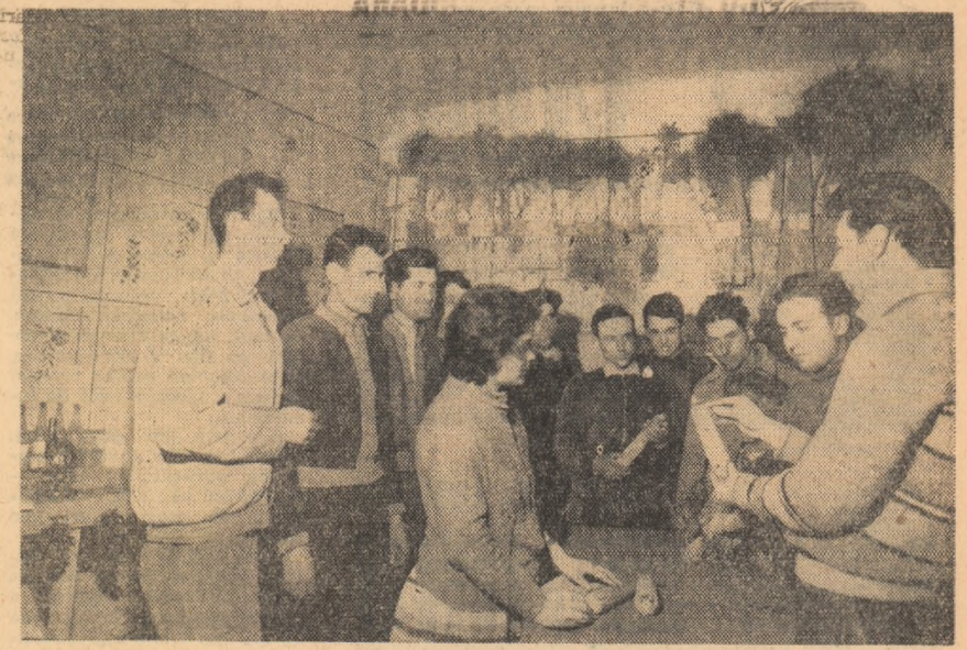
Se apropie însămînțatul porumbului. La casa-laborator a G.A.C. Crimpoia, regiunea Argeș, se recapitulează cunoștințele cu privire la agrotehnica hibridilor dublii ca și voi îi folosii.