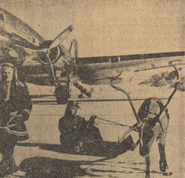
FINLANDA: O intîlnire originală între două mijloace de transport ale Laponiei: Un avion al Companiei aeriene finlandeze și o sanie, trasă de un ren, specifică finului.

Ședința comisiei a decurs într-o atmosferă de lucru și de prietenie.