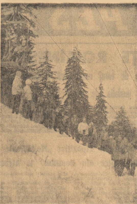
Cu telefericul și pe jos (spre Cristianu Mare).