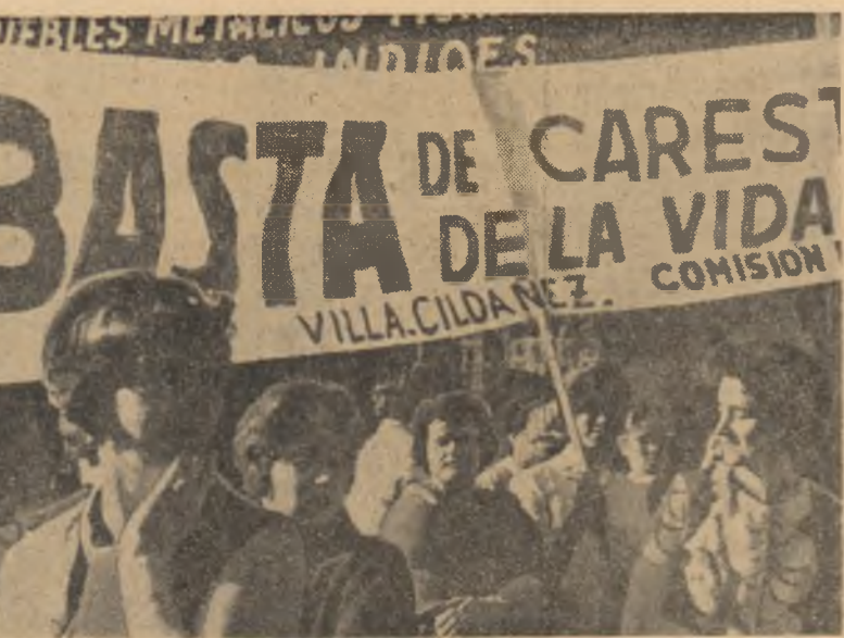
O demonstrație de protest a femeilor din Buenos-Aires împotriva creșterii costului vieții.

Văduva cea abătută a redescoperit imediat o leonică furioasă. Acuzările le-a calificat drept o „idiocinție”, iar asupra protectorilor ei de ieri a abătut un potop de reproșuri. Cum de tulbură liniștea mamei unor orfani?