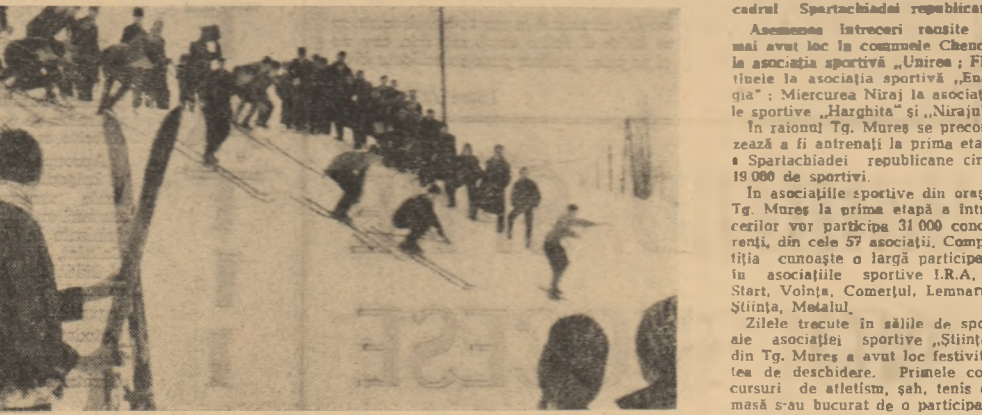
Elevi din Sibiu la o pasionantă întrecere de șah.