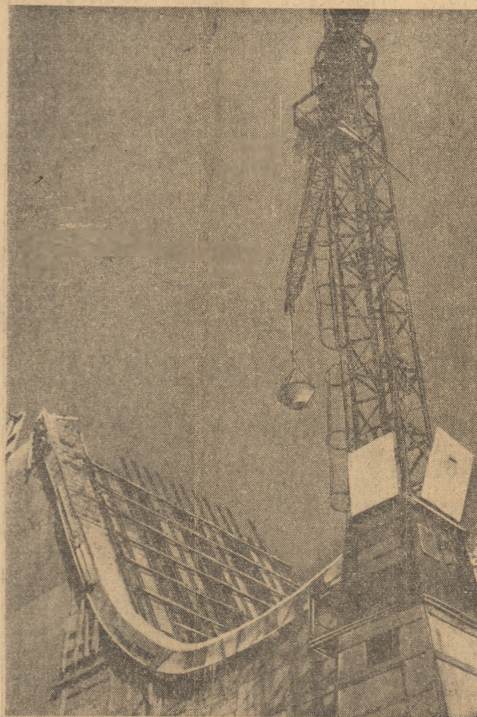
Lucrările construcției barajului de pe Valea Firizei din zona Baita Mare avansează într-un ritm susținut. Prin construirea acestui baraj va crește debitul de apă, satisfăcîndu-se astfel necesitățile tot mai mari de consum ale unităților industriale din regiune. În plus, se vor crea rezerve, dînd posibilitatea astfel să fie irigate peste 1.000 hectare de terenuri agricole. In spatele barajului se va crea un lac de acumulare cu un volum de circa 17 milioane metri cubi de apă. În aval se va înălța al doilea baraj, mai mic, care va avea o putere instalată de 4.000 kilowați și va putea produce peste 20 milioane kWh anual.

JAWAHARLAL NEHRU Prîmul ministru al Indiei