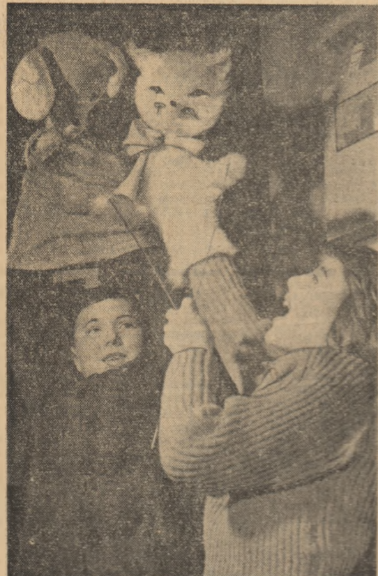
Micii minitorii de păpuși, prezintă spectatorilor din sala de spectacole a Palatului pionierilor din Capitală o nouă piesă.