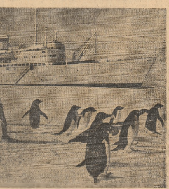
Sosirea motonavei sovietice ESTONIA la stajiuana anatarcică Mirtini.

Prima grevă a unei mișri umane nu a reușit