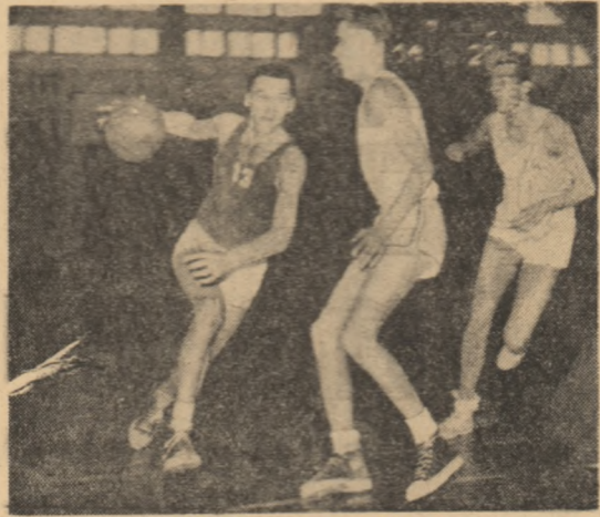
O iază din meciul masculin de baschet: Dinamo-București — Steagul Roșu Brașov