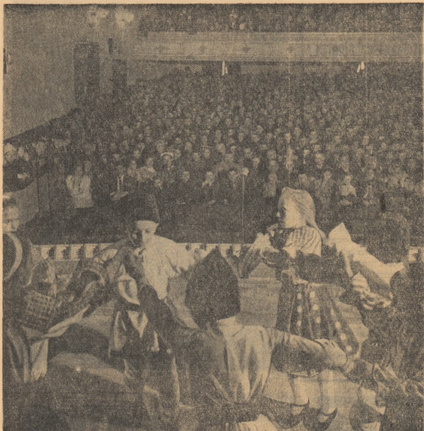
Spektacol la casa de cultură