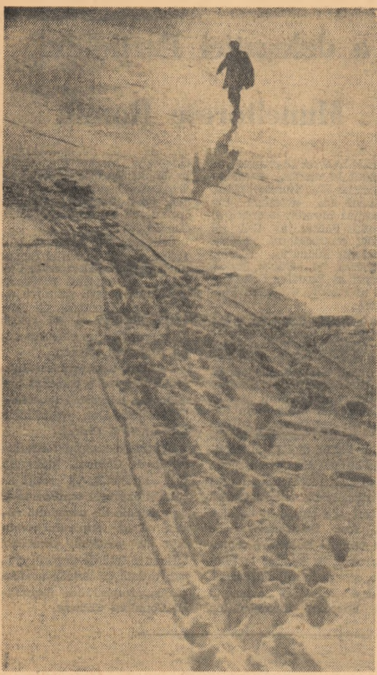
Fotografia de Vasile Polizache (premiul II).