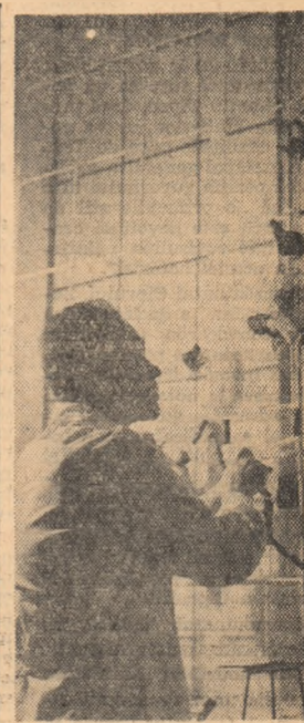
Intr-unul din laboratoarele Institutului de cercetări alimentare din București