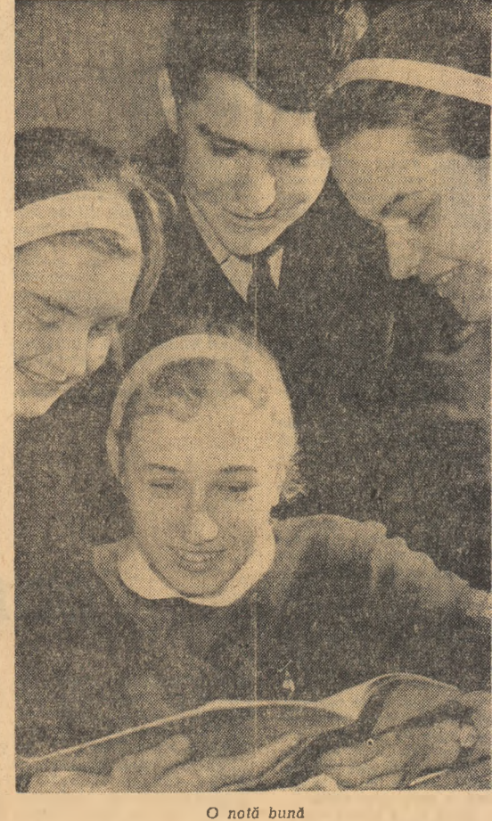
O notă bună