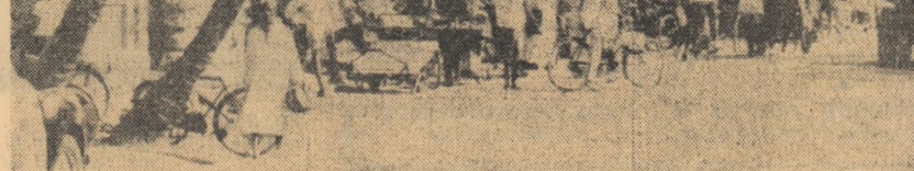
Un aspect din centrul capitalei Zanzibarului — orașul Zanzibar