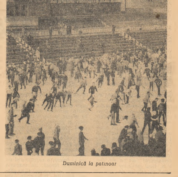
Duminică la patinoar

De cîteva zile, transporturile directe de mărfuri între stațiile de cale ferată Craiova—Petroseni se efectuează cu ajutorul locomotivei Diesel-electrice. Acestea înlocuiesc mai multe locomotive cu abur la remorcare a unei garnituri de mărfuri, iar datorită utilizării lor, viteza comercială a sporit cu 50 la sută.