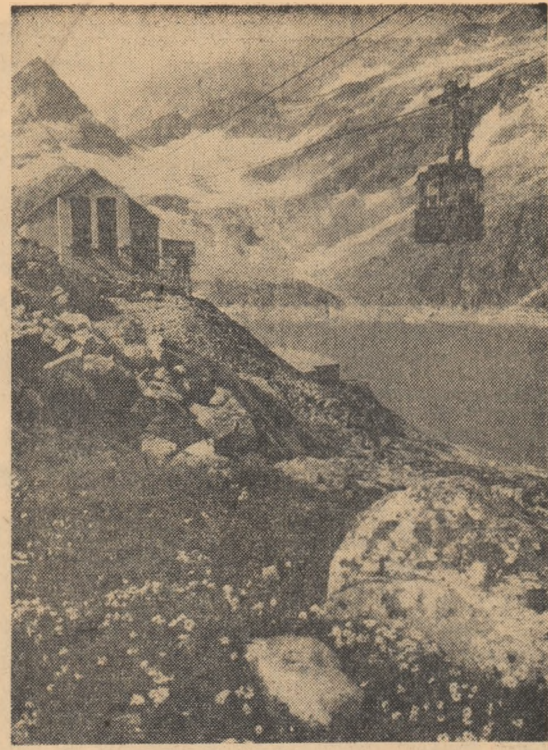
O pitorească imagine din Austria: cu teletelicul de-a supra Lacului Alb

VIENA 14 (Agerpres). — După cum anunță corespondentul din Viena al agenției France Presse, mai multe sute de tineri vienezi au organizat vineri un marș de protest împotriva discriminărilor rasiale practicate în Africa de Sud. Potrivit corespondentului, participanții la marș purtau pancarte pe care se putea citi: „Libertate pentru negri în Africa de Sud”, „Nu cumpărați mărfuri provenind din Africa de Sud”, precum și alte lozinci împotriva discriminărilor rasiale. În timpul marșului, numeroase grupuri de studenți străini care studiază în capitala Austriei s-au alăturat manifestanților. France Presse menționează că marșul a decurs în liniște, nu s-a semnalat nici un incident.