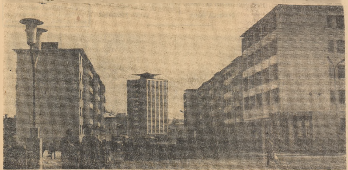
Nou construcții de locuințe în orașul Cluj