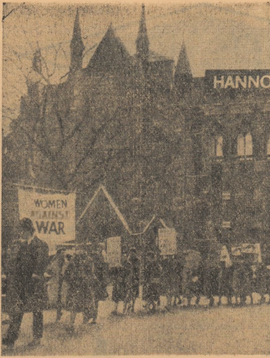
Anglia. Aspect din timpul unei demonstrații pentru pace a femeilor londoneze.

ferinței s-a arătat că guvernul român consideră necesar ca împreună cu celelalte probleme aflate pe ordinea de zi să se discute și: importanța și utilitatea acordurilor comerciale de lungă durată pentru stabilitatea și dezvoltarea schimburilor comerciale internaționale; rolul pozitiv pe care îl pot avea livrările pe credit de echipament destinat construcției de unități industriale, proprietate exclusivă a țării care primește asemenea credite rambursabile prin cote părți din producție proprie obținută; importanța pe care o utilizează în scopuri pașnice a resurselor eliberate prin dezarmare o parte avea pentru comerțul internațional și dezvoltarea economică. Delegația țării noastre aflată la Geneva în frunte cu tovarășul Gogu Rădulescu, vicepreședinte al Consiliului de Miniștri, va milita pentru abordarea cu realism și înțelegere a chestiunilor aflate în discuție, pentru a se rezolva problemele cardinale ale normalizării comerțului internațional contemporan.