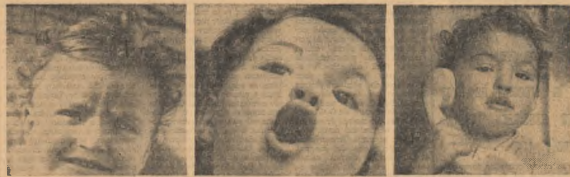
— Hai băieți, vă rog frumos!