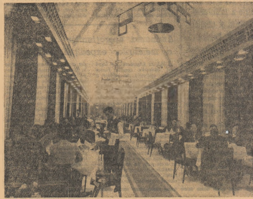
Aspect interior al elegantului restaurant brașovean, „Cerbul carpatin”.