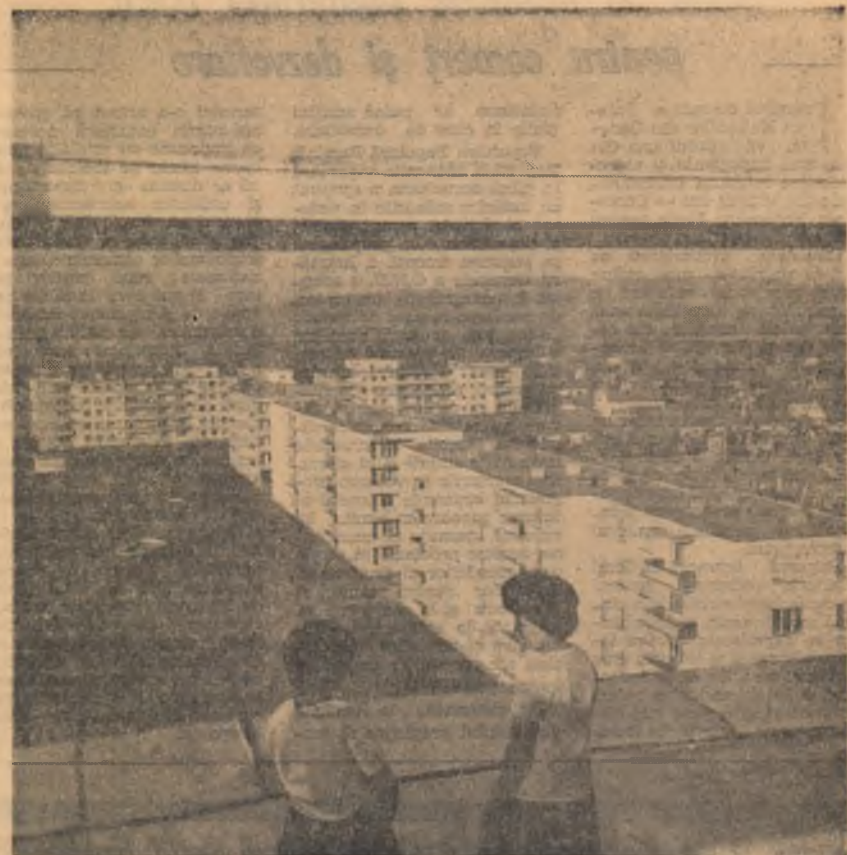
Noul cartier din orașul Sibiu.

• Disciplina la practică a elevilor lasă uneori de dorit. La Codlea, ca și la Făgăraș, de altfel, unii elevi se plîmbă, nu-și respectă lucrurile de muncă. E drept, că specificul muncii în chimie, care constă în supravegherea aparatelor