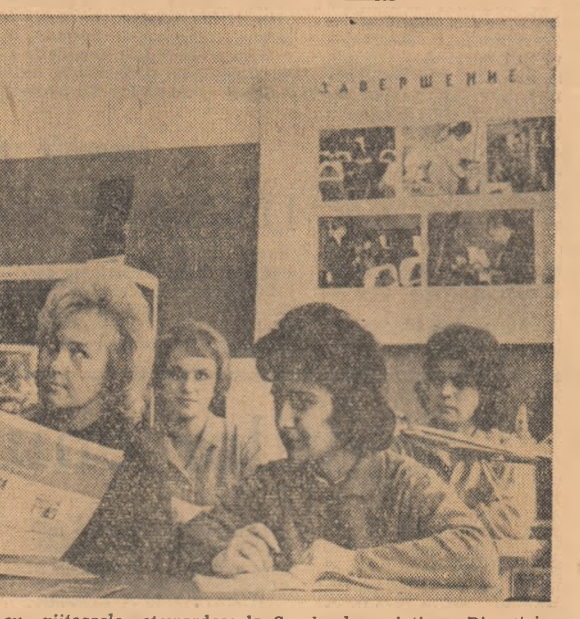
U.R.S.S. În timpul unei lecții cu viitoarele stewardese la Școala de aviație a Direcției aviației civile din Moscova.

ALGER. — La 22 martie, la Alger se va deschide cea de-a 6-a sesiune a Consiliului de solidaritate a țărilor Asiei și Africii la care vor participa reprezentanți din 71 de țări. Sesiunea va examina măsurile concrete ce urmează să fie luate în vederea întăririi legăturilor cu Organizația Unității Africane. O mare atenție se va acorda, de asemenea, mișcării de eliberare națională din țările care se află încă sub dominația colonială. Solidaritatea popoarelor Africii și Asiei, a declarat vicepreședintele partidului Uniunii populare Africane „Zimbabwe” din Rhodesia de sud, este o mare forță antiimperialistă. Ea se bazează pe temelia trinitică a telurilor comune care constau în victoria depimă asupra colonialismului și în asigurarea unei păci generale trainice.