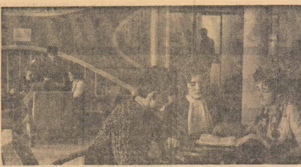
Hoțul cantinei Complexului studențesc din Tg. Mureș