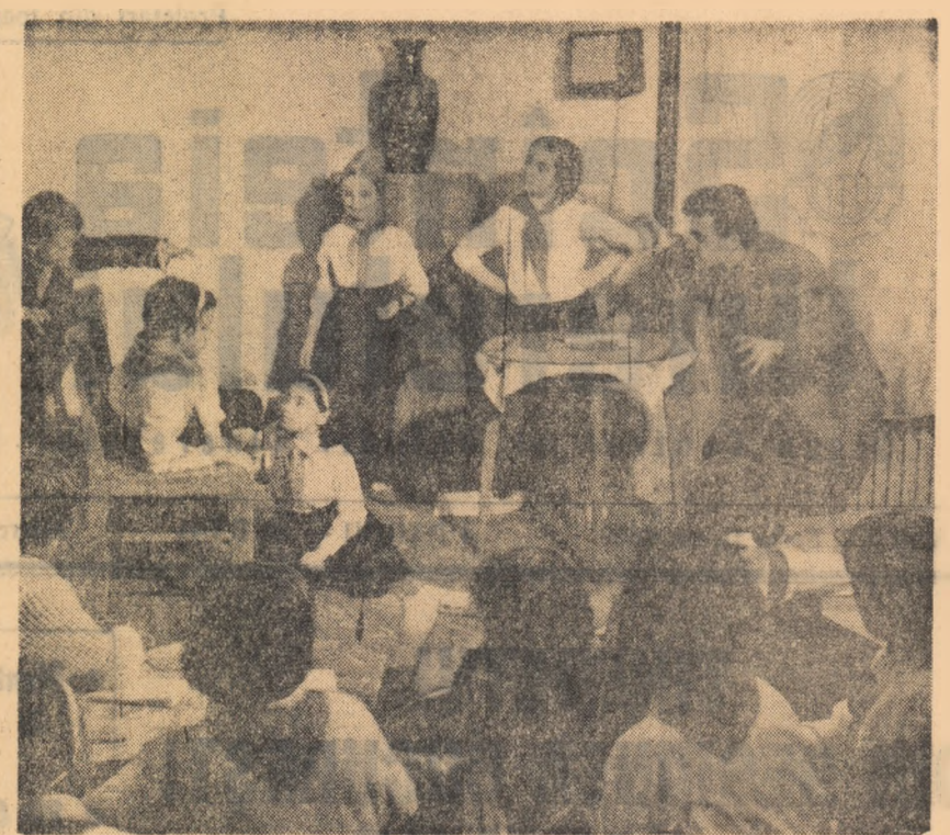
La Casa pionierilor din Ploiești, repetiție la cercul de artă dramatică.