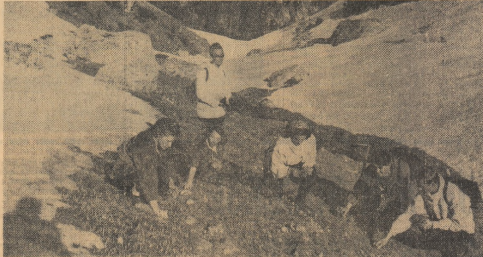
Primăvară în Valea Cerbului

Îndeplinirea înainte de termen a planului trimestrial a fost posibilă ca urmare a unor măsuri organizatorice eficiente, cit și a dotării exploațiilor cu utilaje de mare randament.