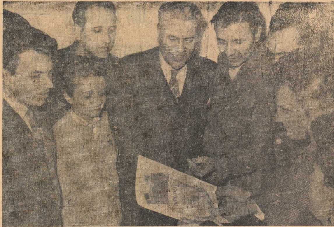
Ieri după-amiază colectivul Uzinei „Armătura” a primit diploma Consiliului local al sindicatelor din orașul București, de întreprindere înfruntată în întrecerea socialistă pe anul 1963, între întreprinderile de industrie locală din Capitală. În fotografie: momentul înmînderii acestei distincții.