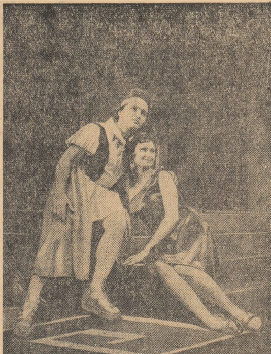
R. S. CEHOȘLOVACĂ. Scenă din opera „Lysistrata” de Gherase Dendrino, la Teatrul muzical din Ostrava.

Comitetul special O.N.U. pentru examinarea problemei aplicării Declarației de principii la acordarea independenței țărilor și popoarelor coloniale, a încheiat dezbaterile în legătură cu situația din Rhodesia de sud și cere ca guvernul britanic să ia măsuri pentru a pune capăt fără întârziere persecuțiilor judiciare a adversarilor politici de apartenență din R.S.A.