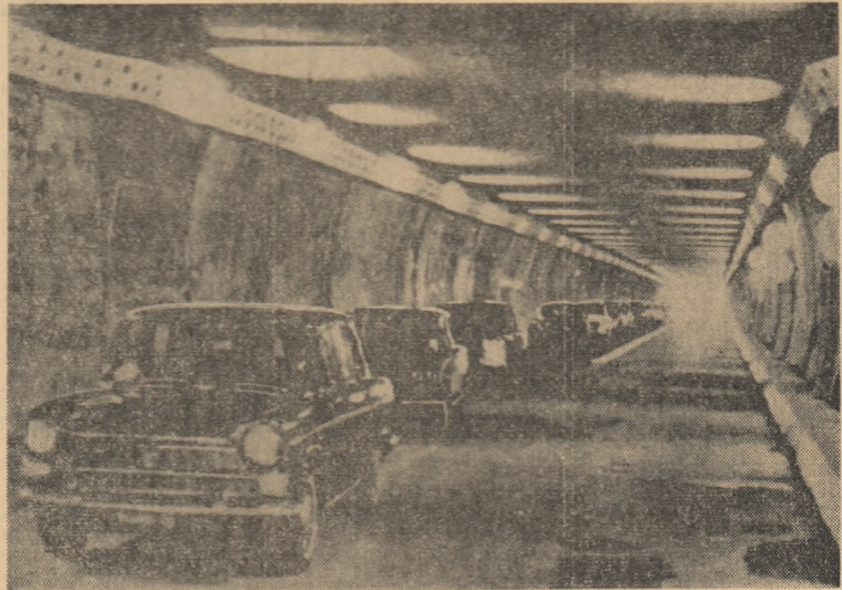
ELVEȚIA. Prima coloană de automobile trece prin tunelul ghețos Saint-Bernard, deschis recent în Alpi.