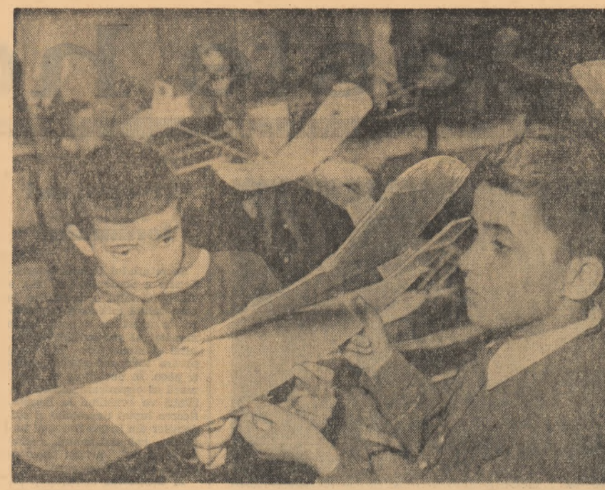
La cercul de aeromodelism al Casei pionierilor din Suceava.

Comitetul orașenesc U.T.M. a prevăzut împreună cu întreprinderea regională de difuzare a filmului organizarea unor matinee speciale pentru copii și tineret, precum și un concurs pe marginea unui film cu o temă inspirată din viața copiilor. O colaborare asemănătoare există și cu teatrele din Brașov. Modelul literar „Poezia primăverii” pregătit de elevii Școlii medii nr. 2 va fi prezentat în fața tuturor elevilor din oraș. Și, în sfîrșit, elevii sînt pregătiti să participe o serie de