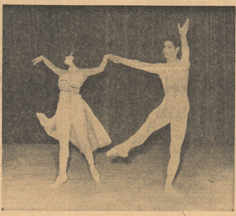
Scenă din recitalul de balet prezentat de elevii școlilor de coregrafie din București și Cluj

Celui de al XXI-lea Congres al Partidului Comunist din Olanda Comitetul Central al Partidului Muncitoresc Român adresează un călduros salut fratresc delegaților la cel de-al XXI-lea Congres al P. C. din Olanda. În cei 45 de ani de la înființarea sa, P. C. din Olanda a militat neobosit pentru marea cauză a clasei muncitoare, pentru apărarea intereselor și drepturilor democratice ale întregului popor olandez. Vă urăm, dragi tovarăși, noi succese în întărirea continuă a partidului dv. în lupta pentru pace, democrație și progres social. COMITETUL CENTRAL AL PARTIDULUI MUNCITORESC ROMÂN