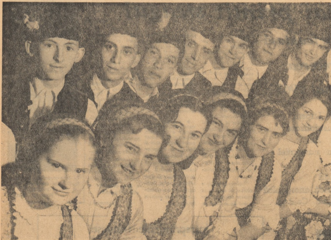
„Muncă bună, voie bună” — așa se intitulază noul program al brigăzi artistice de agitație din satul Căvin, raionul Lipova