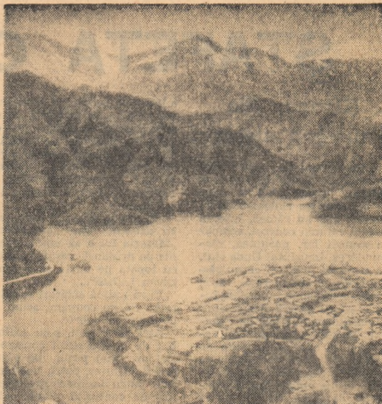
O pitorească vedere panoramică a lacului artificial Sagami pe care se vor desfășura într-o serie de canoie în cadrul Jocurilor Olimpice ce vor avea loc în Japonia.