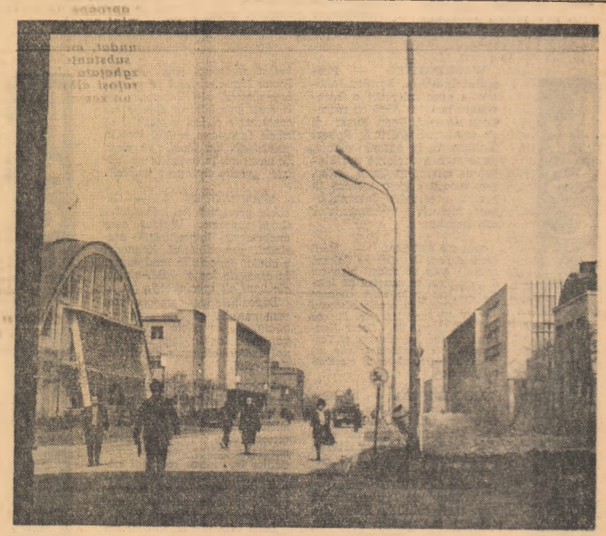
Pe una din aleile din incinta Uzinelor de tractoare Brașov

De cîrînd, a intrat în funcție în uzina noastră o nouă secție: silicatul de sodiu. Muncitorii care o deservesc au urmat și urmează în continuare un curs de specializare. În cîrînd, se vor deschide noi cursuri de ridicare a califica-