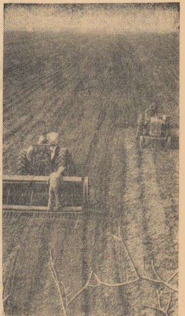
Pe tarilele întinse, pregătite ca la carle, mecanizatorii de la G.A.S. Mogoșoaia, regiunea București, pun sub brazdă sîmînța recoltelor viitoare