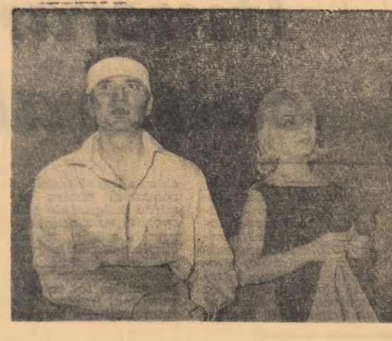
Moment din spectacolul cu piesa „Rinoceri” de Eugen Ionescu, a cărei premieră are loc astăzi seară la Teatrul de Co-medie.

Evident, lectura scrierilor lui I. D. Bălan ridică inerent probleme com- plexe, cum ridică practic orice lu- crare de critică și istorie literară. Cu modul cum sînt rezolvate, de la caz la caz, unele chestiuni le- gate de creația cutăruia sau cută- rui scriitor, pot exista puncte de vedere diferite, anume con- cluzii trase pe marginea cută- rei opere contemporane nu pot în- truni numai de un sufragiu unan- im. Fenomenul e fatal. De a- ceașă asupra unor atari aspecte n-am socotit că e necesar să în- sistăm aici. Pentru că dincolo de a- ceste, eforturile depuse de I. D. Bălan pentru progresul literaturii noastre noi sînt indiscutabile.