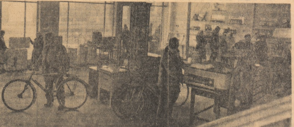
Interiorul Complexului comercial din comuna Topolovău Mare, raionul Lugoj