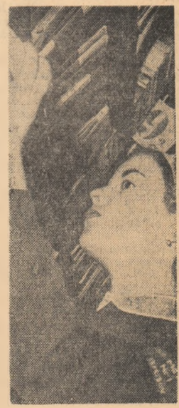
Pe care s-o aleg?

de toamnă în proporție de 42 la sută. Comparativ cu perioada corespunzătoare a anului trecut, aceste importante lucrări agrotehnice sunt mai avansate și se desfășoară într-un ritm crescând, ceea ce permite și efectuarea însămânțărilor în epocile optime. Până la sfârșitul acestei săptămâni au fost însămânțate cu diferite culturi din prima epocă 700.000 hectare, suprafață aproape dublă față de anul trecut. Măzărarea a fost însămânțată pe 70 la sută din suprafața prevăzută, floarea-soarelui pe 45 la sută, iar sfecla de zahăr pe 37 la sută. Suprafețe, de asemenea, mai mari decât în anii trecuți au fost semănate până acum cu legume și cartofi timpurii și de vară. În regiunile București, Dobrogea, Galați, Ploiești, Argeș și Oltenia, unde din primele zile primăverii pentru executarea lucrărilor agri-