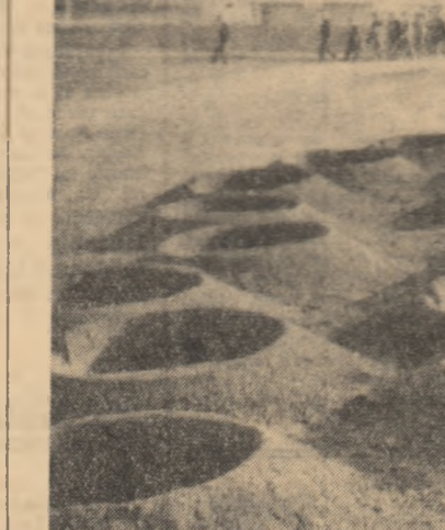
Microscopice „guri vulcanice”? Nicidecum. Doar gropile făcute de mașina automată pentru plantat pomii pe unul din șantierele din apropierea Capitalei.

Păsările și animalele de la grădina zoologică din Takoma (statul Washington) au semnalat cutremurul catastrofal de pămînt care s-a produs în Alaska, la o distanță de 2.414 km. cu o zăvărlă surprinzătoare. „Ne aflăm la poartă și privim spre grădina — a declarat directorul acesteia, J. H. Mcemanin — cînd, din-