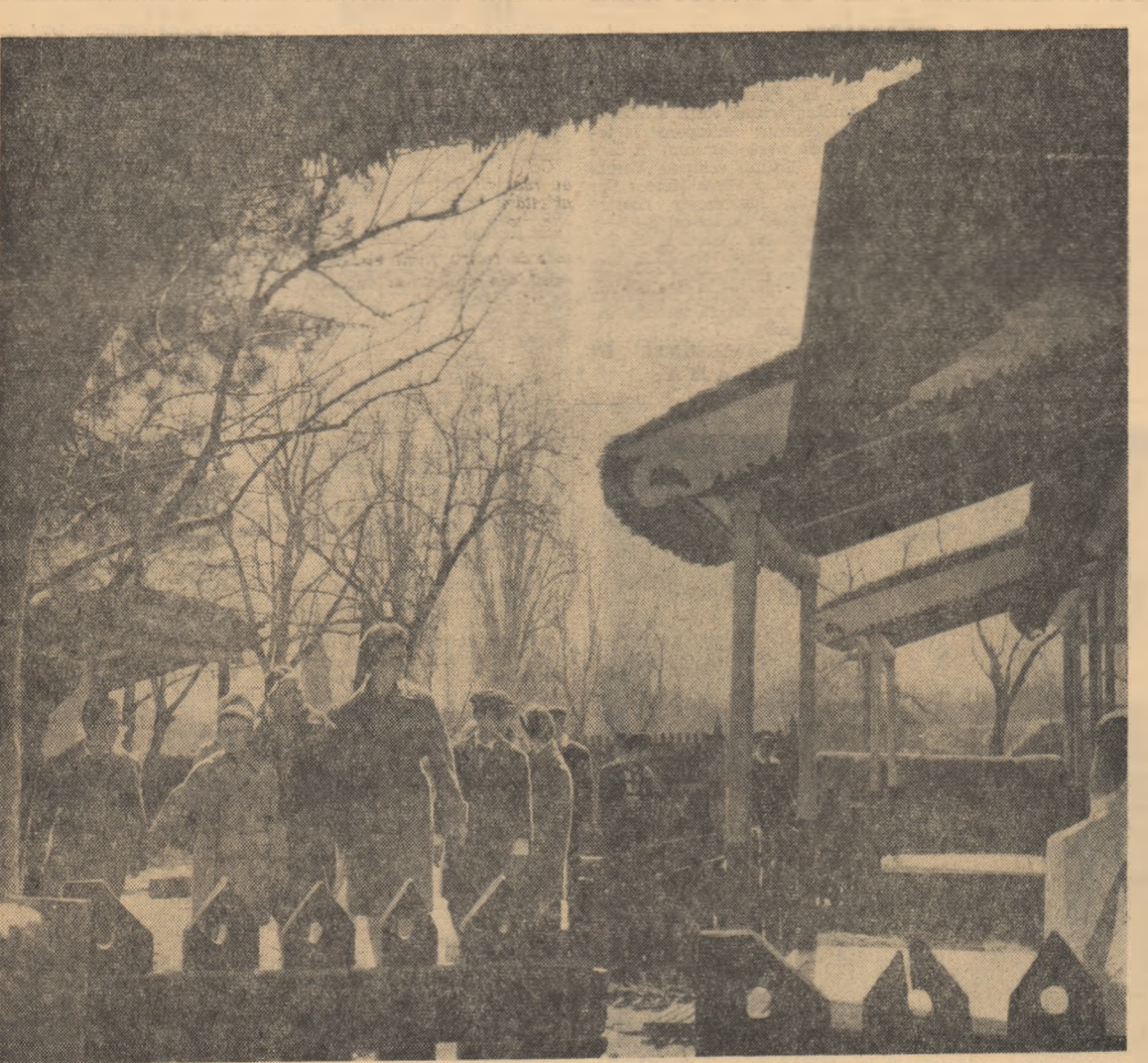
Elevii de la Școala medie nr. 40 din Capitală, în vizită la Muzeul Satului