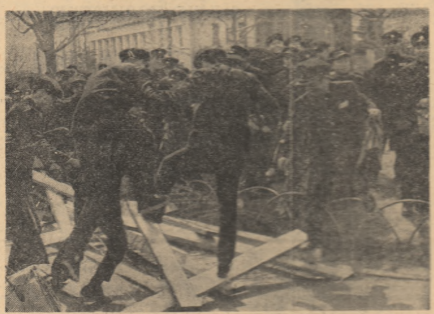
COREEA DE SUD. Aspect de la una din demonstrațiile studenților din Seul împotriva tratatelor japoano-sud-coreene.