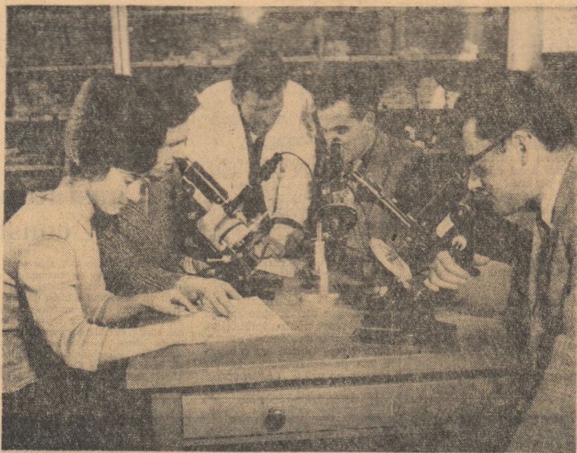
Institutul de petrol, gaze și geologie. Un aspect din laboratorul de metale utile, secția microscopie.