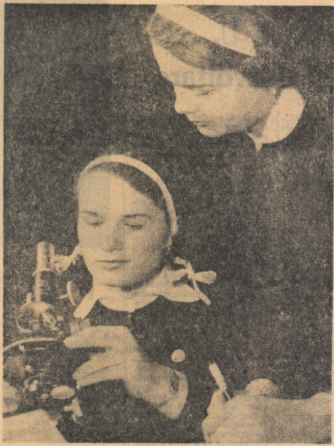
În laboratorul de științe naturale al Școlii medii din Sinaia. După o „călătorie” prin intermediul microscopului, în lumea plantelor, cunoștințele se întipăresc mai bine în memorie.