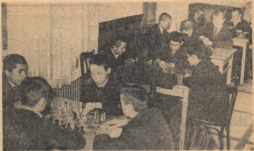
După orele de școală, după ce și-au pregătit lecțiile pentru a doua zi, o partidă de șah binevenită. În fotografie: imagine des înflințită la clubul Școlii profesionale de petrol-chimie din Climpina.

Întreg colectivul școlii, elevii și profesorii urmăresc evoluția artiștilor din anul I A. După prezentarea piesei „Sub mărul sălbatic”, pe scenă a apărut brigada artistică de agitație. Se spun cuvinte de laudă pentru elevii frunțași ai clasei, dar nu lipsesc nici înfăpșurările la adresa unora care mai întîrzie la ore, sau „uită” să-și facă toaleana temele. Au mai urmat recitări, o suită de cîntece populare executate la flaut, cit și de soliștii vocali. Rînd pe rînd au intrat apoi în concurs „artiștii” anului I B, al anului II A, și ai celorlalte clase. La concursul cultural-artistice al școlii, toate colectivele s-au prezentat cu programe bogate. Fiecare clasă a avut brigada artistică de agitație, o piesă de teatru, soliști, instrumentiști și recitatori. Elevii anului III C, veterani activității artistice din școală, au cîștigat locul I. Nu e mai puțin adevărat însă că și celelalte colective au contribuit la succesul concursului artistic. STERICĂ DICU anul III C — Centrul școlar al Ministerului Economiei Forestiere-Caransebeș