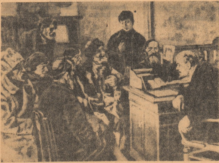
Tabloul înfrîmțurării lui Lenin în timpul convorbirii cu o delegație de țărani.