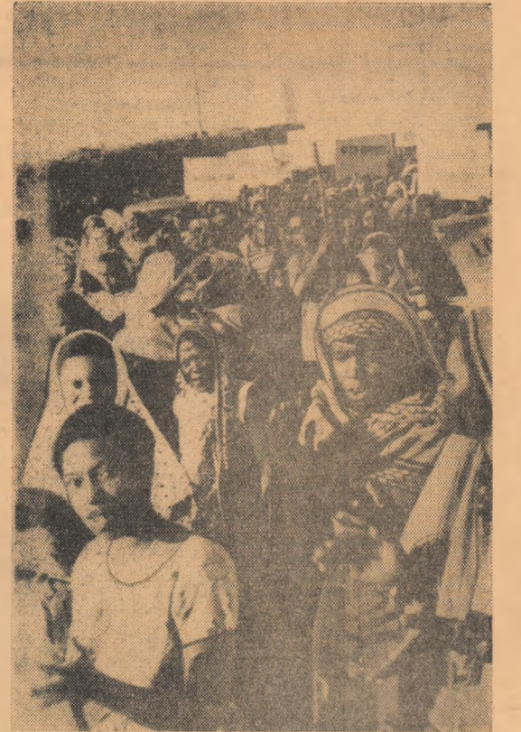
Manifestație populară în Zanzibar în sprijinul politicii guvernului