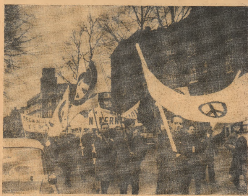
OLANDA: La Amsterdam a avut loc un mars împotriva înarmării atomice, la care au participat 10 000 de partizani ai păcii. În fotografie: demonstrații pe străzile Amsterdamului

Referindu-se apoi la interpretarea artiștilor romini, Claude Sarraute subliniază că „ansamblul R. P. Romine este, înainte de toate, un scrupulos conservator, un mecanic de ceas un cu perfecțiune, furnizor o execuție tehnică întotdeauna minunată a unui repertoriu bogat, un conservator de costume, de pași, de instrumente și instrumentiști”.