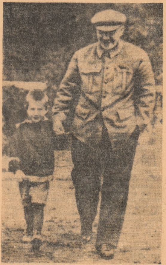
Lenin la una din plîmberile cu nepotul său Vilea