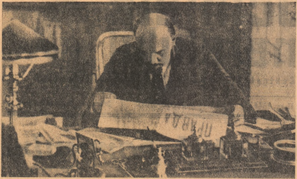
Vladimir Ilici Lenin în cabineta sa de lucru din Kremlin

Istoria este martora înaintării de nestăvilit a ideilor leninismului de-a lungul și de-a latul continentelor. Epoca noastră este epoca triumfului învățăturii lui Marx, Engels, Lenin.