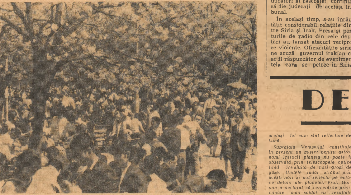
În fotografie: o vedere parțială din parcul Ueno din Tokio. Mii de locuitori ai orașului s-au adunat zilele trecute pentru a admira ciresii în floare

HAGA. — Agenția Associated Press relatează că o reuniune a acționarilor societății „Royal Dutch Petroleum Company”, secretarul general al N.A.T.O., Dirk Stikker, care, după cum se știe și-a anunțat demisia, a fost propus pentru un post de director. Stikker s-a declarat dispus să preia noul post cu începere de la 1 septembrie.