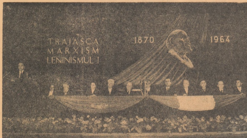
Prezidiul adunării solemnă din Capitală