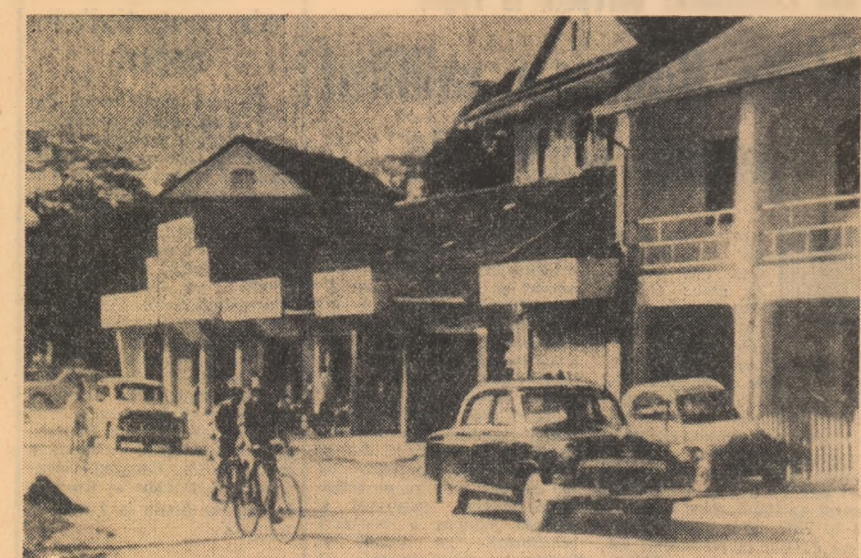
Aspect din orașul loajian Vientiane

Potrivit agenției Associated Press, ultimele evenimente din Santo Domingo „par să fi dat naștere unei grave amenințări la adresa juntei guvernamentale din Republica Dominicană”.