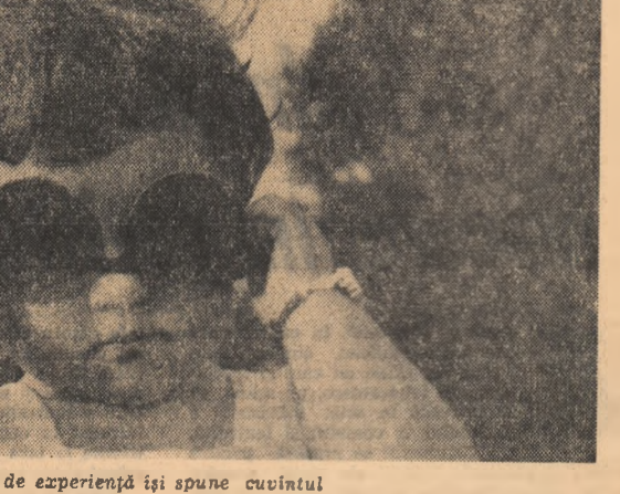
Lipsa de experiență își spune cuvîntul

Autoarea reconstituie atmosfera provincială prăluite cu vîsurile dezamăgite și birji cu cai costelivi, amintind cele mai bune pagini din literatura noastră dedicată unor asemenea episoade și reușește să deseneze