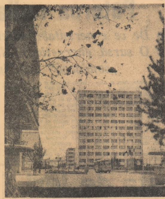
Perspectivă nouă în cartierul Figlina — Galați.

Oamenii muncii din întreaga țară muncesc cu însuflețire pentru traducerea în viață a angajamentelor luate în cîntecul celei de-a XX-a aniversări a eliberării patriei. De la începutul anului, colectivele întreprinderilor din 7 regiuni ale țării — Ploiești, Argeș, Hunedoara, Banat, Cluj, Iași și Maramureș — au obținut economii suplimentare la prețul de cost în valoare de peste 100 milioane lei. Un aport deosebit la obținerea acestor realizări a fost adus de colectivul Combinatului siderurgic din Hunedoara, care, prin gospodărirea judicioasă a materialelor ce intră în încălzirea furnalelor și ridicarea temperaturii aerului insuflat în furnale, a economisit anul acesta circa 15.000 tone cocs metalurgic. Siderurgii hunedoreni au realizat economii suplimentare la prețul de cost și beneficii peste plan a căror valoare depășește 25 milioane și respectiv 26 milioane lei.