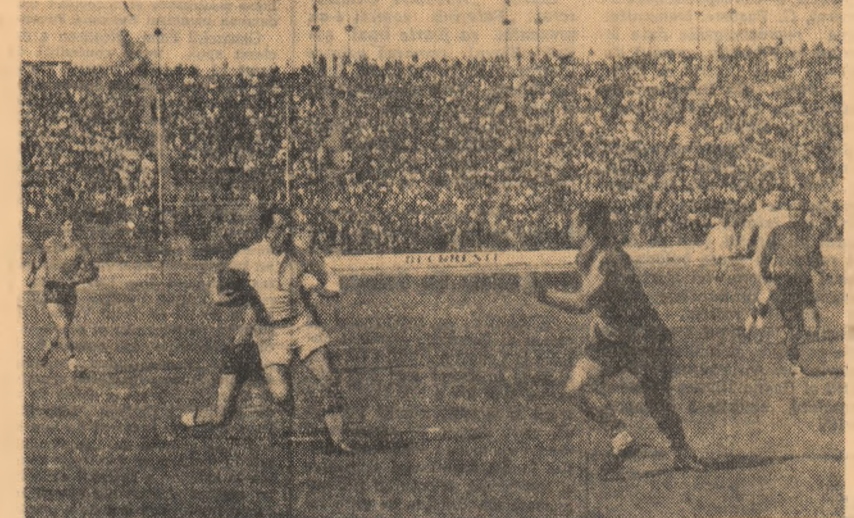
O fază din întâlnirea de rugbi Grivița Rosie - R.U.C. Casablanca.

Despre Sasu și cu asta ating o problemă de primă importanță, am impresia că nu a înțeles pe de-a-ntregul răspunderile ce-ți revin atunci