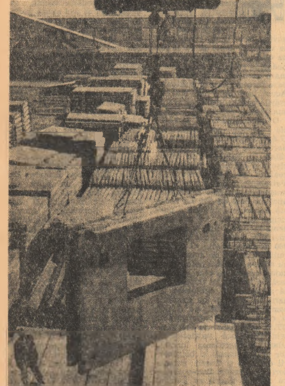
Aici, la întreprinderea de prefabricate „Progresul”, se nasc viitoare apartamente.