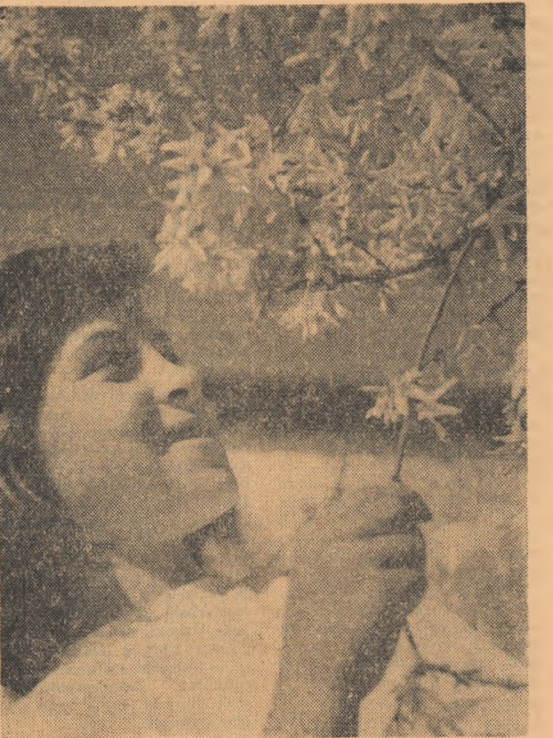
E primăvară