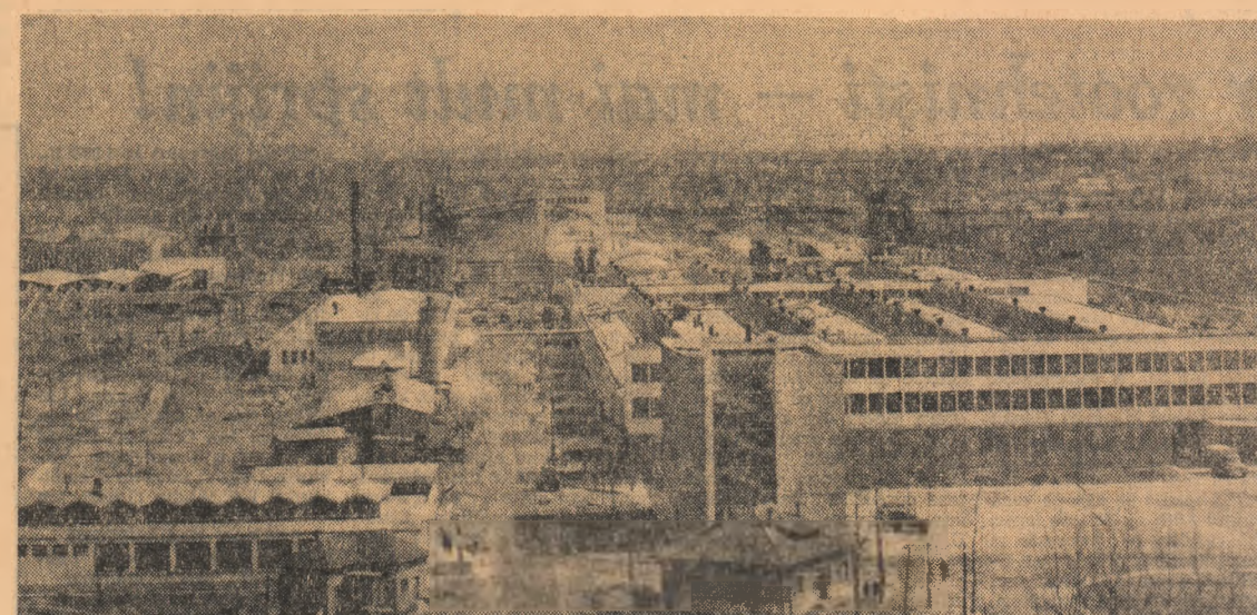
vedere generală a Combinatului de industrializare a lemnului din Pitești