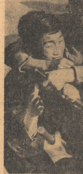
SEUL : Manifestațiile studențești antigovernamentale continuă. În fotografie : un student brutalizat de poliști în cursul ultimelor demonstrații

Agencia Reuter relatează că numărul persoanelor arestate în urma incidentelor din ultimele zile a crescut la peste 700.