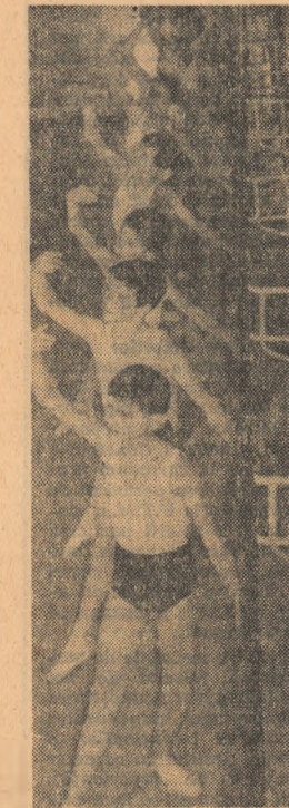
Școala de coregrafie din Cluj: viitorii balerini la un exercițiu