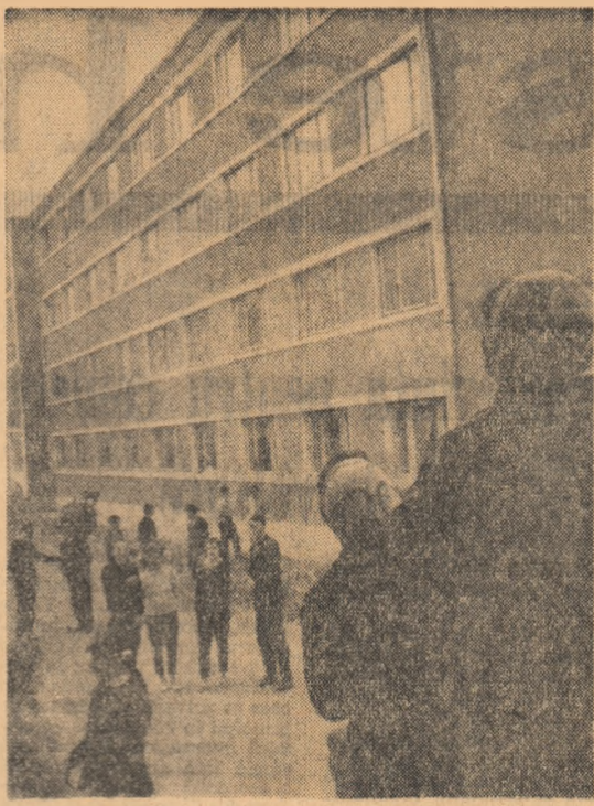
Internatul Centrului școlar agricol din Drăgășani, dat de curînd în folosință