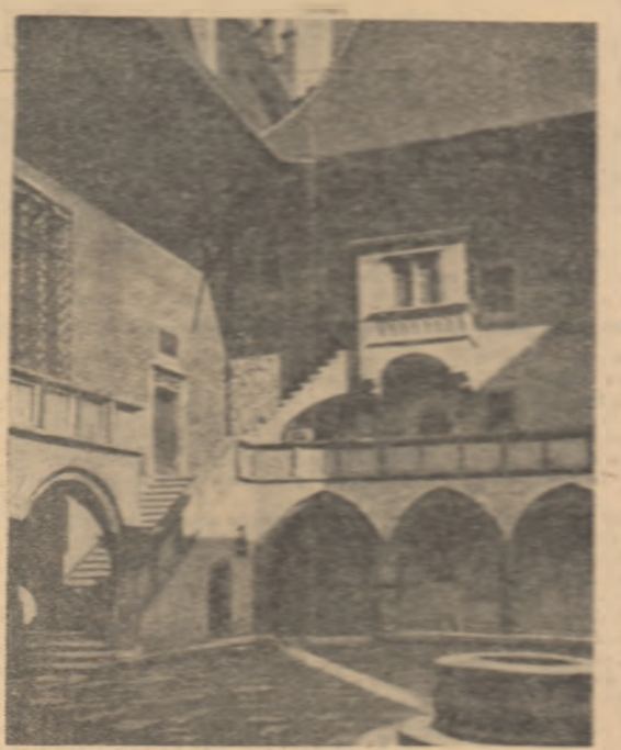
O vedere a străvechii Nere-Danub universități