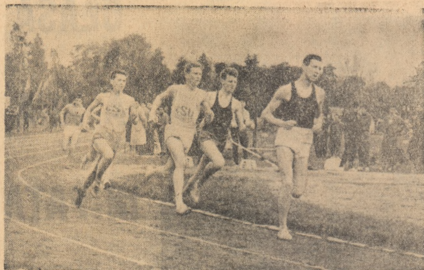
Stadionul Tineretului din Capitală a găzduit timp de două zile, întrecerile din penultima etapă a campionatelor universitare de atletism. Iată, în fotografie un aspect din proba de 800 m.