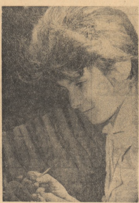
La Complexul de sticlă și faianță-Sighișoara. În plin proces de creație...

Planul de muncă al comitetului U.T.M. pe uzină prevede ca, o dată la două săptămîni, la club să se organizeze o „seară a tineretului”,