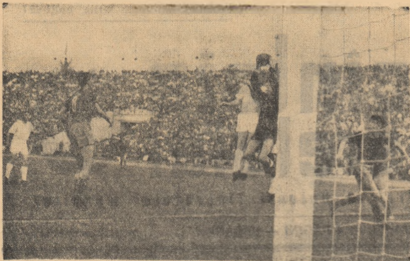
In verva, înalțarea formației Steaua pune la grea încercare apărarea dinamovistă.